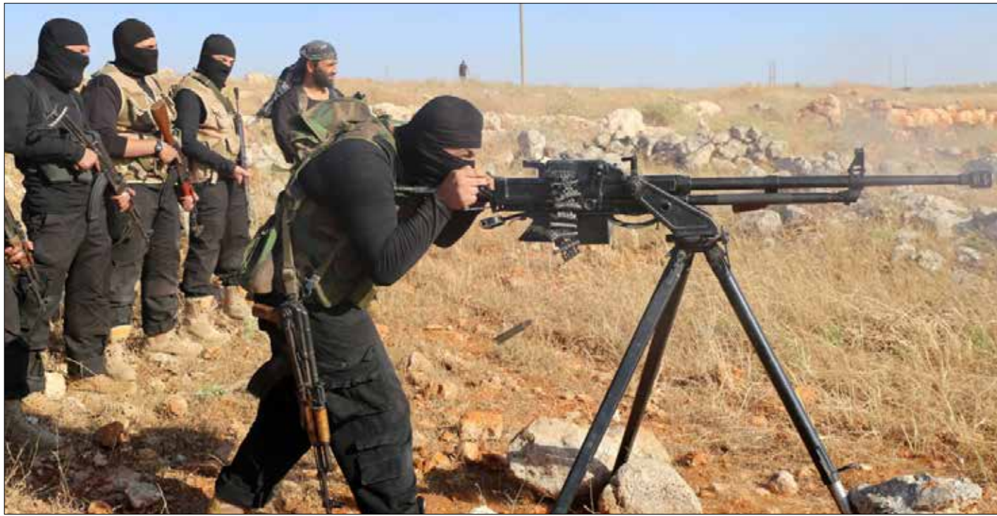
أكثر الحالات إشكالية هي بتّ أمر النساء اللواتي جرى تزويجهن عنوة لمسلّحين (الناضج)

كثرت القضايا امام المحاكم مع تمزيق المسلحين اوراق المواطنين الثبوتية