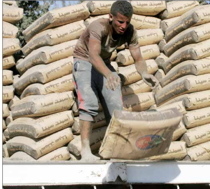
80% من الإسمنت الذي دخل غزة يباع في «السوق السوداء»