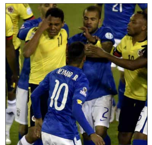
طرّد كك من نيمار وباكا عقب نهاية المباراة

فجر الخميس لم يقدم نجم برشلونة الإسباني ما قدمه في المباراة الأولى التي قاد فيها البرازيل للفوز على بيرو 1-2، حتى أنه وضع «السيليساو» في موقف لا يحسد عليه بتعرضه للطرّد عقب