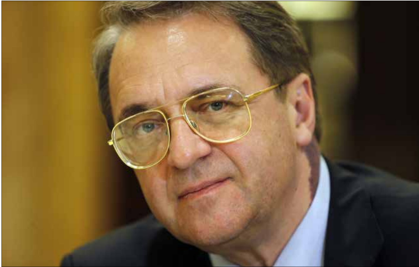
بوغدانوف: في لبنان اليوم «مسيحيون شيعية» و«مسيحيون سنة» ولهذا يجب التفتيش عن مرشح توافقي (هيلم الموسوي)

- أكد (السيد بوغدانوف) حرص روسيا على استقرار لبنان ووحدة أراضيه، وأبدى قلقه من الأوضاع الصعبة التي يمر بها والتي تهدد استقراره، سواء من الناحية الأمنية مع وجود المنظمات الإرهابية المتطرفة كـ«داعش» و«النصرة» في جرد عرسال، والمعارك التي تحصل حالياً بين حزب الله وتلك المنظمات. أكد اهتمام الرئيس بوتن المتزايد بالانتخابات الرئاسية في لبنان وحرص روسيا على انتخاب الرئيس في أقرب وقت ممكن، خاصة أنه الرئيس المسيحي الوحيد في المنطقة. وأشار إلى أن الرئيس بوتن كان قد بحث هذا الأمر مع رئيس الحكومة الأسبق سعد الحريري خلال لقائه به في مدينة سوتشي في أيار المنصرم، وأكد له أن روسيا ستبذل جهودها المكثفة مع كافة الأطراف المعنية الدولية منها والإقليمية. وتحدد مع إيران - لتسهيل انتخاب رئيس جديد للجمهورية في أسرع وقت ممكن. لفت إلى أن الموقف الروسي واضح لناحية ضرورة انتخاب رئيس توافقي في لبنان. وأبدى استغرابه لتمسك العماد ميشال عون بترشيحه بعد مرور كل هذا الوقت الطويل، ومع علمه بعدم إمكانية انتخابه لسدة الرئاسة، لأن فريقاً سياسياً كبيراً في لبنان لا يوافق عليه ولا يعتبره توافقياً. وهذا الأمر ينطبق برأيه أيضاً على الدكتور سمير جعجع الذي يعارضه فريق سياسي آخر كبير في البلد، ما يجعل انتخابه أمراً متعذراً.