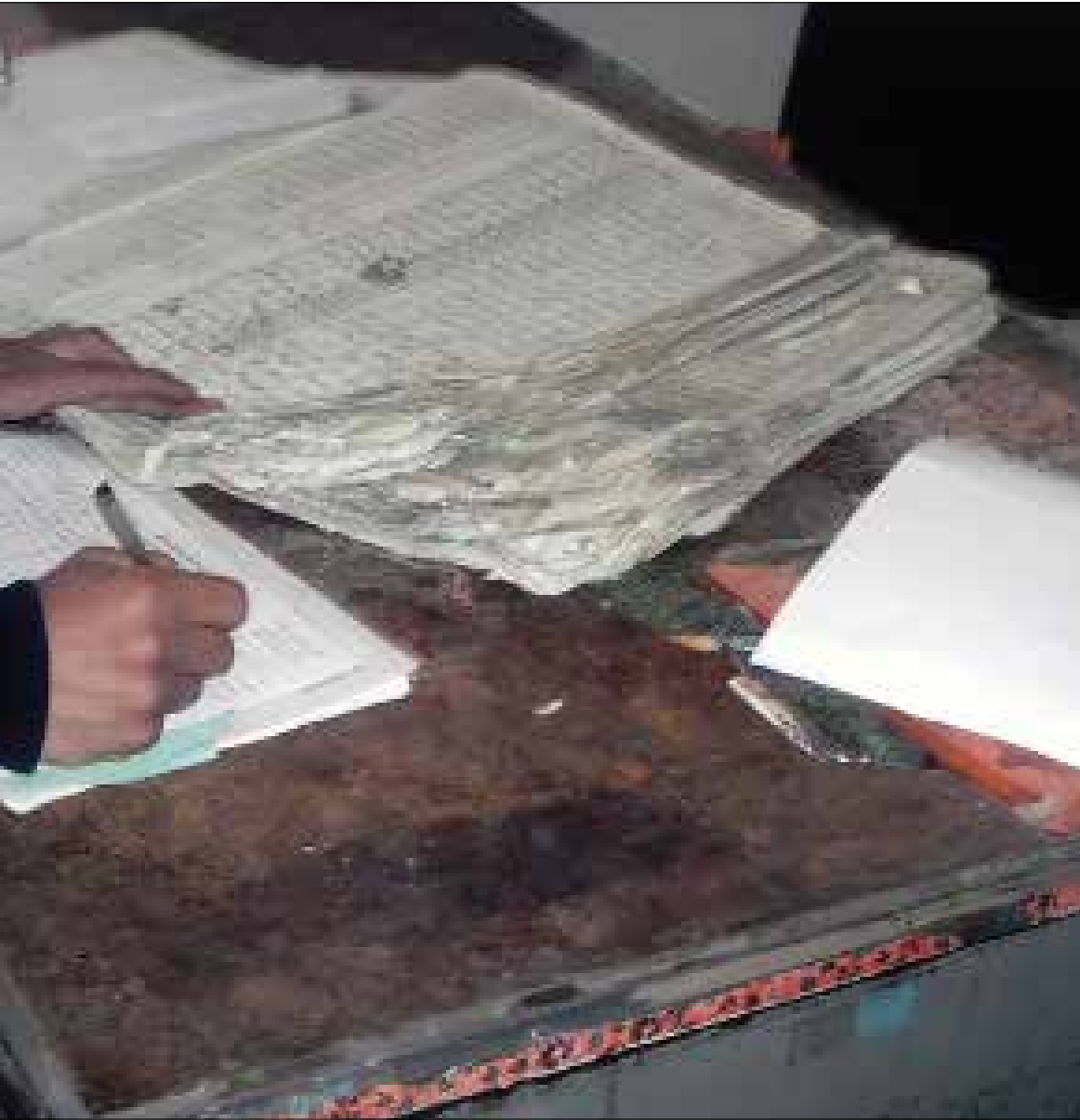
غالبية السجلات المنسوخة تحوي نقصاً كبيراً وفادحاً في بيانات المسجلين