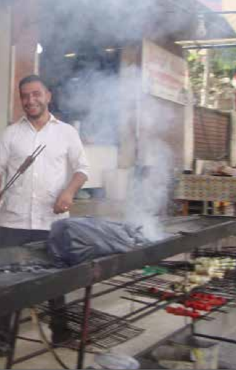
سيكون طبيعياً أن تصادف شريكاً في ملكية مطعم وقد افتتح «بسطة» لبيع اللحوم المشوية (الأخبار)

القاعدة، إلى جانب استعادة دبابة T72 وعربة BMB» كان المسلحون قد استولوا عليهما في معارك سابقة. وحاول المسلحون تخفيف الضغط على مقاتليهم الذين حاولوا الانسحاب من محيط تلتي خطاب وأعوّر بفتح جبهة سهل الغاب عبر الهجوم على بلدتي تل واسط والزيارة حيث دارت في محيطهما معارك عنيفة، تمكن الجيش السوري المتحصن فيهما من إنهاء المعركة لصالحه. وبين مصدر ميداني لـ «الأخبار» أن المسلحين في هجومهم الثاني كانوا يحاولون فتح ثغر لاقتحام تلك التلال عبر تغطية نارية مكثفة، إلا أن الكمائن