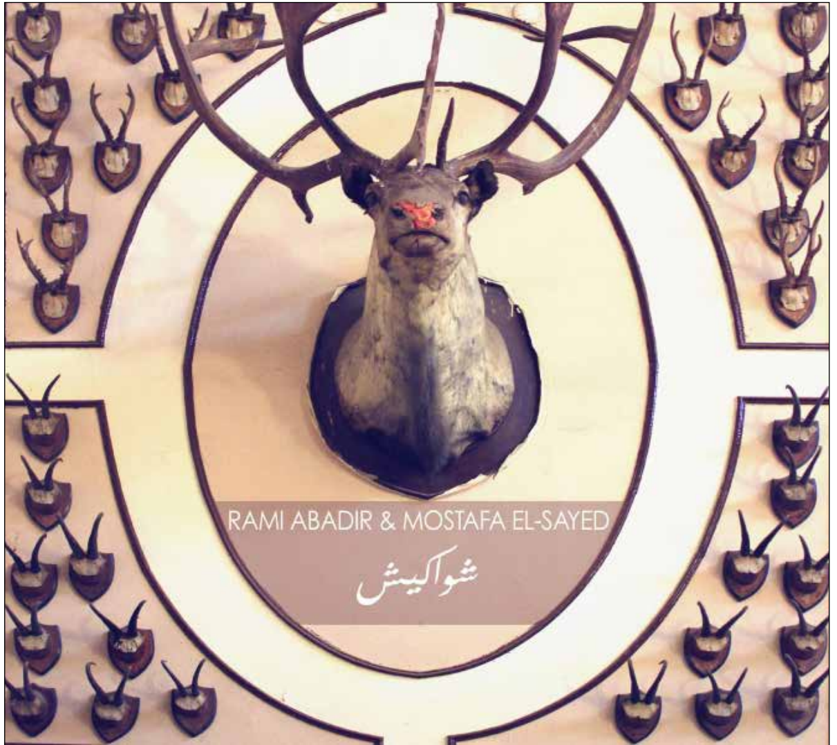
في الألبوم، حالة جذب وتنافر بين قطبي النوستالجيا والحداثة

التي تعاون فيها مع أحمد رزق الله. تنوعات موسيقية صافية تتواتر بين الأشياء وتفيضها، بين اللحم والكابوس، الأمل والسوداوية، الحنين والملل. في عالم الموسيقى، لا أشياء مؤكدة، فالموسيقى أشبه برجل المفاجآت. كل ما عليك فعله أن تنتظر ما سيحمله لك. في تراك «100 قطة»، تتحول الموسيقى إلى ما يشبه الميتافيزيقا، كأنات تتدافع من عالم آخر كأن تأتي قطة من هنا وأخرى من هناك. بدأ أبادير كعازف غيتار قبل أن يتغير مساره نحو الموسيقى الإلكترونية. لعبت موسيقى الروك دوراً بارزاً في مسيرته. أما السيد، فكان للروك التقدمي Progressive rock، وأعمال «بينك فلويد» تأثير كبير على انعطافته الفنية. ورغم أن موسيقى الألبوم تتخذ مساراً إلكترونياً، إلا أنها تلقي ظلالاً على الموروث الشعبي وجذور الحياة المصرية من خلال أسماء مقطوعات محددة مثل «يا ندامة»، «حُبيرة»، «رستم». في مقطوعة «حُبيرة»، تبدو الحالة العامة أشبه بمزيج حسي بين موسيقى الإنشاد الصوفي التي ترتقي نحو عوالم أخرى، وموسيقى أصوات الطبيعة. قد تجد نباح كلب أو عواء ذئب في ركن ما، بينما الغموض يكتنف الحالة العامة. وفي مقطوعة «شواكيش»، لا يختلف الأمر كثيراً، فالثيمة الموسيقية تشبه مشهداً لأيل مجروح تتخاطر دماؤه فوق الثلج. موسيقى تطاردك في كل زاوية وأبائل تصرخ خلفك كأنها هاربة من الجحيم. في نهاية الأمر، يساورك شعور بأن تلك الجملة الموسيقية تسد لك لكلمات متتالية في وجهك. هذا الشعور المتواتر بالأجواء الإسكندنافية في الموسيقى يوفّر حالة من الغموض والسحر معاً بداية من غلاف الألبوم الذي حمل موتيفاً لأيل مجروح الأنف