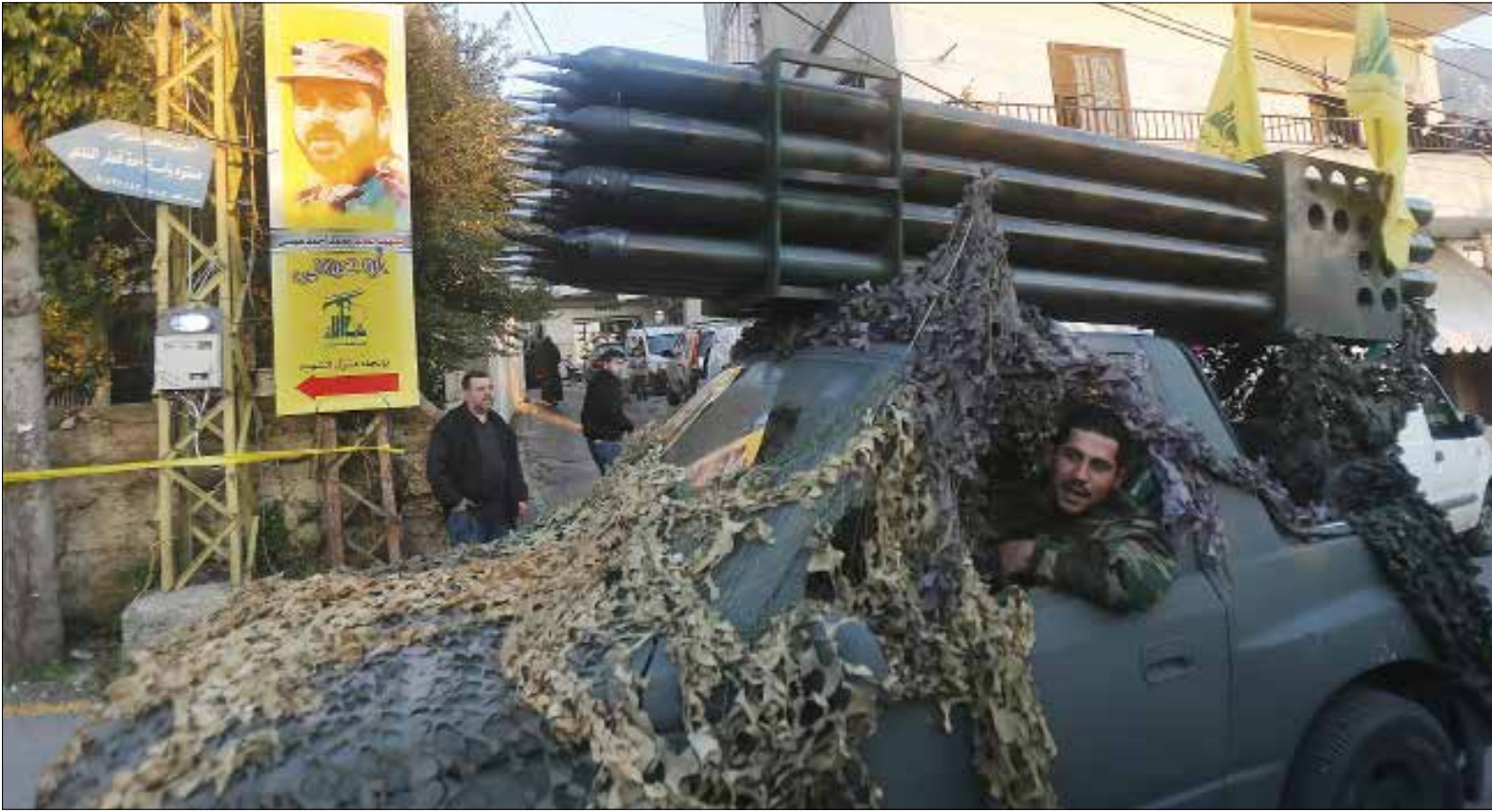
قلق خاص من الصواريخ ذات المدى المتوسط (هيلم الموسوي)

بحر اضافية، وفي مقدمها صاروخ «ياخونت»، او بإسمه الروسي «يستيون»، و«أذا اصاب هذا الصاروخ سفينة تجارية في عرض البحر تنجعه نحو اسرائيل، فمن شأن ذلك ان يغلق المجال البحري الاسرائيلي بشكل كامل، علما ان الافتراض العملي لدى الجيش، بأن هذا الصاروخ، الأسرع من الصوت، وصل بالفعل الى حزب الله في لبنان». كما ان التقديرات في الجيش الاسرائيلي ان في حوزة حزب الله «نموذجاً بحرياً من صاروخ فاتح 110»، إضافة الى وسائل قتالية غير ماهولة مسيرة عن بعد، بما يشمل قوارب وزوارق مفخخة (انتحارية). ولدى سؤال «واللا» ضابطاً كبيراً في البحرية الاسرائيلية عن قدرات حزب الله، رفض التطرق لهذا الموضوع، وفضل التحدث عما اسماه «الانفاق البحرية»، اذ اشار ان «الخشية موجودة في البحر كما هي موجودة في البر، وتحديدًا من النفق البحري، اذ يمكن ان نرى تهديداً شبيهاً بأسلوب «السرب» الايراني، الذي يرسل البات سريعة وصغيرة باتجاه وسائل ملاحية تابعة لسلاح الجو»، الامر الذي أكد عليه أيضاً شابيير بقوله: «فرضية العمل لدى اسرائيل هي ان حزب الله قادر على تبني العقيدة الإيرانية، التي تشتمل على عدد كبير من وسائل الملاحية الصغيرة والسريعة، التي تنقض على وسيلة إبحار كبيرة بهدف إغراقها».