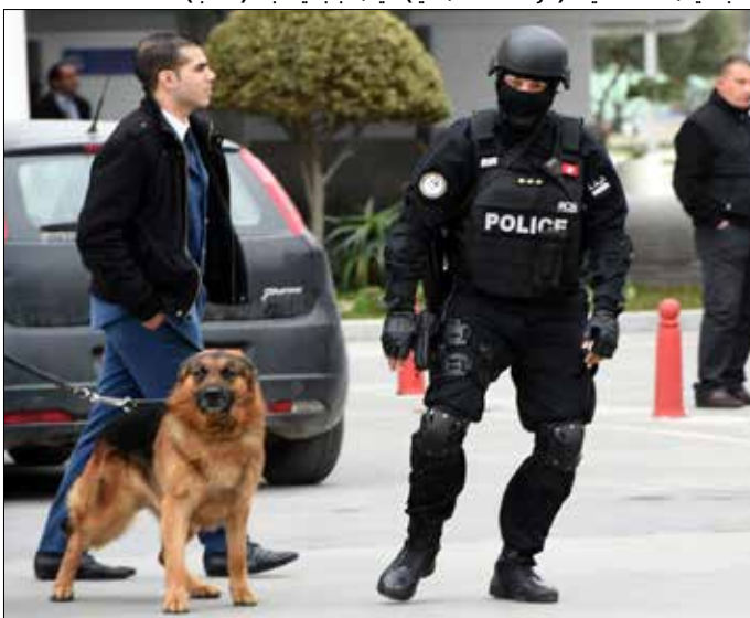
السبسي: هناك تحقيق (حول الخلل الأمني) سيذهب بعيداً جداً

أمنية في المراكز السياحية والمواقع الأثرية»، كما ستجري أيضاً، وفق ما صرح به الوزير لـ «الأخبار»، «مراجعة منظومة العمل برمتها». وأكد أنه قد جرى فعلاً الإنطلاق في ذلك على مستوى متحف باردو حيث جرى تركيز مركز أمن جديد وجرى تجهيزه بألات تفتيش ومراقبة حديثة ومتطورة. وقال الغرسلي إنه سيجري خلال الأيام القليلة المقبلة تدعيم المنظومة الأمنية بمعدات وتجهيزات لوجستية جديدة لمقاومة الإرهاب، مؤكداً أن دور الوحدات الأمنية وحده لا يكفي وأن حرب مقاومة الإرهاب تتطلب وقفة حازمة من جميع مكونات المجتمع المدني، وخاصة منها وسائل الإعلام والمواطن العادي الذي يعد العنصر الفاعل في مساعدة الوحدات الأمنية على بذل قصارى جهدها في اجتثاث أفة الإرهاب من جذورها. وأعلن أن الوحدات الأمنية في كامل أهيبتها واستعدادها لإنقاذ تونس من الخطر الذي يترصص بها. ويذكر أن رئيس الحكومة التونسية، الحبيب الصيد، كان قد عين خلال زيارته محيط متحف باردو - سيعاد افتتاحه اليوم - والبرلمان العديد من النقائص التي تحول دون جعل المنظومة الأمنية نافذة وفعالة وقرر اثر ذلك تخصيص المسجد الموجود بمحيط مجلس نواب الشعب للنواب والعاملين بالمكان، وفق بلاغ يوم الاثنين،