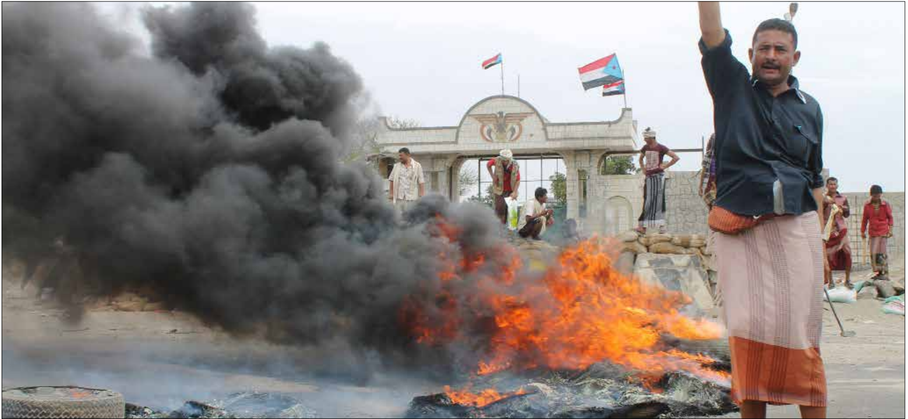
استخدمت «أنصار الله» تعزيزات عسكرية إلى الجنوب

تلويح الرياض بتدخل عسكري، بطلب من الرئيس المستقيل عبد ربه منصور هادي، سابق الحسم الحوثي في الجنوب اليمني، في ظل تعزيزات عسكرية سعودية على الحدود تترافق مع مناورات مع القوات الباكستانية على معارك في مناطق وعرة تحاكي، على ما يبدو، تضاريس صعدة في المال اليمني