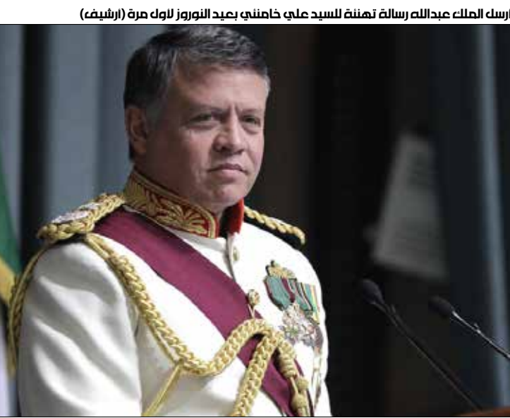
ارسلك الملك عبدالله رسالة تهنئة للسيد علي خامنئي بعيد النوروز لاول مرة (ارشييف)

العلاقات بين عمان وطهران التي مرت بأزمات أعاققت تقدمها، تشهد أخيراً تغييراً طرأ على خطاب عمان الراجبة في إعادة هيكلة تلك العلاقة على كافة الصعيد وإبرازها في الملف السياحي الذي كان ملف خلاف سابق. فقد أعلن وزير السياحة نايف الفايز في تصريح منذ أيام أن الإيرانيين بإمكانهم زيارة الأردن في أي وقت أرادوا على الرغم من أن جنسيتهم تعتبر من الجنسيات المحققة، ما أثار زوبعة من التساؤلات حول مصير التعاون بين الطرفين في المستقبل القريب. ويعيش الأردن حالة من اللغط والتناقضات الرسمية؛ ففي ظل تصريحات الفايز، خرج وزير الأوقاف هائل داود ليؤكد ضرورة إغلاق ملف العلاقات مع إيران في الوقت الحالي لما تعيشه المنطقة العربية من صراعات إقليمية ووطنية. تصريحات داود جاءت متناقضة مع الخطوات التي أقدمت عمان عليها أخيراً من زيارة لطهران لحضور مؤتمر التقارب الديني، ما عزز فكرة وإمكانية تعزيز الروابط وفتح قنوات بين البلدين، ولقائه ابن المرجع الراحل السيد محمد حسين فضل الله،