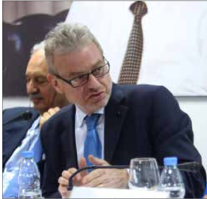
باولي حوّل السفارة مركزاً لأعمال أمنية (مروان بوحيدر)

السفير الجديد معاد لدمشق، ومن أنصار بناء شراكة مع الرياض