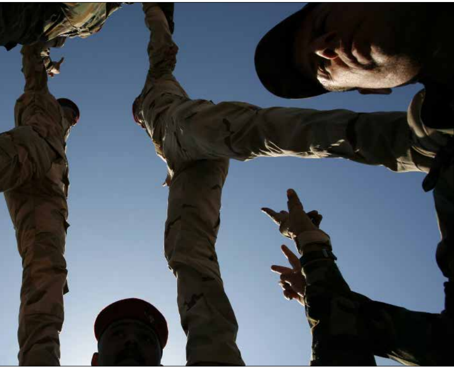
حده الصرام وإهنيته تجلج من الصعب على المتابعين فهم حقيقة المشهد

قوة الفورة التي تقودها السلطة المركزية، وتعاضم بربرية الإرهابيين وانكشاف صورتهم البشعة، أظهرت أن «داعش» ليس سوى وعاء خارجي أخطبوطي، يخفي في ثناياه خلاط متحدة في بعض الأهداف، غير متجانسة في التركيب، تضم قوى مختلفة، تبدأ من خلايا استخبارية، إلى متطوعين جهاديين سلفي العقيدة متنوعي الجنسيات، وصولاً إلى قوى علنية: تيارات وهابية، إخوان مسلمين، بقايا الديكتاتوريات، حلقات متساقطة من صراعات سابقة في الشيشان والبلقان وآفغانستان، عناصر أمنية وعسكرية