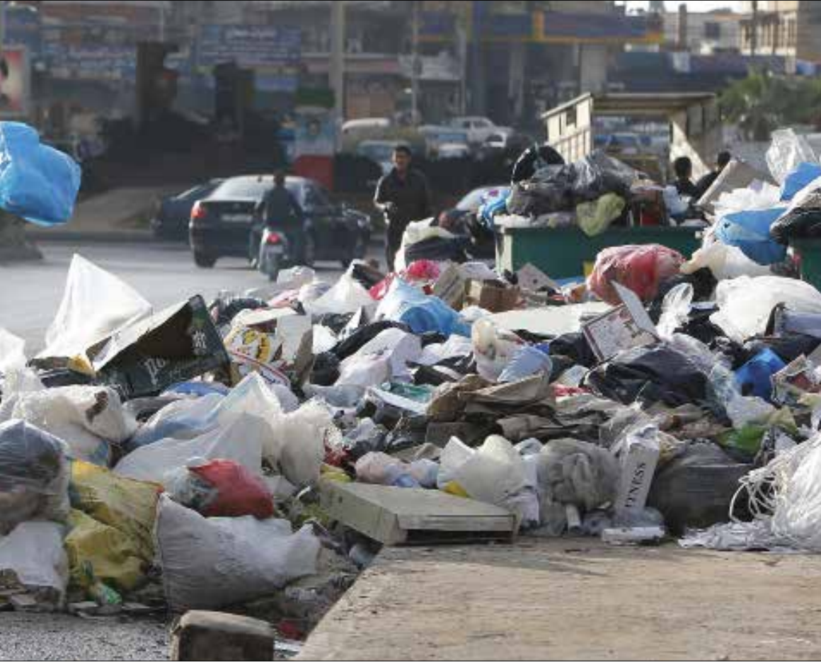
محامي شركة الجهاد نفى استخدام عقاراتها في الجية لمعالجة النفايات (هيثم الموسوي)