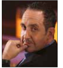
«ليالي الأسس» عاهرة اليوم - على otv 21:30

ضمن تصنيفاته الأسبوعية، يقدم برنامج Top Ten (إعداد وتقديم: سلام الزعتري) في موسمه الرابع، أقدم 10 برامج ألعاب لبنانية على الشاشات المحلية، من الأقدم إلى الأحدث. وذلك ضمن إطار معلوماتي مشوّق يعيدنا بالذاكرة إلى حقبات سابقة، مظهراً اختلافاً عما نشاهده اليوم.