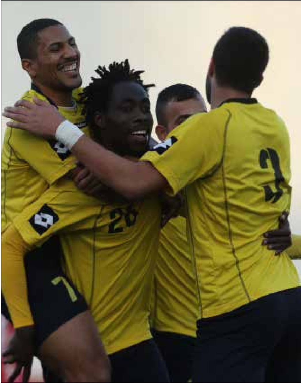
لاعب العهد دينيس يحتفك مع زملائه بالهدف الثاني في مرصه التضامن صور

تسببت فريقة العهد بصدارة الدوري اللبناني لكرة القدم. بعد ان تخطى «قطوع» مضيفه التضامن صور بفوزه عليه 2-1 في افتتاح الاسبوع الثاني عشر من الدوري الذي سيستكمل اليوم بثلاث مباريات أبرزها بين الإخاء الأهلي عاليه ومضيفه الانتصار ويختتم غداً بمبارتين إحداهما بين النجمة والراسينغ