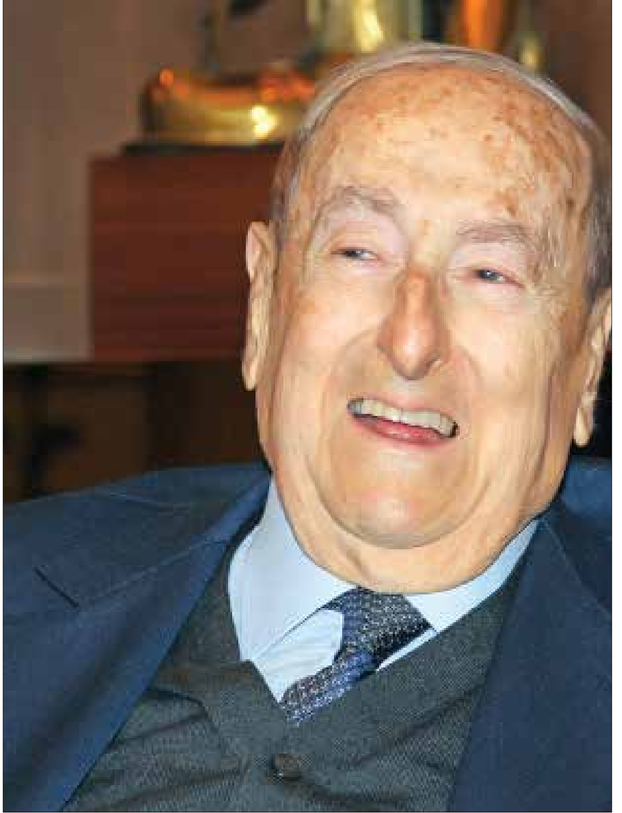
عون وحده الماروني الأقوى وليس عقبة في طريق الاستحقاق (الأخبار)

من يعيد الاعتبار إلى الجنوبيين الأربعة، الذين اضطروا إلى الهجرة بسبب الاحتلال لجويا وعيتيت (قضاء صور) من العدو الإسرائيلي والموساد الذي حقق معهم ومارس ضدهم التعذيب لحوالي أسبوعين؟ لن يطالب طحيني برّد الاعتبار. «ممن؟» يسأل. فما حصل معهم «نموذج للعهر العالمي».