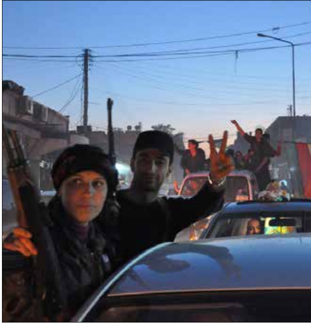
حزب الجيش السوري 8 قرية في ريف القامشلي

الشرقي لمدينة القامشلي وسيطر على عدة قرى (الطفيحية، وخربة نورا، وخزنة، وتل أحمد، وتل عنبر، وفرفرة والطواريج وتل سطيج) مع تقدم مستمر له في المنطقة.