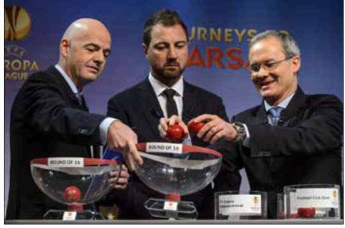
شحتب القرعة أمس في نيون

سيكون المتابعون أمام مباريات قوية مرتقبة في دور الـ 16 لمسابقة «يوروبا لينغ» في كرة القدم بعد سحب القرعة أمس في نيون السويسرية، التي وضعت إشبيلية الإسباني حامل اللقب في مواجهة صعبة ضد مواطنه فياريال، فيما وقع روما الإيطالي في مواجهة مواطنه فيورنتينا. وفي ظل وجود خمسة أندية إيطالية في دور الـ 32، كان هناك احتمال كبير لأن تسفر القرعة عن مواجهة إيطالية بحثة واحدة على أقل تقدير، وهذا ما حصل بعدما وقع روما مع فيورنتينا الذي يشرف عليه مهاجم «جالبوروسي» السابق فينتشينزو مونتيللا. وإذا كان وقوع روما في مواجهة فيورنتينا الذي كان قد أطاح فريق العاصمة من الدور ربع النهائي لمسابقة الكأس المحلية بالفوز عليه في الملعب الأولمبي 0-2 في أوائل الشهر الحالي، لم يكن مستبعداً في ظل وجود خمسة أندية إيطالية،