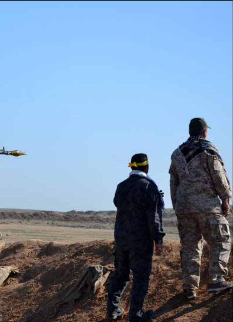
عناصر من «بدر» ينتشرون في مناطق قريبة من تكريت

تلك التي عثر عليها في نينوى. وهو يضم أربع قاعات عرض كبرى مخصصة لآثار القديمة (عصور ما قبل التاريخ) والآشورية والحضرية (آثار مدينة الحضر) والأسلامية. مع الغزو الأميركي للعراق أقفل المتحف أبوابه سنة 2003 حفاظاً على مقتنيات بعد عمليات النهب المنظمة برعاية الاحتلال لعدد كبير من المواقع الأثرية والمتاحف ومنها متحف بغداد. قبل أن يعاد فتحه في 2012 لتلامذة المدارس وطلاب الجامعات. في الوقت نفسه بدأ في إيلول من العام نفسه العمل بمشروع تاهيل المتحف تمهيداً لفتحه للعموم. مثل الاحتلال الأميركي للعراق وما رافقه من دمار ونهب واستباحة، منظمة ومرعية في قسم منها، إلى أضرار كبيرة لحقت بالثروة التاريخية لهذا البلد، تمثلت بتدمير مواقع أثرية عديدة بفعل الأعمال الحربية أو أعمال النهب والتنقيب غير المشروع بهدف الاتجار باللقي الأثرية، وسرقة مقتنيات المتاحف، إضافة طبعاً إلى غياب الصيانة والاهتمام، مثل خسارة كبرى لا تعوض في أجزاء منها، ولا سيما التي طأها الدمار. وكان من نتائجه فقدان أعداد كبيرة من التحف التي جرى تهريبها إلى خارج العراق وبيعت لجامعي اثريات أو متاحف عالمية وبواسطة دور مزادات معروفة، والعمليات موثقة في قسم كبير منها. أما القسم الثاني، فكان مصيره التدمير محلياً.