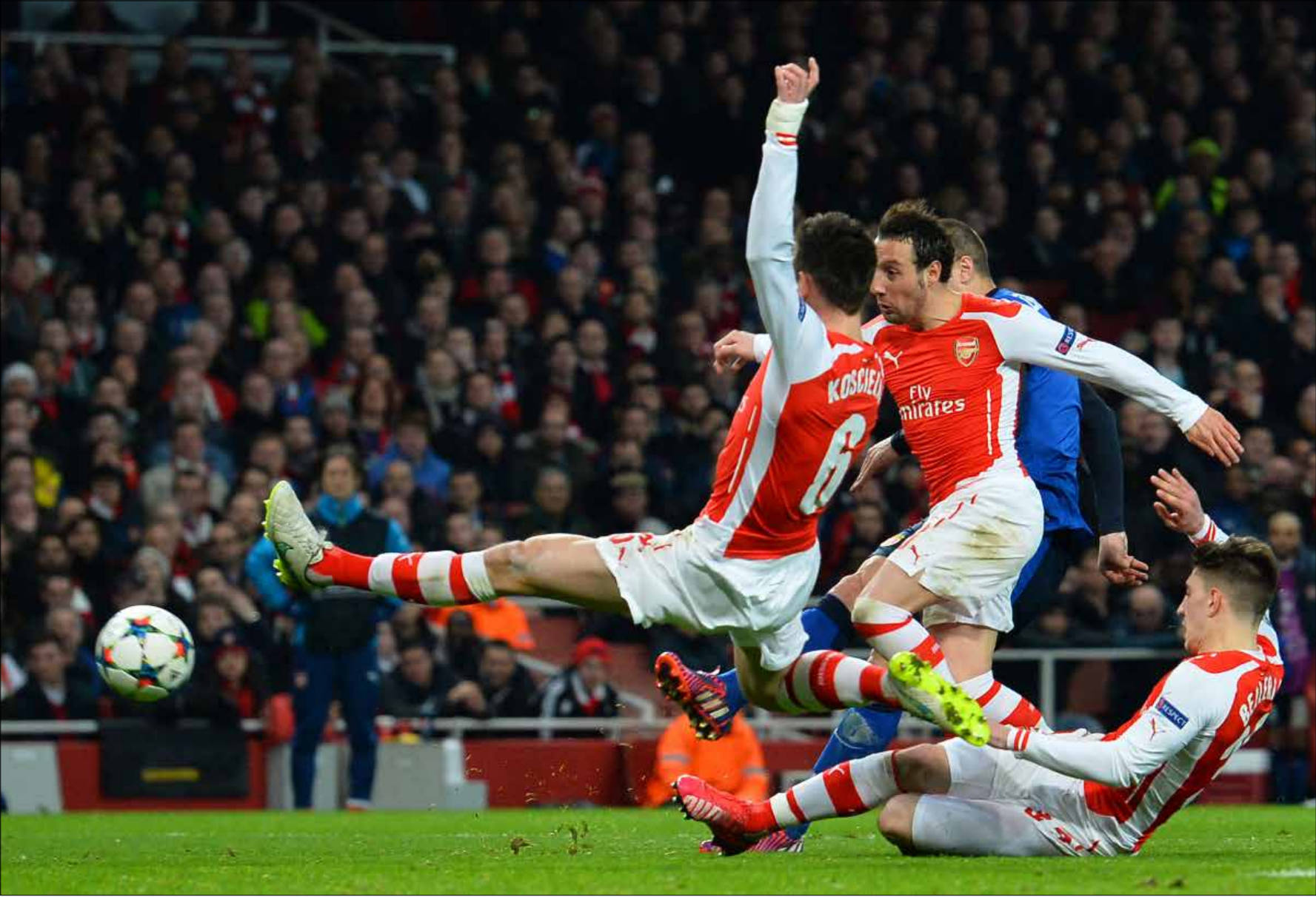
نتائج كارثة للفرق الإنكليزية في البطولات الأوروبية

بجديد على «البريمير ليغ»، وليس بجديد أيضاً أن لا راحة للفرق الدوري الإنكليزي. هذا صحيح، لكن ما هو صحيح أيضاً أن الفرق الكبرى في البلدان الأخرى تقدمت، إن لناحية نوعية النجوم في عدادها، أو تكتيكياً عبر مدرّبين مميزين وخطط جديدة، فيما ظلت الحال على ما هي عليه في إنكلترا.