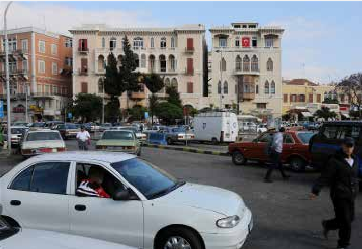
استغرقت الهيئات الطرابلسية تمجيد الأمور والضغط على المجلس البلدي لإمرار المشروع (مروان طحطح)