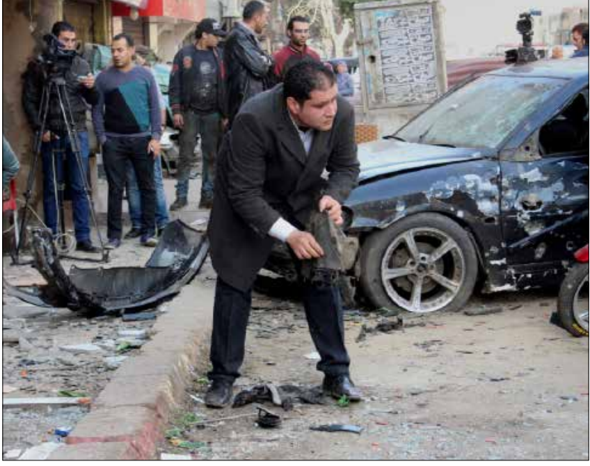
من أحد مواقع الانفجارات المتفرقة التي تحدثت في القاهرة ومدن أخرى بين حين وآخر

حال رفض الرئيس إصدار قانون أقره المجلس، فإن موافقة ثلثي أعضاء المجلس على القانون بعد رفض الرئيس يجري بموجبها إصدار القانون. أيضاً يمتلك البرلمان حق مراجعة جميع القوانين التي صدرت في المرحلة الانتقالية خلال أول أسبوعين، وإن كان موعداً ضيقاً، لكنه سيدخل النواب في جدل كبير تجاه عشرات التعديلات وصيغها، ثم يجري الانتقال إلى قضية تشكيل الحكومة من الأغلبية التي حصدت أكثر الأصوات. المؤكد أن السلطة الحالية تخشى تركيبة البرلمان المقبل وخاصة مع غياب رؤية أو توقع لسيطرة تيار سياسي محدد، بالإضافة إلى قضية الصلاحيات الواسعة التي يمكن أن تكون سبباً في صدام مبكر مع الرئاسة، وهكذا يظهر أن إجراء الانتخابات حتى الاستقرار على تشكيل سياسي مناسب ليحصد الأغلبية البرلمانية فكرة تالفها السلطة. ومن المقرر أن تفصل الأحد المحكمة الدستورية العليا في الطعون المقدمة على دستورية عدد مواد قوانين الانتخابات، وفي مقدمتها تقسيم الدوائر الذي في حال الحكم بعدم دستوريته سيرجى إجراء الانتخابات إلى أجل غير معلوم كي تنهى التعديلات التي توصي بها المحكمة، فيما باتت الفئة المحسوبة على الرئيس تروج لأهمية تأجيل الانتخابات حتى «تكون على أساس قانونية ودستورية سليمة» ولو استغرق الأمر المزيد من الوقت. عموماً، لن يكون السيسي سبباً في تأجيل الانتخابات التي تعتبر الخطوة الثالثة في خريطة الطريق المرسومة على يده في الثالث من يوليو قبل الماضي، ولكنه سيكون رجلاً ملتزماً بتطبيق القانون والدستور كما يظهر... أما إذا جرت الانتخابات في موعدها، فمن المؤكد أن ثمة إجراءات وتشريعات ستصدر قبل أن تنعقد أولى جلسات مجلس النواب من أجل تجنب الصدام المبكر مع الرئاسة.