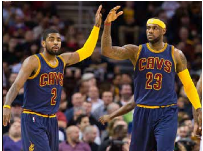
جيمس (23) محتفلاً مع زميله كيري ايرفينغ بفوز كليفلاند

الأولسى، وذلك بعدما انتفض في الشوطين الثاني والإضافي بتسجيله 31 نقطة، لكنه لم يتمكن من ترجمة سلة التعادل لفريقه في