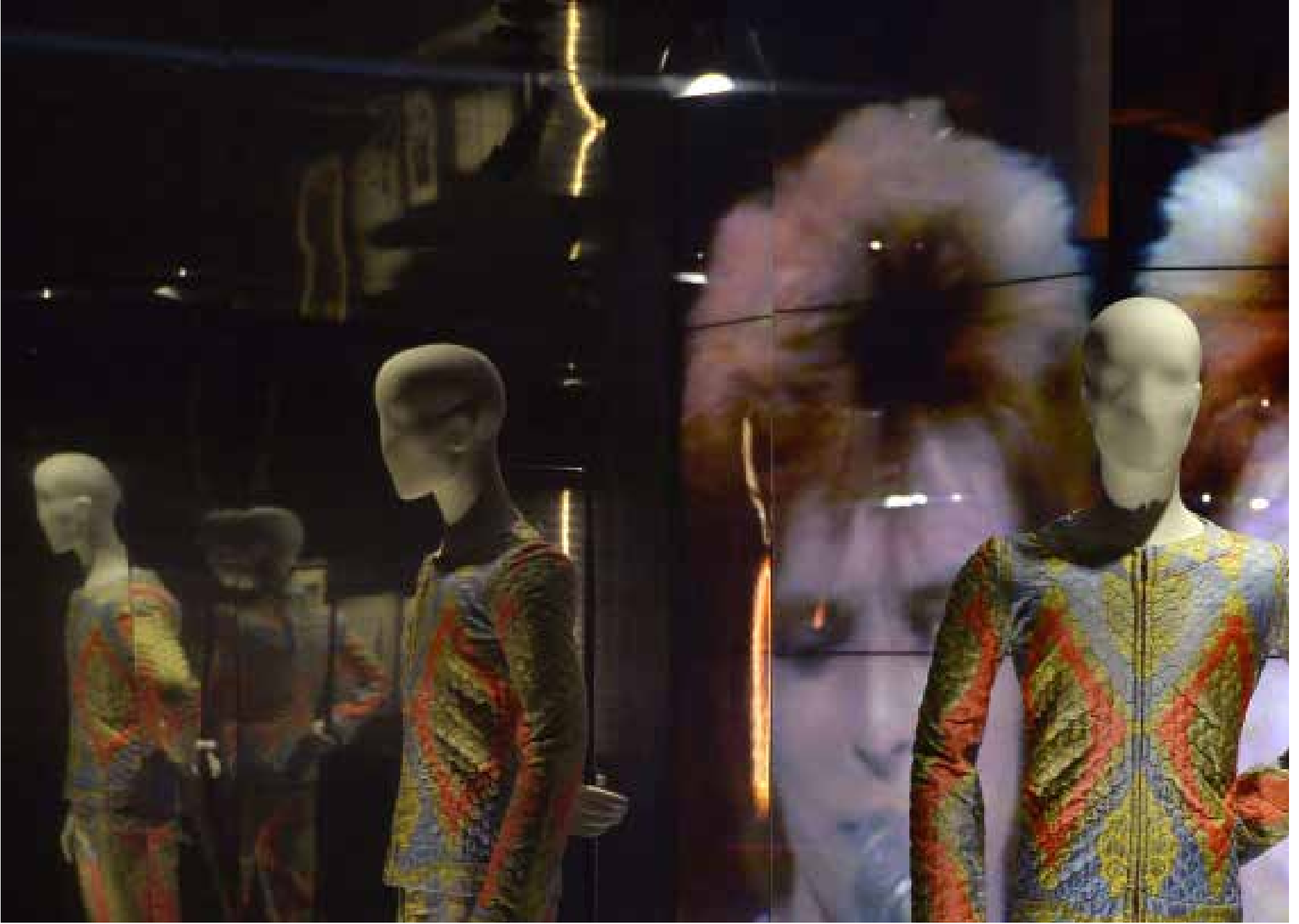
David Bowie is هو عنوان المعرض الذي سينطلق في الثالث من آذار (مارس) المقبل ضمن إعادة افتتاح صالة Philharmonie في باريس. يستمر المعرض حتى 31 أيار (مايو) 2015 ويحتوي على مجموعة كبيرة من مقتنيات المغني البريطاني الشهير دايفيد بوي (1947). إضافة إلى المستندات، والتسجيلات، والصور، والفيديوات، والأزياء التي تضم تصميمات مستوحاة من فيلم Clockwork Orange لستانلي كيوبريك. سبق للمعرض أن حقق نجاحاً كبيراً في لندن عام 2013. وقد حظ في باريس أخيراً في إطار جولته العالمية.