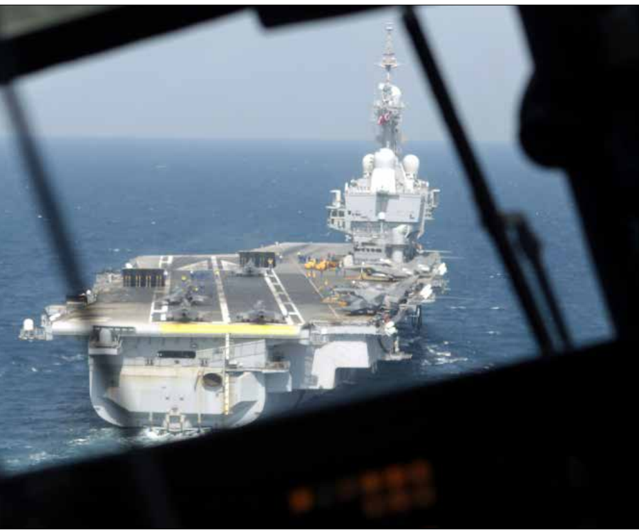
يقوم الغرب بإعادة شحذ أدوات حروبه الماضية في بلاد العرب والمسلمين

والجلد الدوري في الساحات العامة. لقد أُلصق التوحّش بالإسلام في الغرب، وحتى في الشرق حيث اجترّ الاستشراق المحلي (الكنسي غالباً تاريخياً) مقولات العداء والكراهية ضد الإسلام. والخطاب النقطي السعودي الموالي للغرب الصهيوني بات معنيّ بإعادة نشر وضخ مقولات الصهيونية الغربية نفسها ضد العرب والمسلمين. ولهذا فإن صفحات جريدة «الشرق الأوسط» و«لمجلة» (المملوكتين من قبل الملك السعودي الحالي) باتت تعجّ بكتابات عناء الصهاينة وكارهي الإسلام في الغرب. أفردت مجلة «المجلة» مقالة غلاف مسهبة لليكودي الصهيوني، جوشوا مُرافتشيك، وهو ليس أكاديمياً وليس خبيراً في شؤون الشرق الأوسط إلا إذا كان التعصّب ضد العرب هو الاختصاص الشرق اوسطي عينه - وهذا سار في المعيار الصهيوني في أميركا، لنقد وإهانة وتشويه كتابات الراحل إدوار سعيد. أي أن حماية «الحرمة» باتوا المسوّقين المحليين لعقيدة معاداة الإسلام، وللعقيدة التي تسهم في تقبيح صورة الإسلام في الغرب والشرق على حدّ سواء.