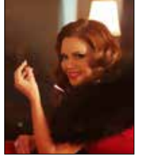
النجوم يرقصون غداً - على mtv 20:35

في الحلقة ما قبل الأخيرة من برنامج «العرب مواهب»، تتصاعد المنافسة بين المشتركين للوصول إلى الحلقة النهائية الأسبوع المقبل. ويختتم العمل الذي يبحث عن المواهب بتتويج الراح، على أن يلي ذلك مؤتمر صحافي يضم لجنة التحكيم: نجوى كرم (الصورة)، علي جابر، أحمد حلمي وناصر القصبى.