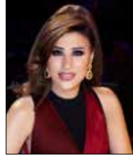
قبل اختتام «العرب مواهب» اليوم - على mbc 20:00