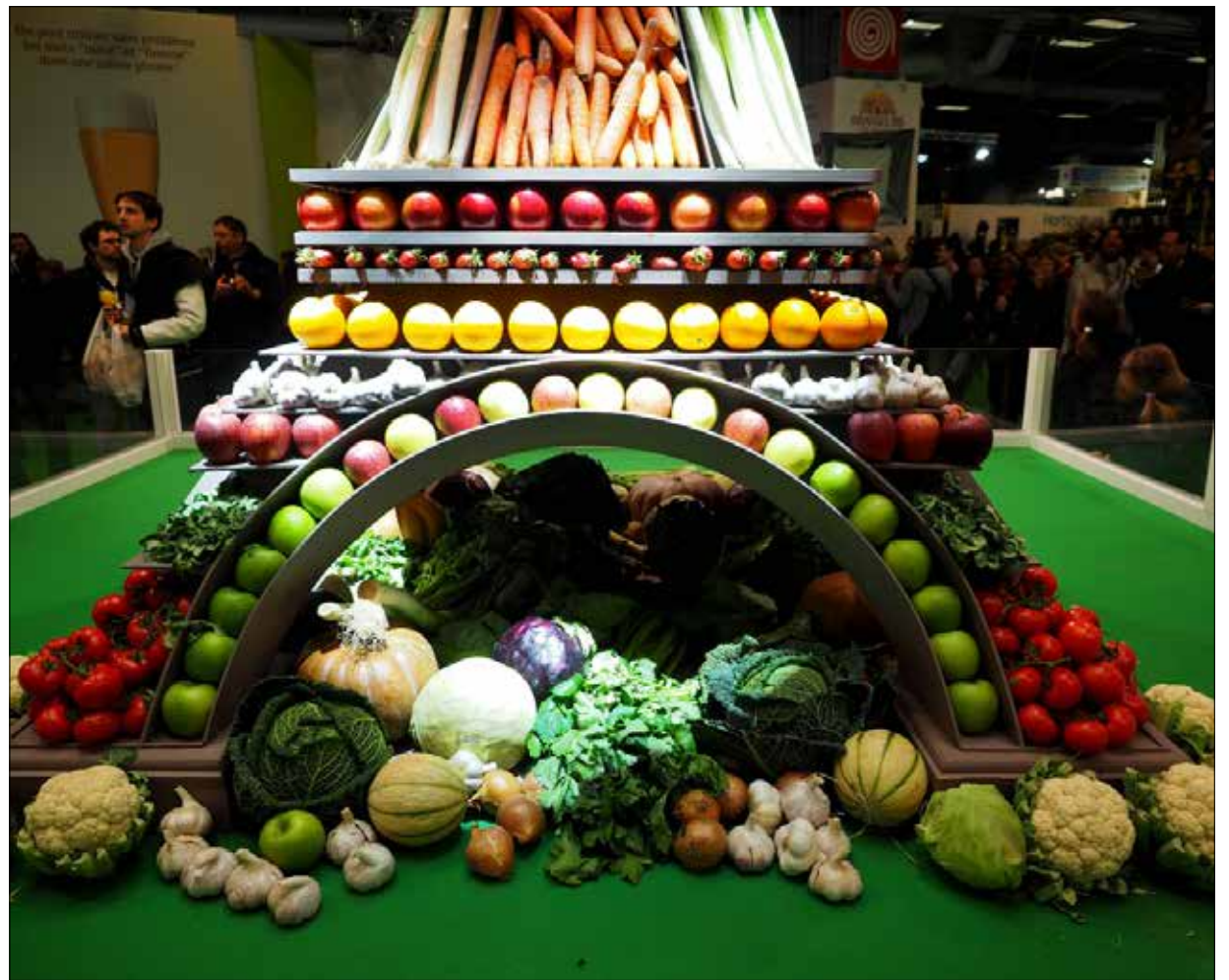
خلال الدورة الـ 52 من «معرض باريس الدولي للزراعة» في بورت دو فيرساي، في بورت دو فيرساي، في بورت دو فيرساي (فبراير) حوالي 4000 نوع من الفواكه والخضروات والفواكه، وهو افتتح في 21 شباط (فبراير) الجاري ويستمر حتى الأول من آذار (مارس) المقبل. إسهام القطاع الزراعي في تغذية ظاهرة الاحتباس الحراري، وانعكاسات التغيرات المناخية القصوى على هذا القطاع هما محوران أساسيان في المعرض هذا العام، علماً بأن أكثر من 700 ألف شخص زاروا الحدث العام الماضي