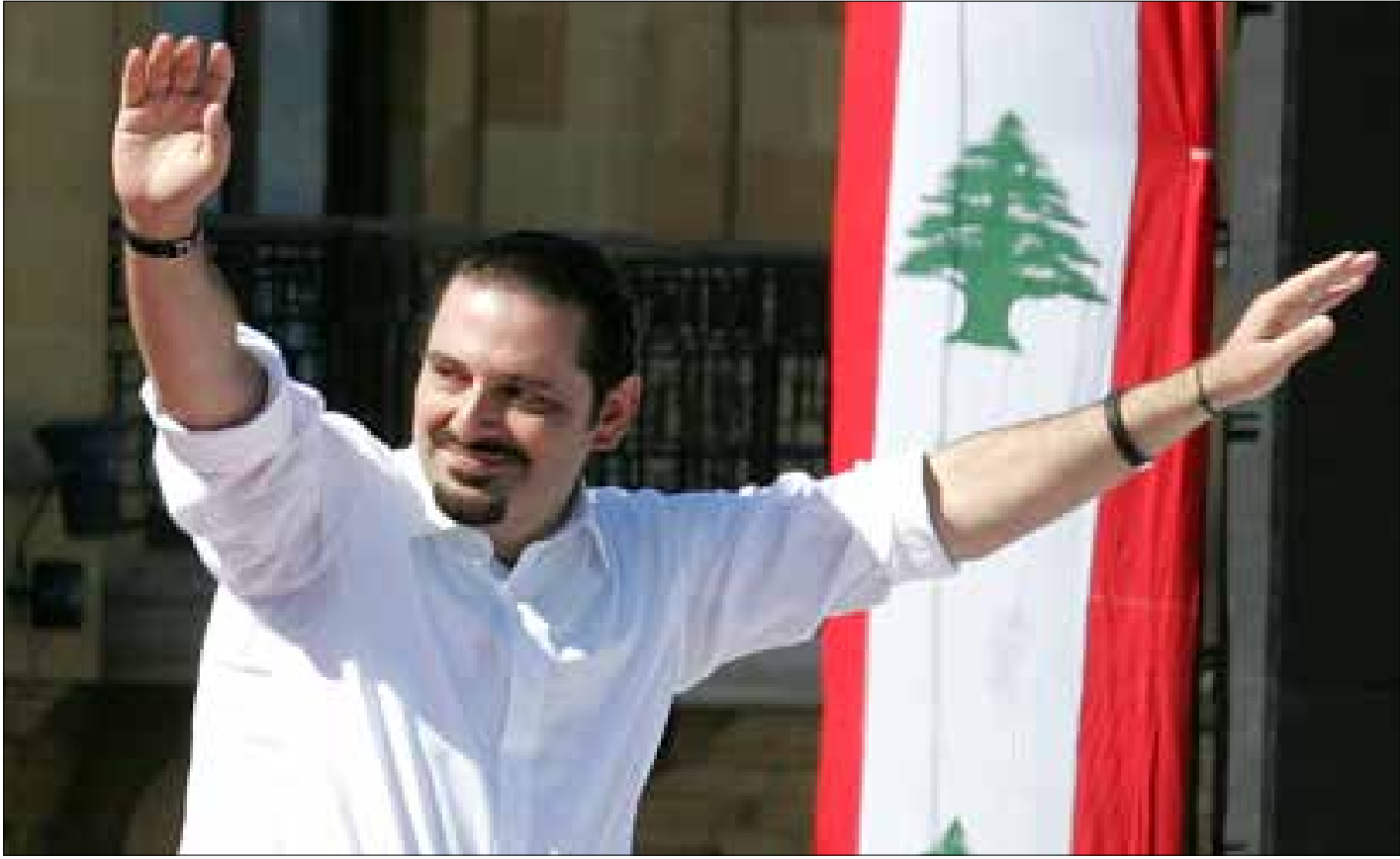
الحريزي يراهن على حكمة حزب الله في إدارة الملفات الخارجية

الحريري يريد حواراً منتجاً لاتفاق يسمح بتسوية أمور داخلية كثيرة، ويسمح بتحريك عجلة الدولة من دون رهن كل أمورهما بما يجري حولنا. وهو يكتفي، بما خص الملفات الخارجية، بكيفية إدارة