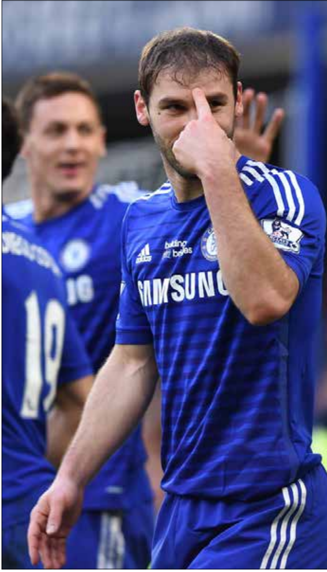
في آخر ست مباريات مع تشلسي سجل إيفانوفيتش أربعة أهداف

الـ 16 أيضاً، ما فتح الطريق أمام «البلوز» للوصول إلى اللقب. واجه إيفانوفيتش أقوى المهاجمين، ونجح في التعامل مع معظمهم، سريعين كانوا أو موهوبين، حيث قضى على نسبة كبيرة من فعاليتهم. لا يحب أو يحاول التمثيل على أرض الملعب، ولا يتوقف عن اللعب والجري طالما هو قادر على السير والوقوف على قدميه، في إياب الدور نصف نهائي في كأس رابطة الأندية الإنكليزية المحترفة أمام ليفربول، سجل إيفانوفيتش هدف الفوز في الدقيقة 94 من الشوط الإضافي الأول للمباراة، حيث أكمل اللعب مصاباً بنزفٍ في قدمه. مدربه البرتغالي جوزيه مورينيو قال فيه: «يجب أن يُعرض حذاء إيفانوفيتش في أكاديمية الأطفال، لكي يتعلموا منه معنى الصلابة، وتقديم مصلحة الفريق على نفسه. لقد كان حذاؤه طوال اللقاء مليئاً بالدماء، أكمل المباراة برغم الجرح البالغ في قدمه». إيفانوفيتش نجم وصل إلى القمة في الدوري الإنكليزي من دون ضجيج، إذ إن همه فقط هو أن يتوج وفريقه بالبطولات. يبدو زاهداً في نفسه، لا يحب الكلام عن نفسه، ولا عن أفعاله على أرض الملعب أو خارجها، لكن نجم أرسنال السابق الفرنسي روبير بيريس اختصر ما يجري مع إيفانوفيتش وحوله بالقول: «بالنسبة لي، إيفانوفيتش هو أفضل مدافع في إنكلترا وربما حتى في أوروبا. أنا لا أفهم لماذا لا أحد يتحدث عنه، برغم أنه لاعب ومدافع متكامل».