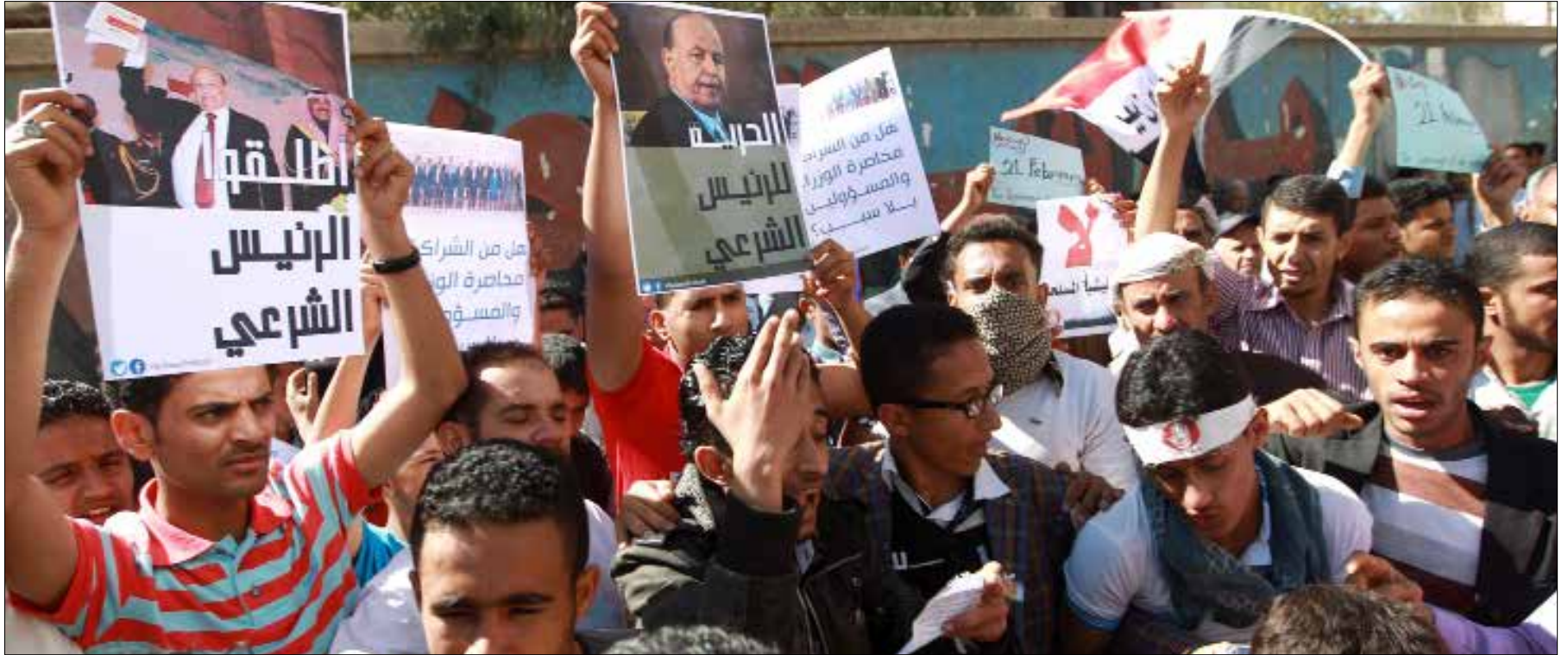
الدوحة ابدت إعلان هادي: عدن عاصمة مؤقتة

إعلان عدن عاصمة وصنعاء «محتلة»... وتعويم للمبادرة الخليجية