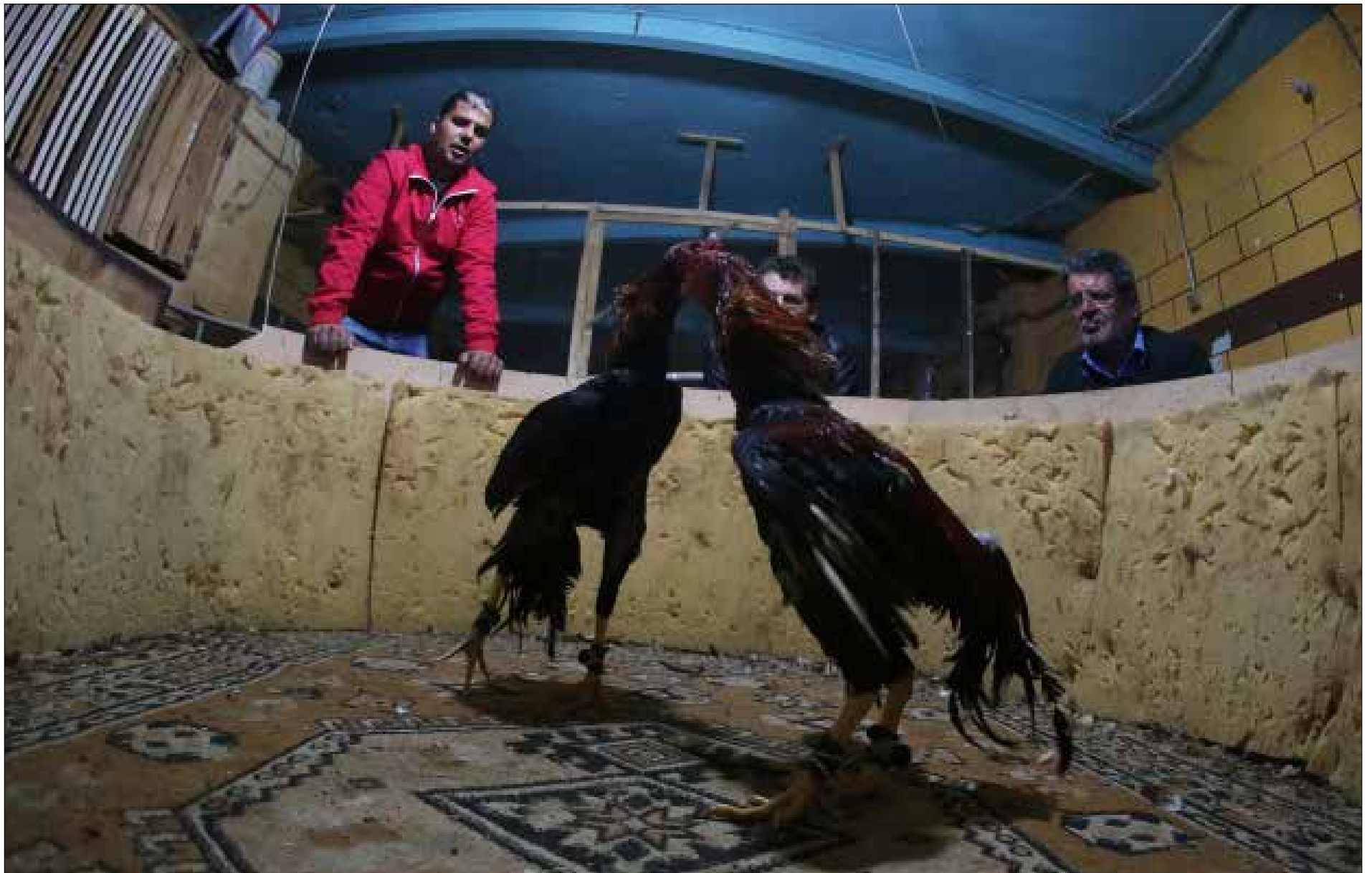
(عمدات الحاج علي)

هم يرونها رياضة، فهي تتطلب مجهوداً منهم، لكونهم المدربين الذين يعدون أبطال النزالات، وابطال هذه النزالات هنا ليسوا ملاكمين، بل ديوك تحزبت على مهاجمة منافسيها والقضاء عليها. مجتمع مصارعة الديوك موجود فعلاً في لبنان، حيث يجتمع هواته يومي