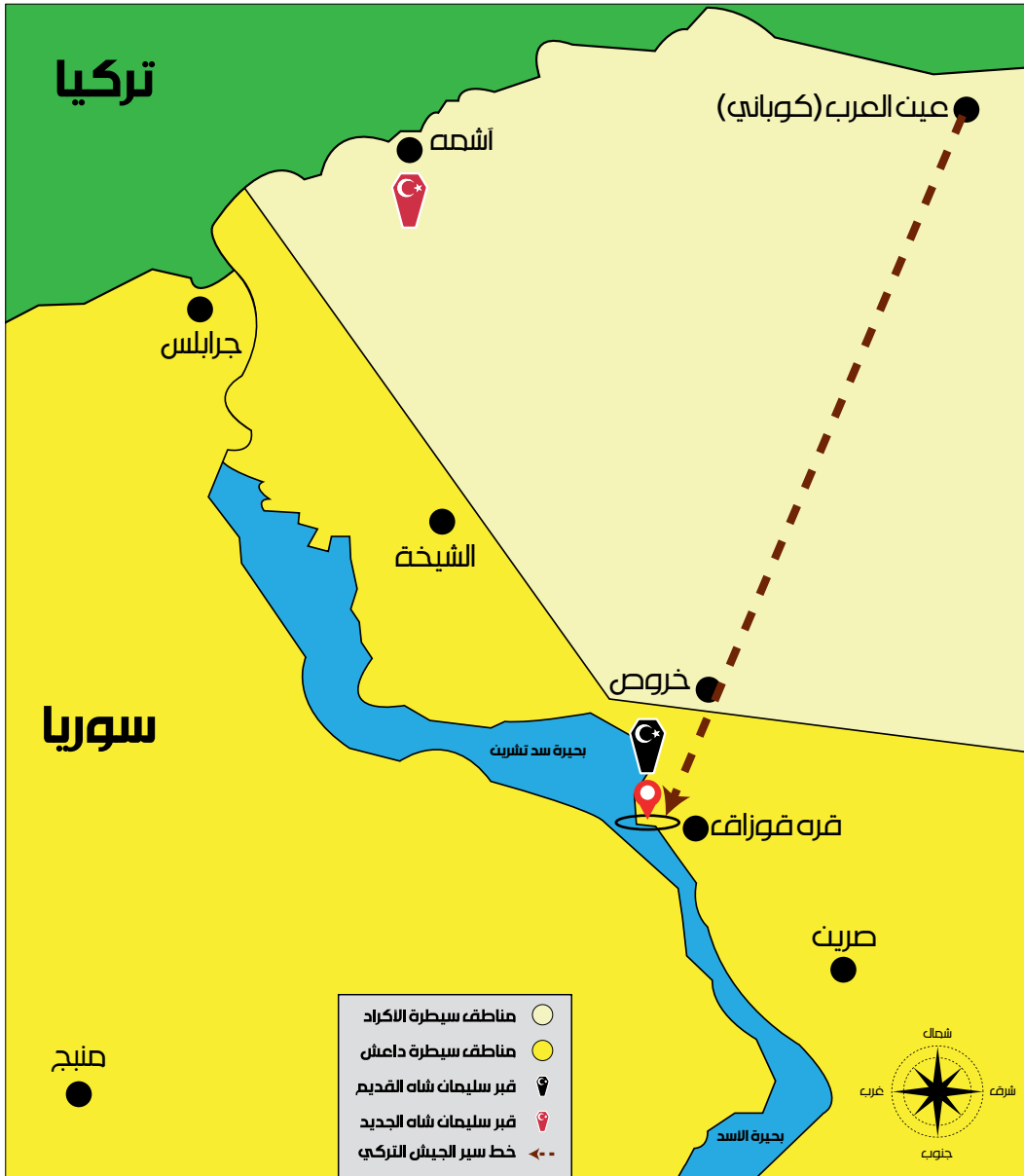
تصميم رشاش الشويخ