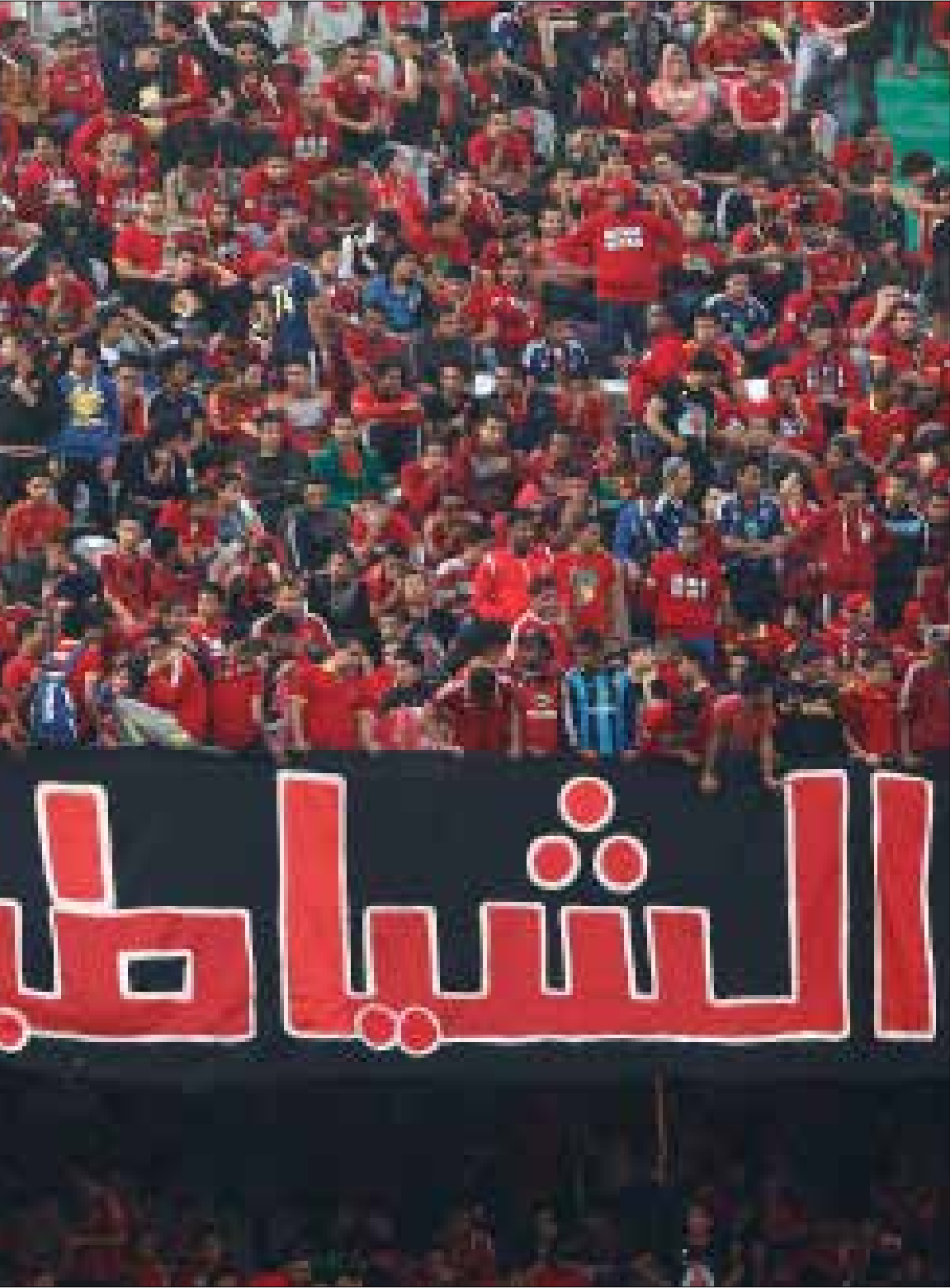
بدأ الالتراس في مصر من خلال مشجعي النادي الأهلي ثم لحقهم مشجعو زملائهم

خلال الأعوام الأربعة الأولى من عمر روابط الالتراس، كان الصدام بينها وبين «الداخلية» محدود رغم وجود احتقان من الطرفين