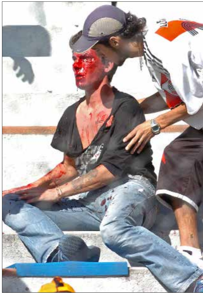
أحد ضحايا «باراس برافاس»، خلال مباراة لريفر بلايت هم ارسناك في الدوري الأرجنتيني

أين دور السياسة من كل هذا المشهد؟ يمكن تلخيصه بما قاله في إحدى المرات الكاتب الأرجنتيني فابيان كاثاس، المشجع لفريق سان لورنزو منذ طفولته: «إذا أردنا، يمكننا بدقيقتين أن نجعل كل هذا يختفي. لكن إن قضينا على الباراس برافاس، فإن أشخاصاً كثيرين في عالم السياسة سيسقطون، وهنا المازق الحقيقي». هذه هي كرة القدم في الأرجنتين إذاً. هناك، في تلك البلاد خلف المحيط، صورتان، إحداهما جميلة تتمثل في ديبغو مارادونا وليونيل ميسي وما تنجبه الملاعب من سحرة على شاكلتهما، وأخرى بشعة اسمها: باراس برافاس.