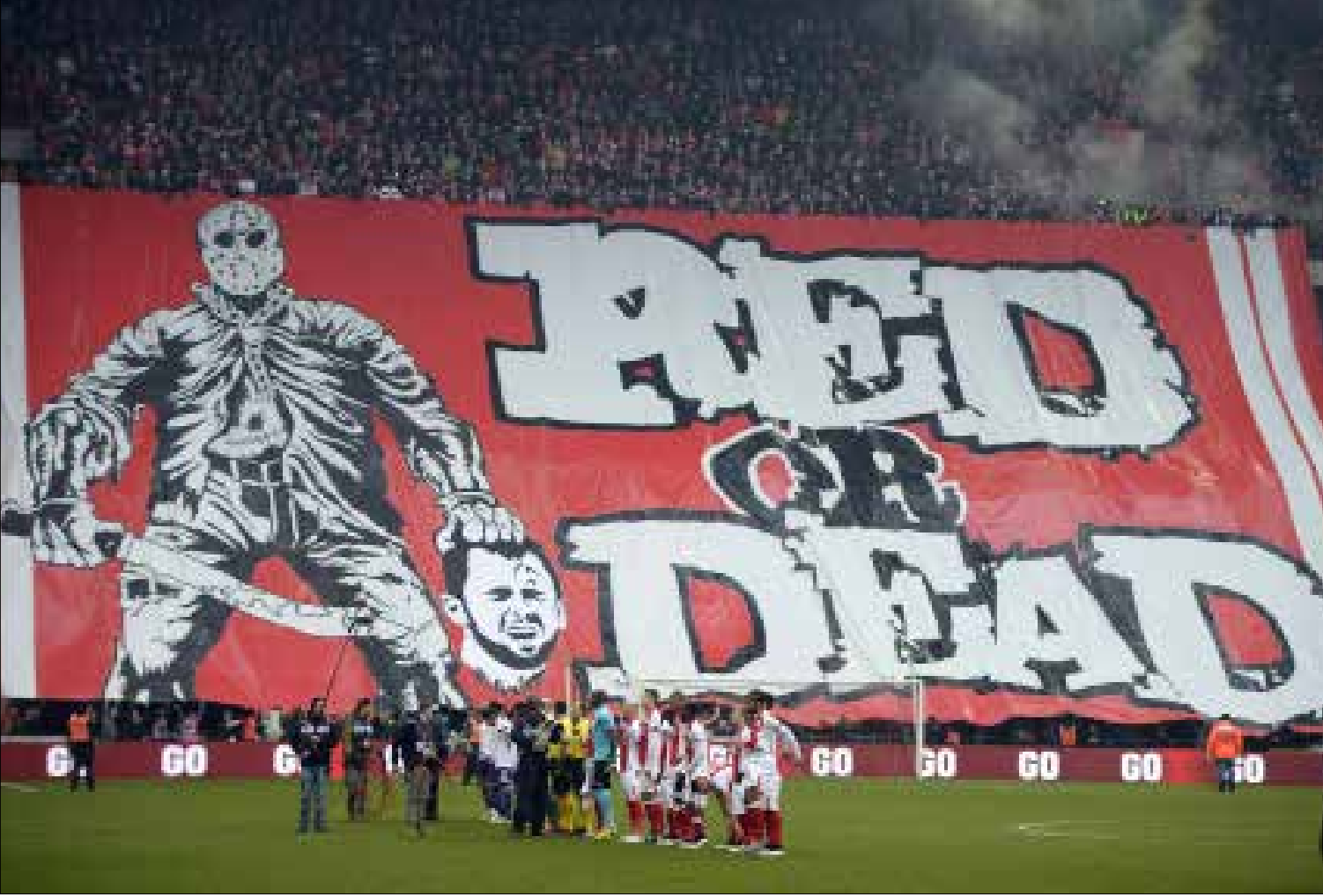
«الأحمر أو الموت» رسالة الأتراس ستاندار لياج لقائد الفريق السابق ستيفن دوفور

قبل عامين أشار تقرير لوكالة «أسوشيتد برس» إلى أن المجموعة الأكثر تنظيماً في مصر بعد الإخوان المسلمين هي جماعات الأتراس الخاصة بكرة القدم المحلية. وهذا المثل هو للدلالة على انجذاب الشباب فعلاً إلى الأتراس لكون الانتماء إليه يساهم برأيهم في ترجمة شخصيتهم ويعطيهم قوة يستمدونها من مجموعة تنسم بعصبية معينة. أضف أن ملعب كرة القدم يمثل مساحة واسعة لهم للتعبير بعيداً من أي قيود اجتماعية، فيشتمون ويحرقون ويضربون في سبيل هدفهم، فيحول الأتراس التناقض الرياضي إلى صراع بصيغة «نحن» و«هم».