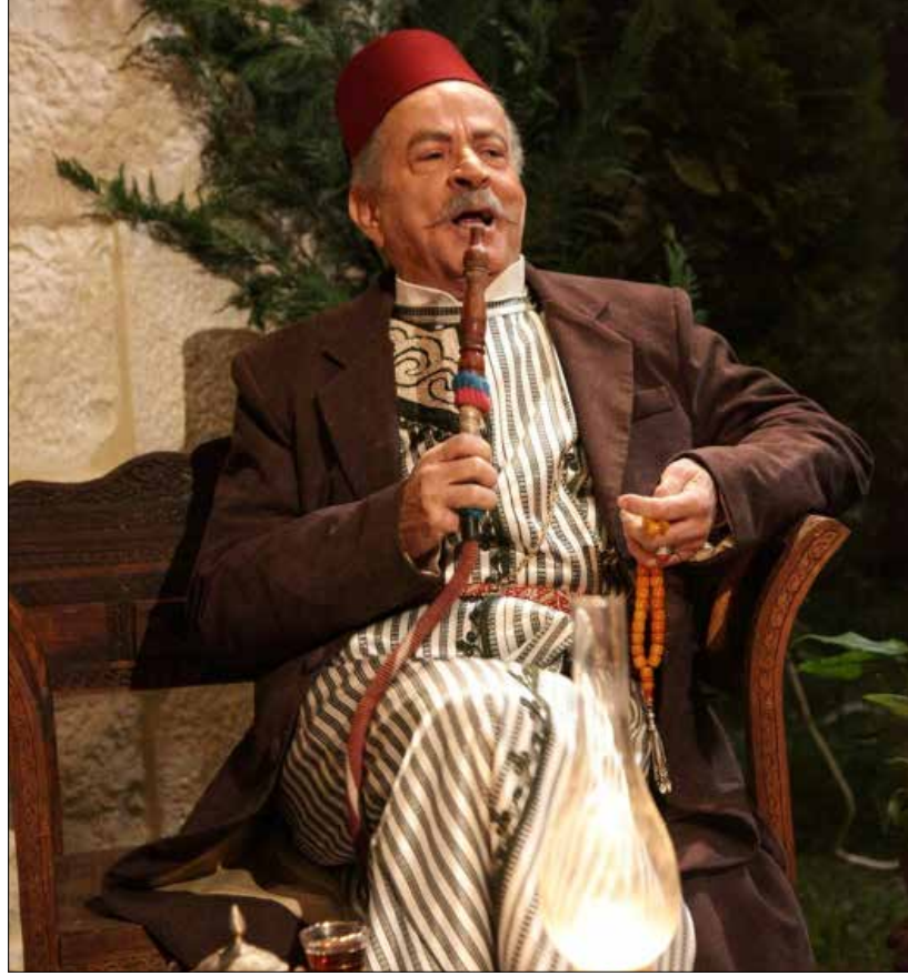
أحمد الزين في مشهد من «بنت الشهبندر»

لا يمكن للحديث مع النجم اللبناني المخضرم أحمد الزين (1944) أن يكون متكلفاً. سرعان ما يحجز «ابن البلد» مكانة ثابتة في قلوب الآخرين. التقينا في موقع تصوير مسلسله الجديد «بنت الشهبندر» (كتابة هوزان عكو، وإخراج سيف الدين السبيعي) فأخبرنا أنه اعتزل الأحاديث والإطلاقات الإعلامية منذ زمن طويل، لكنه مقابل ذلك لا ينكر الحق بضرورة الحديث الإعلامي عن كل عمله يشارك فيه. لذا اختار أن يحدثنا عن دوره في هذا المسلسل وجديده بشكل عام. لكن قبل كل ذلك، نغتنم الفرصة لنسأله عن برنامجه الإذاعي الذي انطلق أمس على «إذاعة النور» بعنوان «كلمة عالماشي» (كتابة أحمد ترمس، وإخراج جواد شري). البرنامج عبارة عن مونولوج يتقمص فيه الزين شخصية «أبو الحبايب» للحديث عن هموم المواطن ومشاكله اليومية. في حديثه معنا، يشرح فكرة البرنامج قائلاً: «لا شيء جديداً أقدمه في هذا البرنامج سوى خطوة إضافية نحو توطيد العلاقة الحميمة مع الناس الذين قررت الامتناع عن خيانتهم. هو مقترح إذاعي لتواصل وجداني وحقيقي يكرس علاقتي مع الناس». لكن هل يتخذ هذا البرنامج بعداً نقدياً أو هاجس المحاكمة الفنية لجوانب الحياة؟ ينفي نجم «الغالليون» ذلك، قائلاً: «على الإطلاق. صحيح أنه يتكلم عن هموم المواطن، لكنه يخوض في مواضيع بعيداً عن النقد وبطريقة شفاقة وهادئة جداً». في السياق ذاته، يذكر بأن أول