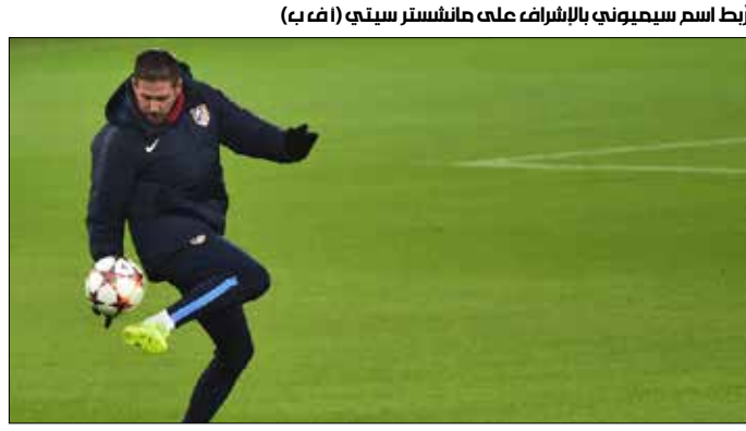
رُبط اسم سيميوني بالإشراف على مانشستر سيتي

2017، لكنه يتضمن بنداً يتيح فسحه مقابل مبلغ 25 مليون يورو. وإذا كان رويس يتعلم الإسبانية، فإن الأنباء الواردة من إسبانيا تفيد بأن الأرجنتيني ديوغو سيميوني، مدرب أتلتيكو مدريد، بطل «الليغا» ووصيف بطل أوروبا في الموسم الماضي، يخضع لدروس منذ فترة في اللغة الإنكليزية، بحسب ما كشفت صحيفة «إل كونفيدينسيال».