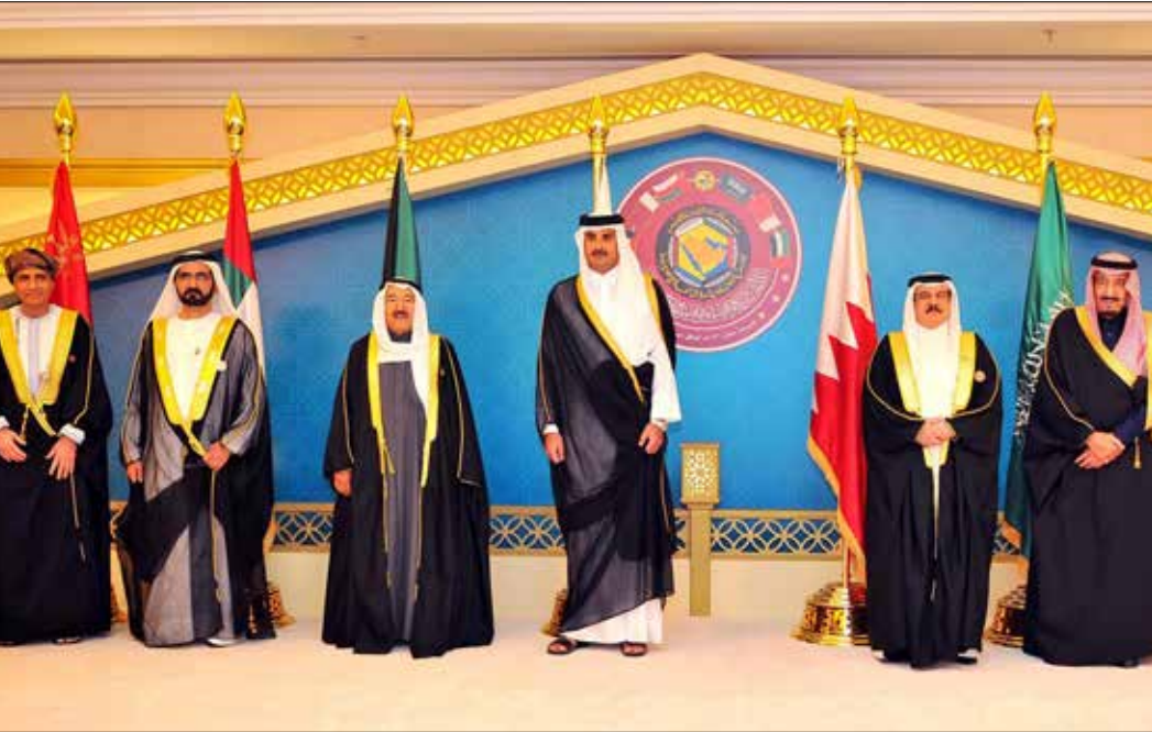
لم تقر القمة بشكل نهائي إنشاء القيادة العسكرية الموحدة لدول المجلس (أف ب)

بالنسبة إلى اليمن، فقد أكد البيان الخليجي ضرورة استكمال تنفيذ المبادرة الخليجية، التي تجاوزها الزمن، معلناً دعمه للرئيس عبد ربه منصور هادي وشاناً هجوماً على الحوثيين الذين طالبهم بالانسحاب من المناطق التي «احتلوها»، مطلقاً عليهم هذا التوصيف الذي يحمل سمات قبلية ومذهبية وليس عنوانهم السياسي «جماعة أنصار الله». كذلك، أكد البيان الختامي وقوف دول المجلس إلى جانب البحرين في كل خطواتها في محاربتها للأعمال الإرهابية.