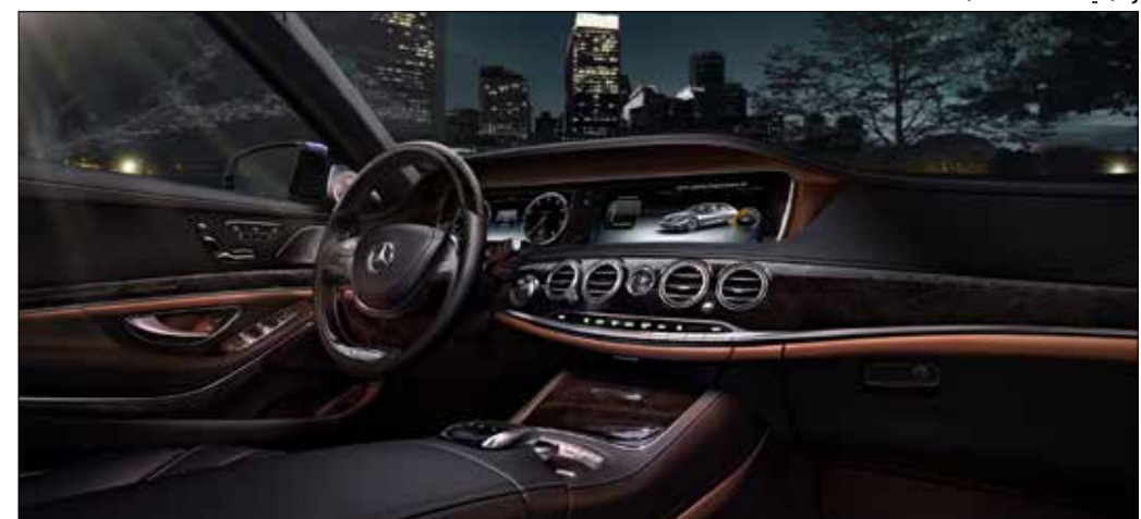
سيارة ديناميكية وعصرية بتصميم داخلي وخارجي مبتكر

هي سيارة ديناميكية وعصرية بتصميم داخلي وخارجي مبتكر، إذ يتضمن التصميم الداخلي خصائص عصرية مثل وحدة العرض المبتكرة المميزة بشاشتي عرض TFT مقاس (12,3) بوصة.