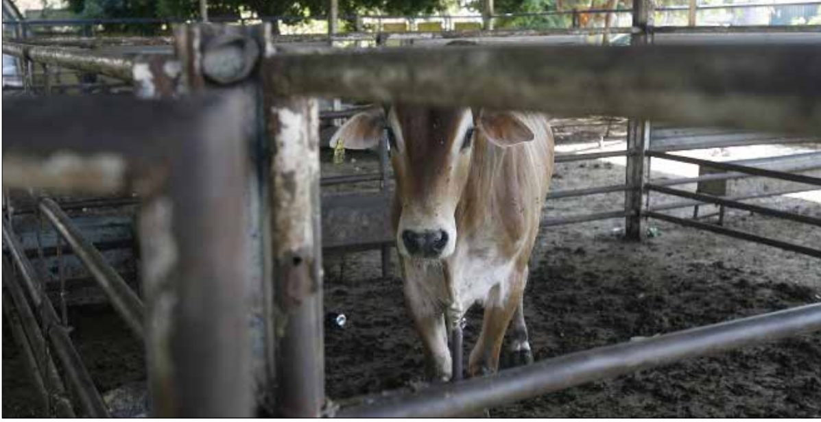
البلدية رفضت طلب النابلسي بإنشاء مزرعة أبقار في العقار نفسه (مروان طحطح)

شكاوى المواطنين ضدها، جرى الإيعاز إلى القوى الأمنية بإقفالها، فكانت المزرعة البديلة. الروائح الكريهة القوية الصادرة من المزرعة طرحت تساؤلات عن نوعية الأعلاف التي تقدم للأبقار، التي يلاحظ أبناء البيسارية أنها تكون نحيفة عندما تدخل بالشاحنات المشوطة إلى المزرعة مروراً بالطريق العام للبلدة، وتكون بدينة جداً بعد أن تخرج من المزرعة إلى المسالخ والملاحم بعد أقل من أسبوعين. فماذا نطعم ليزداد وزنها بهذه السرعة وتخرج برازاً كريه الرائحة لهذه الدرجة؟