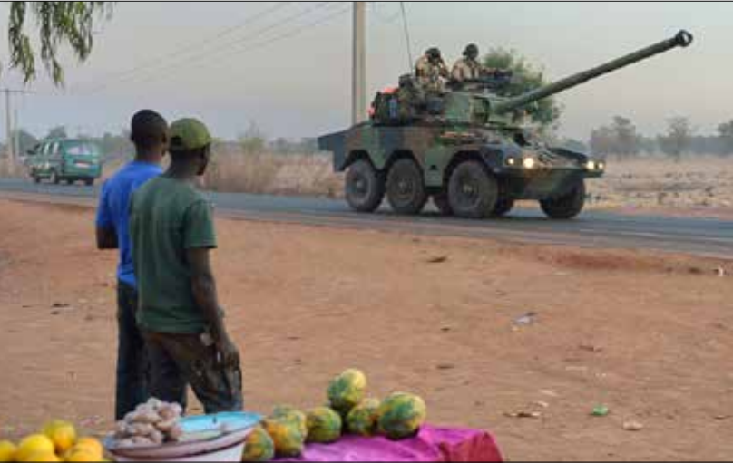
الوقائع تظهر ان اساسي الصراع هما استعمار الغرب وسيطرته على دول العالم الثالث (ارشييف)

فقط لأنها كما يقولون «غريبة». قد تمثل هذه الأفكار حلولاً لأوضاعنا الاجتماعية-السياسية، إلا أنه يتم منعها من التداول، أي منع حوار الحضارات ومنع تبادل الأفكار، من ينقل المجتمع إلى «تكفير» حرية الفكر، ورفض استعمال المنطق والعقل لقبول أو دحض تلك المفاهيم، فيلغى هؤلاء المثقفون مع التيار السلفي التكفيرية في منعنا من التطور.