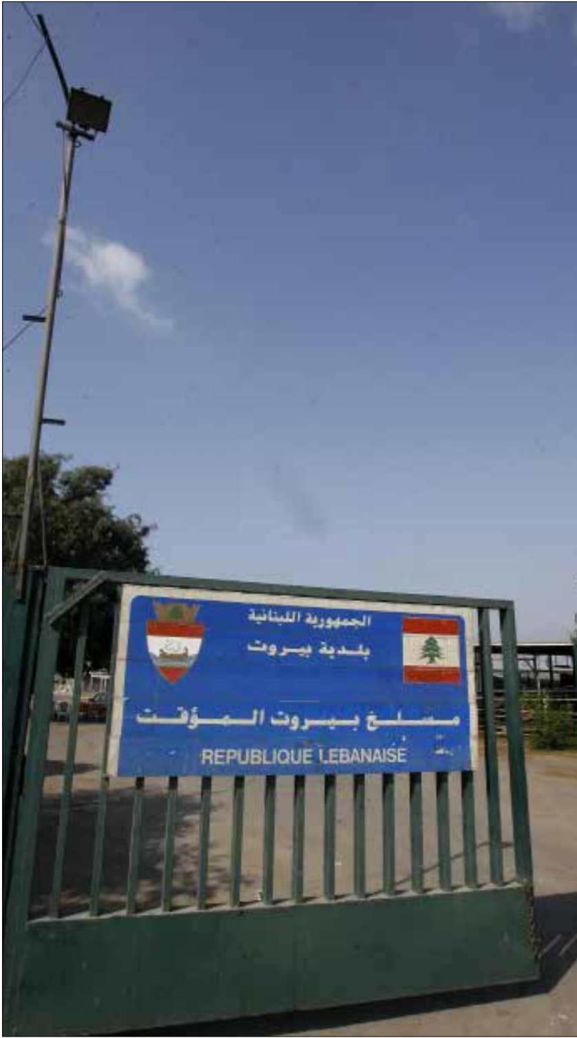
عدم وجود نظام للإدارة سمح للقصابين بتجاهل الإنذارات الموجهة اليهم (مروان طحطح)

حتى اليوم، لم يحل ملف مسلخ بيروت إلى القضاء، بالرغم من تأكيد مصادر وزارة الصحة العزم على الاستمرار في الملاحقات القضائية، فهل سيلاحق القضاء الرؤوس الكبيرة؟ أم ستجري تسوية الملف على حساب موظف يستطيع أن يرد عبارة «اللهم اني بلغت»؟