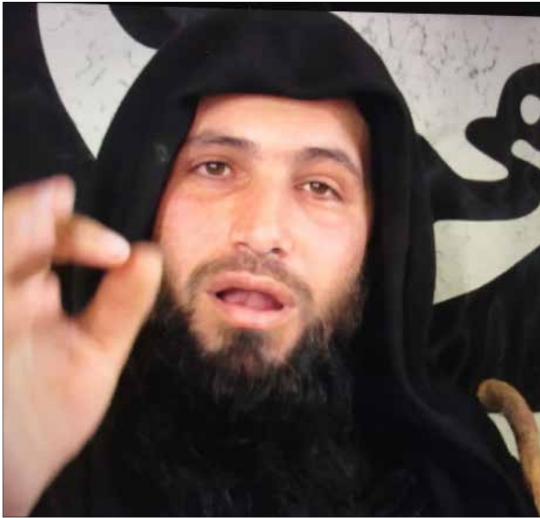
لن تغفوا علينا حتى يقتل كل كافر في سوريا