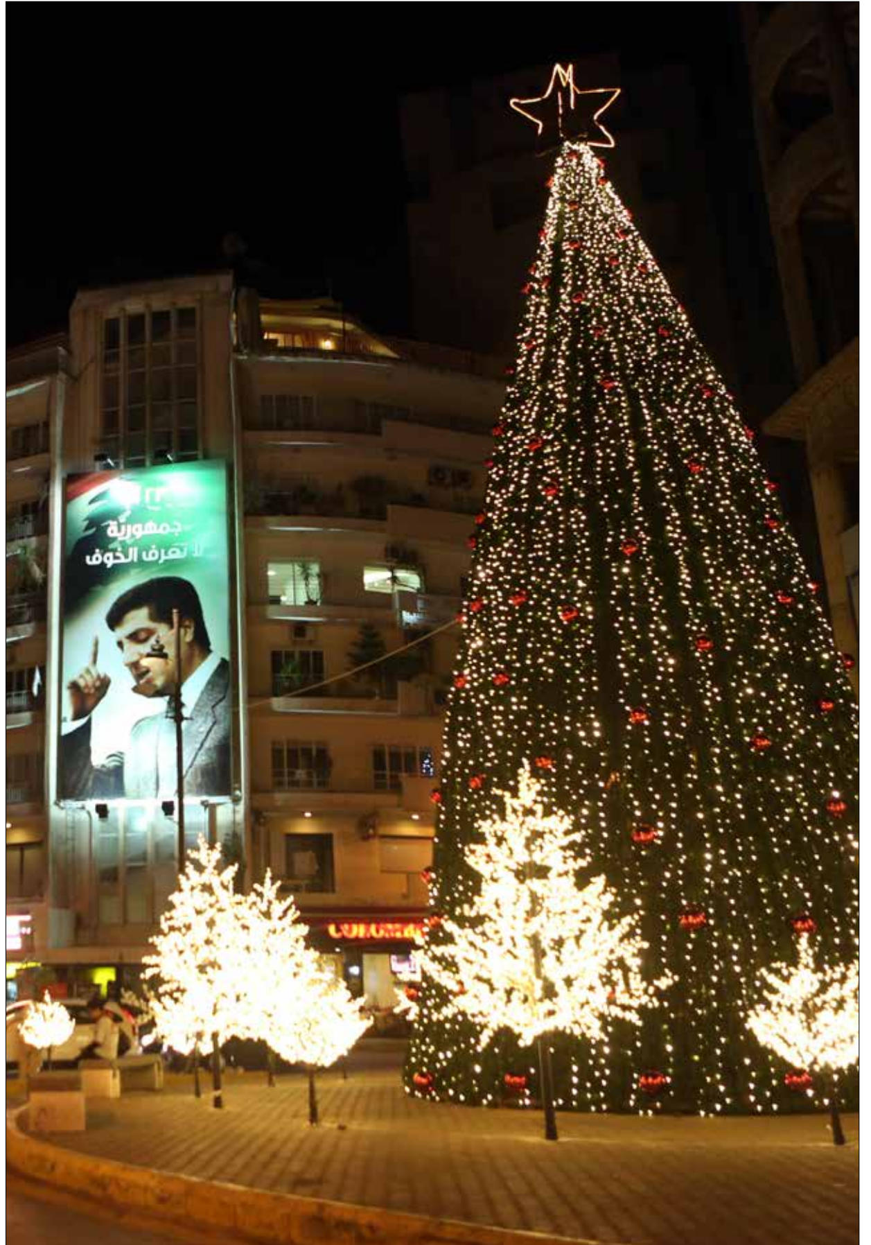
الزينة في ساحة ساسين

الحركة التجارية تآثرت سلباً بالأزمة الاقتصادية ولعلها أكثر المتضررين، خصوصاً على صعيد القدرة الشرائية. إذ باتت تحسب جيداً مصاريفها وتستغني عن كل ما تعتبره غير ضروري. وهذا ينعكس سلباً على الحركة التجارية. لعل أبرز المشاكل التي يعاني منها القطاع التجاري حالياً هو عدم الاستقرار الأمني والسياسي الذي يحول دون مجيء السياح والمغتربين إلى البلد، إضافة إلى التخوف من انفجار الأوضاع في منطقتي البقاع والشمال... لكن الأمل يبقى صفة ملازمة للقطاع الخاص اللبناني، ويقول عيد: "نأمل ان يستقر الوضع وتعود الحركة إلى ما كانت عليه، فلطالما مّر لبنان بأزمات اقتصادية غير انه يعرف كيف يخطأها".