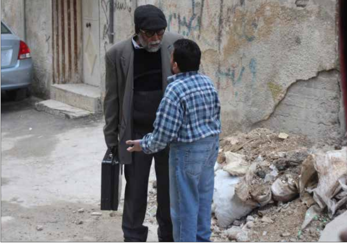
الممثل السوري في مشهد من مسلسل «بقعة ضوء»