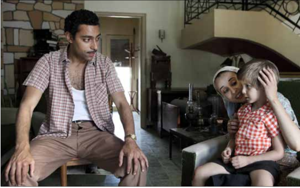
مشهد من شريط «الوهراني»

الصحافيين وتعذيبه بتهمة البحث عن الحقيقة، والنخب في ماضي ابن جعفر بالتبني. وسط ذهول المشاهدين، تتصاعد موسيقى الفنان المعروف أمازيغ كاتب. علماً أن الشريط أخذنا مع تواتر الأحداث إلى موسيقى متنوعة عكست ثراء المخزون الموسيقي الجزائري. الفيلم جاء جريئاً بكل ما حمله من تفاصيل عكست حقيقة ما تمر به الجزائر اليوم من نتائج وخيمة أفرزتها حقبة «الحزب الواحد». يذهب المخرج بذكاء إلى تساؤلات كثيرة في سيرة متصاعدة وصولاً إلى المشهد ما قبل الأخير حين يطلب حميد من رفيقه جعفر قليلاً من الماء. حين لم يجد قطرة ماء في الحنفية، يرد بسخرية: هل جاهدنا حتى لا نجد ماء نشربه بعد الاستقلال؟