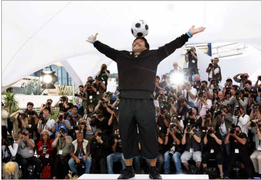
محاولات التنقيص من جماهيرية كرة القدم دائماً تبوء بالفشل