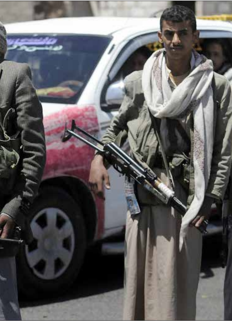
تمكن الحوثيون من السيطرة على قلب العاصمة والاستيلاء على مقرات الحكومة (أ ف ب)

«أنصار الله» تسقط مؤسسات الحكم في اليمن الواحدة تلو الأخرى! أيًا يكن من أمر، فإن التطورات الميدانية يوم أمس ترافقت مع توصل الحكومة اليمنية إلى اتفاق مع جماعة «أنصار الله» برعاية المبعوث الأممي لدى اليمن جمال بنعمر. وينص اتفاق «السلم والشراكة الوطنية» الذي وقع الحوثيون عليه، ليل أمس، على تشكيل حكومة «كفاءات» في غضون شهر، وخفض أسعار الوقود نحو نصف الزيادة السعرية التي طبقت على أسعار الوقود اعتباراً من نهاية تموز الفائت، وتعيين مستشارين لرئيس من الحوثيين ومن «الحراك