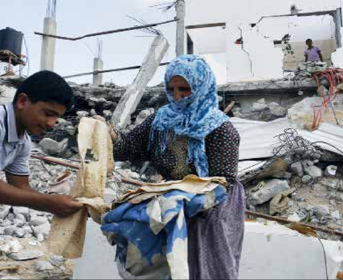
لا يعول الفلسطينيون كثيراً على نتائج الجولة الجديدة من المفاوضات غير المباشرة

تلك أيبب تركز على الدمار الواسع والمقاومة على الصمود والأداء الميداني