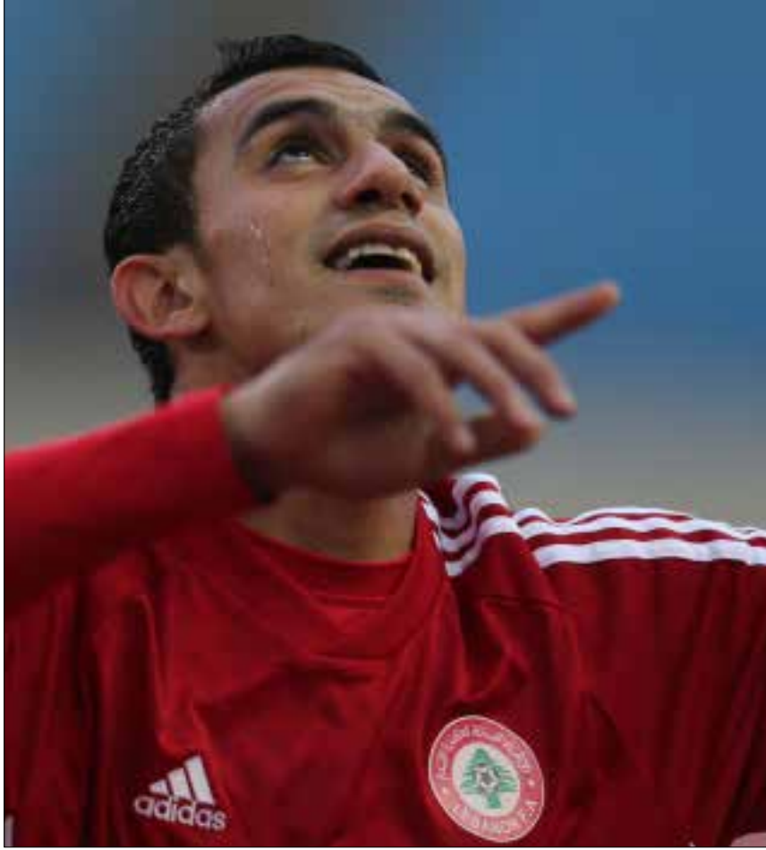
لا يمنح نظام الهواية اللاعبين من الاحتراف في الخارج من دون رضاهم (ارشييف)