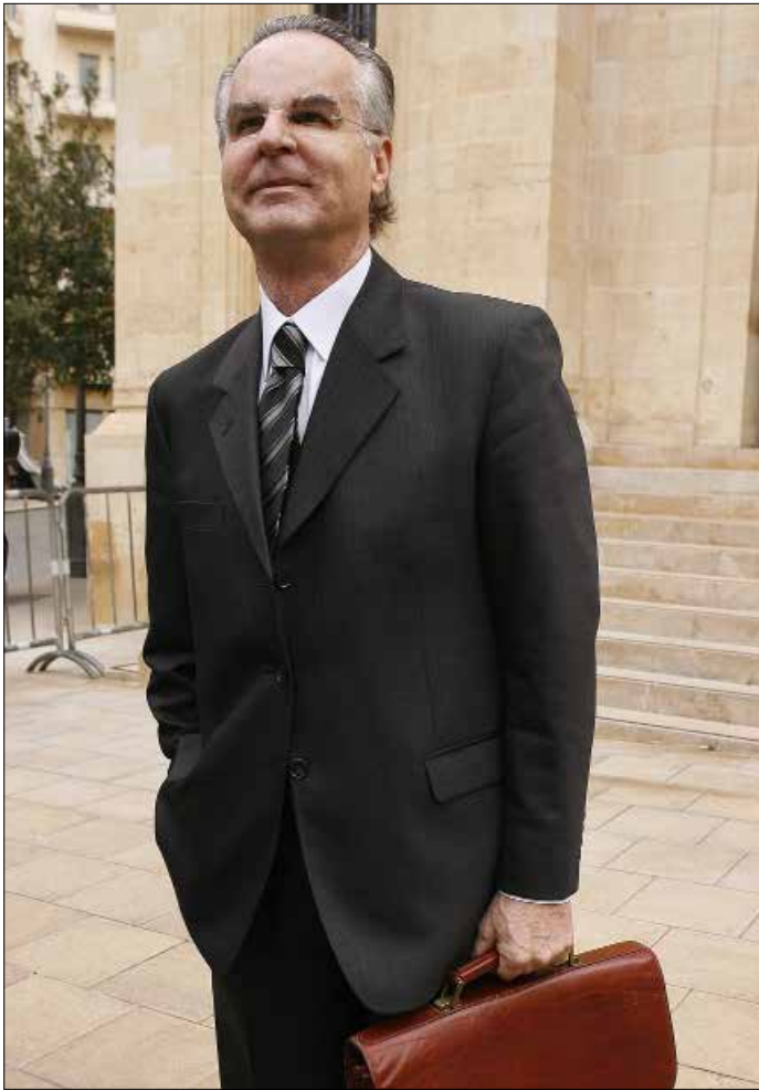
عدوان أكثر الناشطين مع الرئيس بزي على مسار التحركات (هيثم الموسوي)

من جهتها، أشارت مصادر التيار الوطني الحر إلى أن «الرئيس السنيورة لم يعرض على تكتل التغيير والإصلاح قانون الموازنة، بل أبقى النقاش علنه بينه وبين الرئيس بزي». أما في ما يتعلق بسلسلة الرتب والرواتب «فما زالت المشكلة القديمة هي ذاتها على نقطتين رئيسيتين: رفع الضريبة على القيمة المضافة ورفع درجات الأساتذة». ولفقت المصادر إلى أن أي «جلسة تشريعية تتناول على جدول أعمالها القوانين المعجلة المكررة ستضم قانون التمديد، لأنه قانون معجل مكرر أيضاً». ويرجح أن «تكون أول جلسة تشريعية في الثلاثين من الشهر الجاري، نظراً إلى ضرورة بث مسألة اليوروبوند قبل نهاية الشهر، ويكون الرئيس تمام سلام قد عاد من السفر».