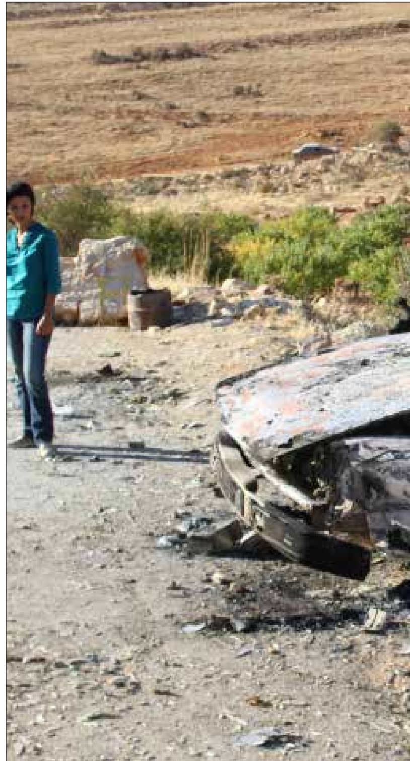
موقع الانفجار في الخريبة

الصورة التركية - الإخوانية، المشبعة بالألوان الليبرالية، أصاعت بوصلة الحركات الشعبية، حتى بالنسبة للموقف من العدو الإسرائيلي. أولوية الصراع ضد الاستبداد طغت على وعي عام مشوّه بمزيج