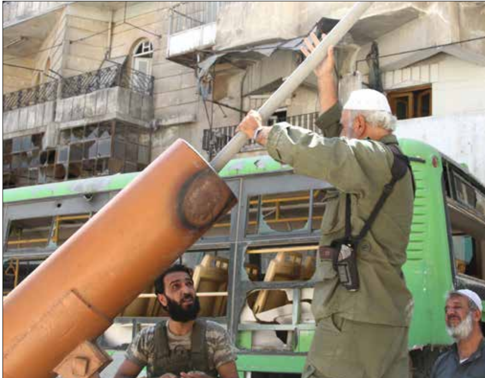
ليس داعش وظاهرة العنف السلفي المتفشي في بلداننا سوى ردة فعل رجعية في البلدان العربية

الأول- لا تتمتع هذه الفترة بقداسة خاصة لدى المؤمنين والمتدينين. والثاني- تحتوي هذه الأساطير على معظم الأسس التي تستند إليها الأديان. مثل ورود قصة الخليفة في الميتولوجيا البابلية والأديان اليهمسلامية، وورود المرأة الحية كرمز للخليفة في الميتولوجيا البابلية واليهودية والمسيحية. هذه القصص والمبادئ من شأنها أن تدفع الطلبة إلى التفكير وعدم التوقع أو محاكاة رواية دينية على أخرى ليصبح الموضوع الإيماني معرفياً أيضاً. والثالث- يمنح تدريس القصص والأفكار السابقة للأديان اليهمسلامية شرعية نقاش القصص