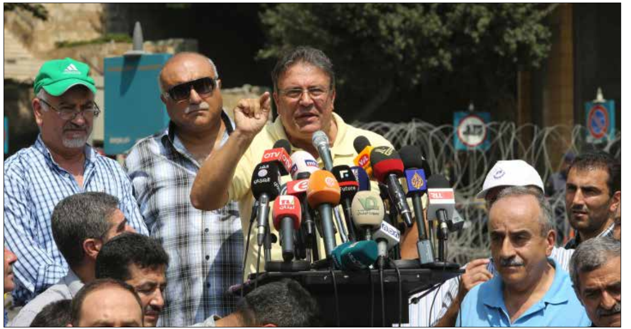
الاتجاه لخفض 10% من سلسلة TVA مع زيادة الـ

قال وزير المال علي حسن خليل، في تصريح له أمس «إن العُقد التي عرقلت إنجاز سلسلة الرتب والرواتب (ربما) تكون في طريقها إلى الحلحلة». هذا التصريح يعكس تحوُّلاً في «الاجواء»، بدأ منذ أيام عدّة، في ظل السباق بين إجراء الانتخابات النيابية أو تمديد ولاية المجلس النيابي مرّة أخرى