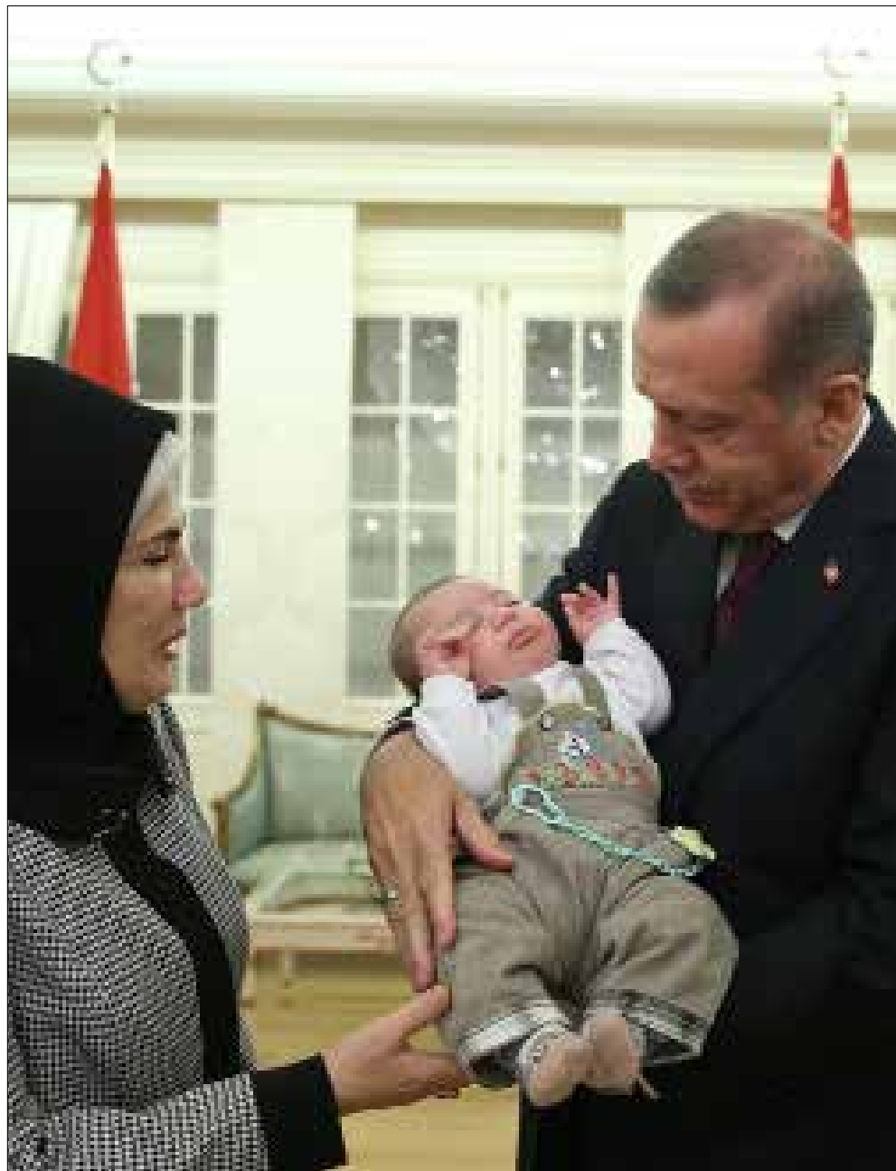
أكثر أردوغان من التناؤ على دور الدبلوماسية في العملية الأخيرة

طلب «داعش» من أنقرة عدم المشاركة في «التحالف الدولي»