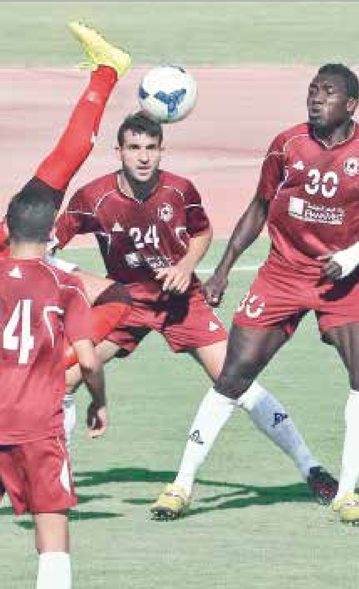
في لبنان يرتبط اللاعبون بانديتهم إلى الأبد (عدنان الحاج علي)

إذاً الواقع اللبناني ضائع بين الهواية والاحتراف على اعتبار أن لاعبي فرق الرجال تحديداً يتقاضون رواتب، لا بل يرتبط بعضهم بالأندية وفق عقود مسجلة في الاتحاد. هذا الاتحاد ذهب في مناسبات عدة إلى تعديل بعض المواد الخاصة بنظام تواقيع اللاعبين، لكن مثله مثل اللاعبين، فهو مقيد أيضاً بقرار الأندية (أي تغيير للنظام يحتاج إلى موافقة الجمعية العمومية)، إذ لم يكن بمقدوره إحداث أي تغيير جذري، بحيث اقتصر التعديلات على مواد غير مؤثرة في الشكل العام للعبة (التعديلات على النظام القديم نسبتها 10 إلى 15%)، على غرار المادة 1-2-8 الخاصة بنظام مطابقة الانتقال (TMS)، بحيث أصبح تنظيم شهادة الانتقال الدولية إلكترونياً. كذلك، ذهب الاتحاد قبل عامين إلى محاولة جزر اللاعبين والأندية