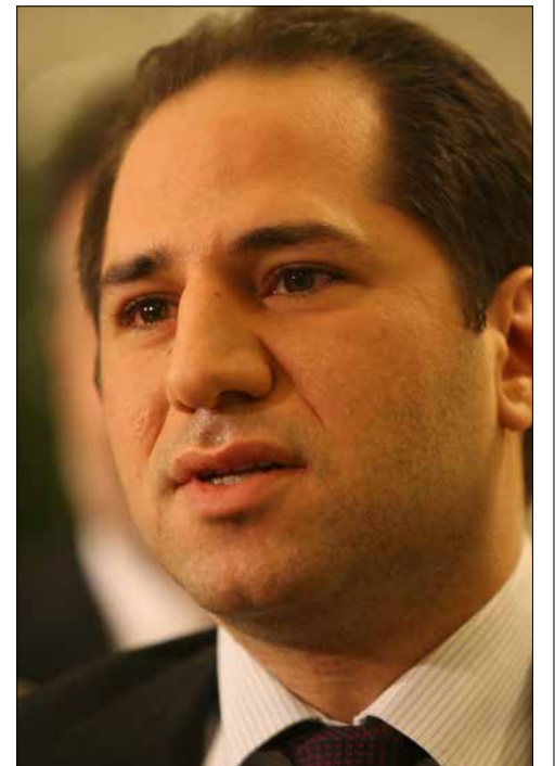
«انزعاج» في 14 آذار من جولة الجميل العكارية

وبعدما أعلن سابقاً أنه لن يصرّح ما دام لا جديد في السياسة، اختار فتى الكتائب «الخطر على المسيحيين» وتطورات المنطقة بوابة للعودة إلى الساحة. يقول مقربون منه إن