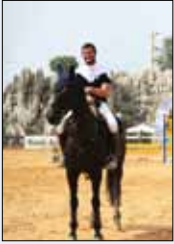
الفئة E للفارسان فوق 14 عاماً.