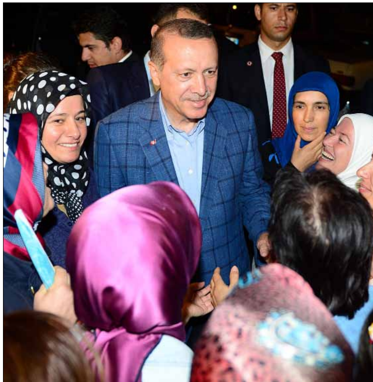
نجح أردوغان في حصد أصوات كل ولايات الأناضول وساحل البحر الأسود (الأناضول)

التصريح اللافت الثاني جاء من المتحدث الرسمي باسم الحكومة التركية حسين تشيليك الذي أعلن أول من أمس موعد اجتماع الأمانة العامة للحزب الحاكم المقرر عقده في 28 آب يوم واحد. وإذا ما أخذنا في الاعتبار أن النقطة الأبرز في هذا الاجتماع هو انتخاب بديل أردوغان لرئاسة الحزب، وبالتالي المرشح المحتمل لرئاسة الحكومة، فإن تقديم هذا اليوم يحول عائقاً أمام ترشح الرئيس الحالي للبلاد عبد الله غول لهذا المنصب، حيث تنتهي ولايته الرئاسية يوم 28 آب. ما يعني أنه محبر، في حال رغبته في المشاركة في الاجتماع، على الاستقالة من منصبه قبل 24 ساعة على الأقل، لأن الدستور التركي يحتم على رئيس الجمهورية عدم الانتماء إلى أي حزب سياسي. خطوة تفسر بأنها تهدف إلى إقصاء غول، وبالتالي دفع وزير الخارجية الحالي، ومخطط السياسة التركية أحمد داوود أوغلو لشغل المنصبين.