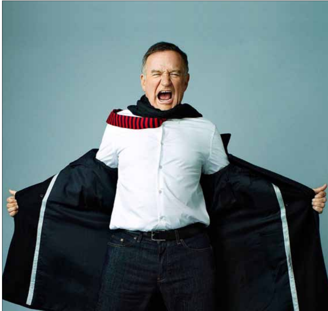
وقف أمام آل باتشينو في Insomnia لكريستوفر نولان عام 2002

لكن من قال إن قدرات روبين وليامز محصورة في الكوميديا فقط؟ في The Garp World According عام 1982 لجورج روي هيل، أظهر جانباً درامياً مختلفاً في مروحة مواهبه. شخصيات لا تُنسى خلفها على الشاشة لاحقاً. عازف الساكسفون السوفياتي «إيفانوف» الذي يهاجر إلى نيويورك ليصطدم بالفروق الثقافية وأمراض المجتمع الأميركي في Moscow on the Hudson عام 1984 لنول مازورسكي. أحد أبرز أدائه كان في شريط باري ليفنسون، Good Morning Vietnam في 1987. مذياع ومعد في راديو الجيش الأميركي، يعايش حرب فيتنام