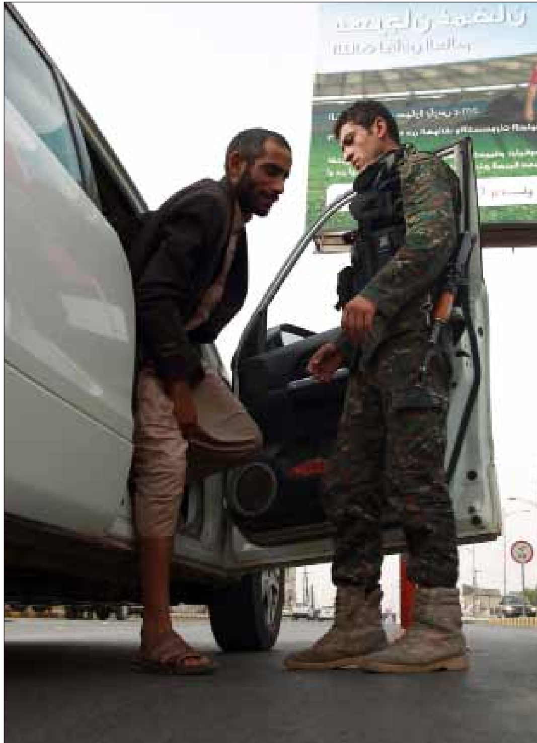
تبنت «القاعدة» عدداً من حوادث الاغتيال التي طاولت جنوداً وضباطاً في صنعاء

ومن خلال خارطة الأحداث الأخيرة، يتمركز التنظيم بقوة في محافظة حضرموت الجنوبية، وينسبة أقل في محافظة شبوة وأبين، فيما قل حضوره في الشمال، باستثناء محافظة البيضاء التي تشهد هي الأخرى هجمات متفرقة على مقار عسكرية، وحوادث اغتيال المسؤولين أمنيين وعسكريين، تحمل بصمات التنظيم. في وقت غابت فيه الضربات عن العاصمة صنعاء بعدما كانت مسرحاً مفتوحاً لعمليات «القاعدة»، الذي نفذ عدداً من الهجمات العنيفة عليها، أبرزها استهداف مجمع «العرضي»، مقر وزارة الدفاع. ذلك الهجوم أدى إلى مقتل أكثر من 50 من الجنود والمدنيين وأطباء المستشفى الموجود في المجمع، يليه الهجوم الانتحاري الذي استهدف السجن المركزي في صنعاء في شباط الفائت وأدى إلى مقتل 7 من رجال الأمن