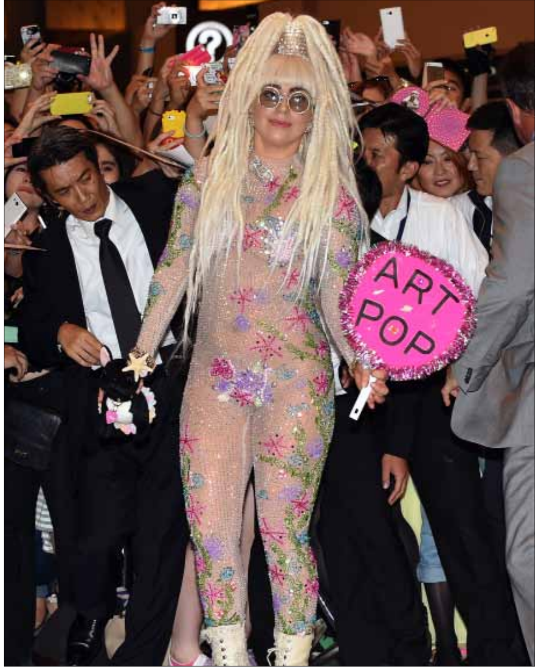
وصلت النجمة الأميركية ليدي غاغا، أمس، إلى مطار ناريتا الدولي، إذ ستحيي حفلتين اليوم وغداً في «ملعب شيبا البحري» في المدينة اليابانية، قبل أن تنتقل في 16 آب (أغسطس) إلى كوريا الجنوبية للقاء جمهورها في الملعب الأولمبي في سيول.

ZIAD RAHBANI AND HIS BAND FEATURING SHIRINE ABDO & HAZEM SHAHINE