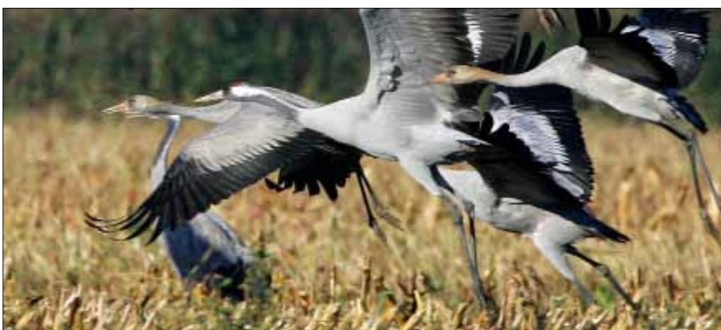
يهاجر عبر لبنان 37 نوعاً من الطيور الحوامة بينها 5 أنواع مهددة بالانقراض

وزارة البيئة لارا سماحة نطاق الالتزامات التي نص عليها قانون الصيد البري. واعلنت ان وزارة البيئة انجزت المراسيم التطبيقية والقرارات التنظيمية للقانون وأخرها مرسوم بوليصة التأمين ضد الغير. واكدت سماحة ان الوزارة بصدد