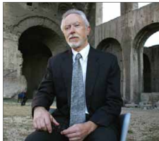
جون ماكسويل كويتزي: مراسلات شقيقة مع أوستر عن الأدب وشؤون الحياة

حين يسأل بول أوستر عن اهتمامه بالأدب، يقول إنه بدأ بعد سنة من إدراكه أنه لن يصبح لاعب بيسبول محترفاً. ولو لم يكتب إلا «ثلاثية نيويورك» (1987) التي تضم روايات «مدينة الزجاج» و«الأشباح» و«الغرفة الموصدة» لكان ذلك كافياً ليخلد اسمه في عالم الأدب. لكن «اللهجة» الخاصة التي ميّزته في بداياته، أفصحت