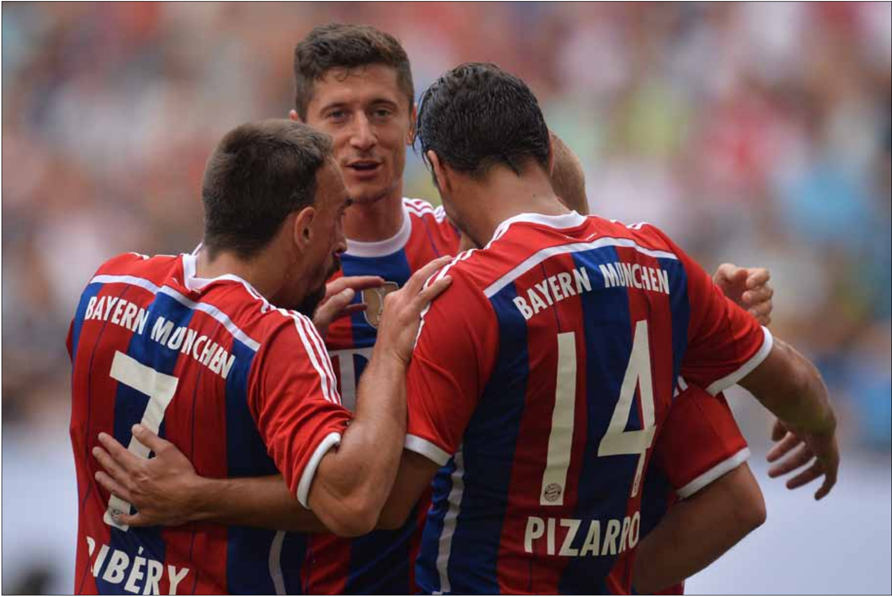
ليفاندوفسكي آخر «سرفات» بايرن سيواجه فريقه السابق الليلة