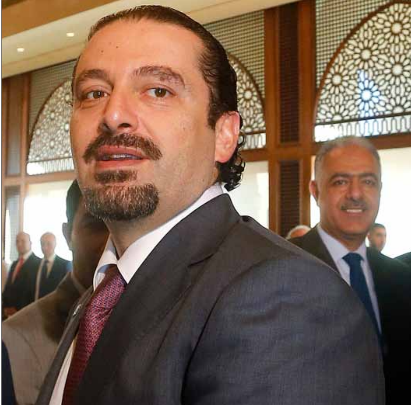
هل ينجح الحريري في عزل المجموعات التكفيرية؟

الألغام. تستقبل قوى 8 آذار الحريري اليوم بالسعادة نفسها التي ودعت بها قبل ثلاث سنوات يومها، اختصر مشروع قوى 8 آذار بتحويل النائب الطرابلسي نجيب ميقاتي إلى رفيق الحريري الثاني، إلا أن ميقاتي أثر البقاء نائباً طرابلسياً على التحول إلى رئيس حكومة، فيما تجاهل سعد الحريري صعود التكفيريين على أكتاف المستقبلين إلى بعض مآذن عبرا وطرابلس وعرسال ريثما يستنجد به خصومه لإنزالهم المهمة الحزبية، أو إعادة إمسك الحريري بزمام المبادرة في مناطق نفوذه المفترضة، لا تبدو لمن يتجول في بعض المناطق المستقبلية شمالاً بالسهولة التي تتخيلها قوى 8 آذار. ففي طرابلس، مثلاً، تنتظر الحريري ستة تحديات يفترض به تجاوزها قبل القول إن الأمر في عاصمة الشمال له: