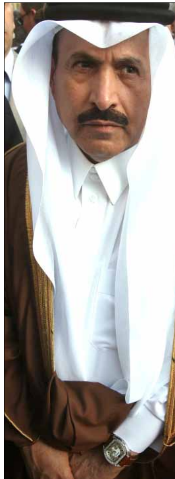
عودة الحريري تزامنت مع مغادرة العسيري

كانت إشارات الشارع السني بعد عرسال تنذر بالخطر على زعامة المستقبل