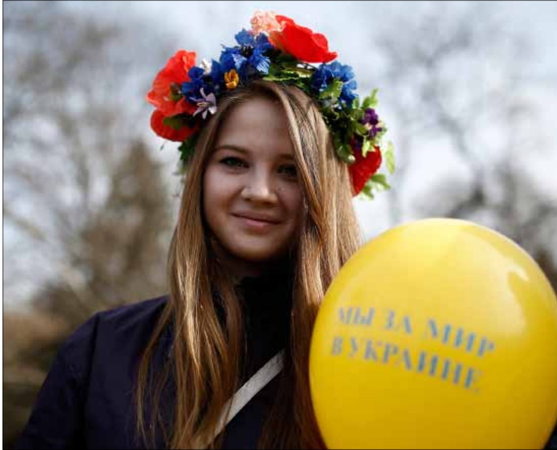
موسكو تنتظر رد فعل أوكرانيا والغرب على تهديدات باروش

من جهة أخرى، قالت وزارة الخارجية الروسية إن موسكو تنتظر رد فعل واضحاً من البرلمان الأوكراني والدول الغربية، على التهديدات الموجهة إلى روسيا من قبل زعيم حركة «القطاع الأيمن» المتطرف الأوكراني ديمتري باروش، الذي تم إدراجه على قائمة المطلوبين دولياً من قبل روسيا، والذي يؤثر برأي الوزارة الروسية على السياسة الداخلية والخارجية لأوكرانيا. (الأخبار، أ ف ب، الأناضول)