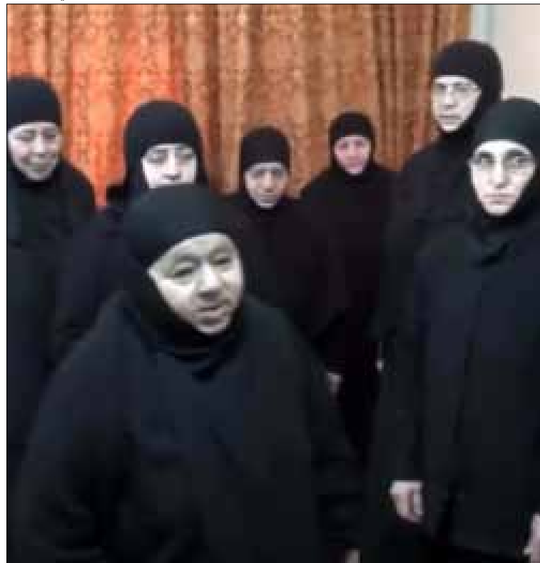
الرهبايات في مكان احتجازهن في صورة تعود الى 10 شباط الماضي