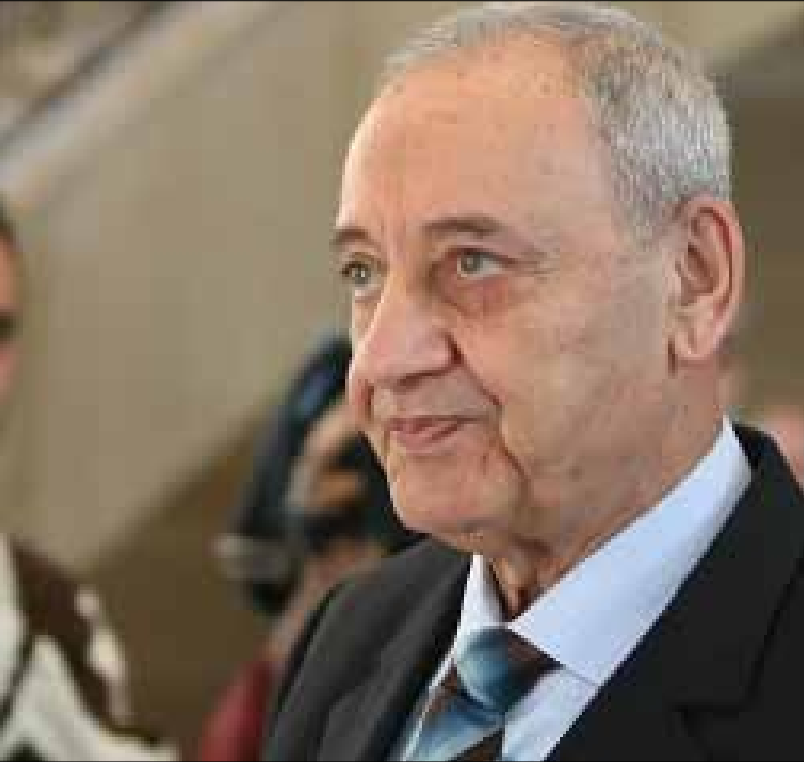
بري وجنبلاط توافقا على صيغة لن يكشف عنها قبل تحقيق اجماع عليها (أرشيف)

قدم وزير الخارجية إلى الجامعة العربية صيغة حول بند المقاومة، تبنتها الجامعة، بعد تعديل الصيغة الأولى. ولم يبرز في بيروت أي تعليق على الصيغة، بالتوازي مع الكشف عن صيغة جديدة لرئيس المجلس النيابي ورئيس جبهة النضال الوطني حول المقاومة