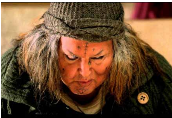
مشهد من فيلم «بيستاردو»