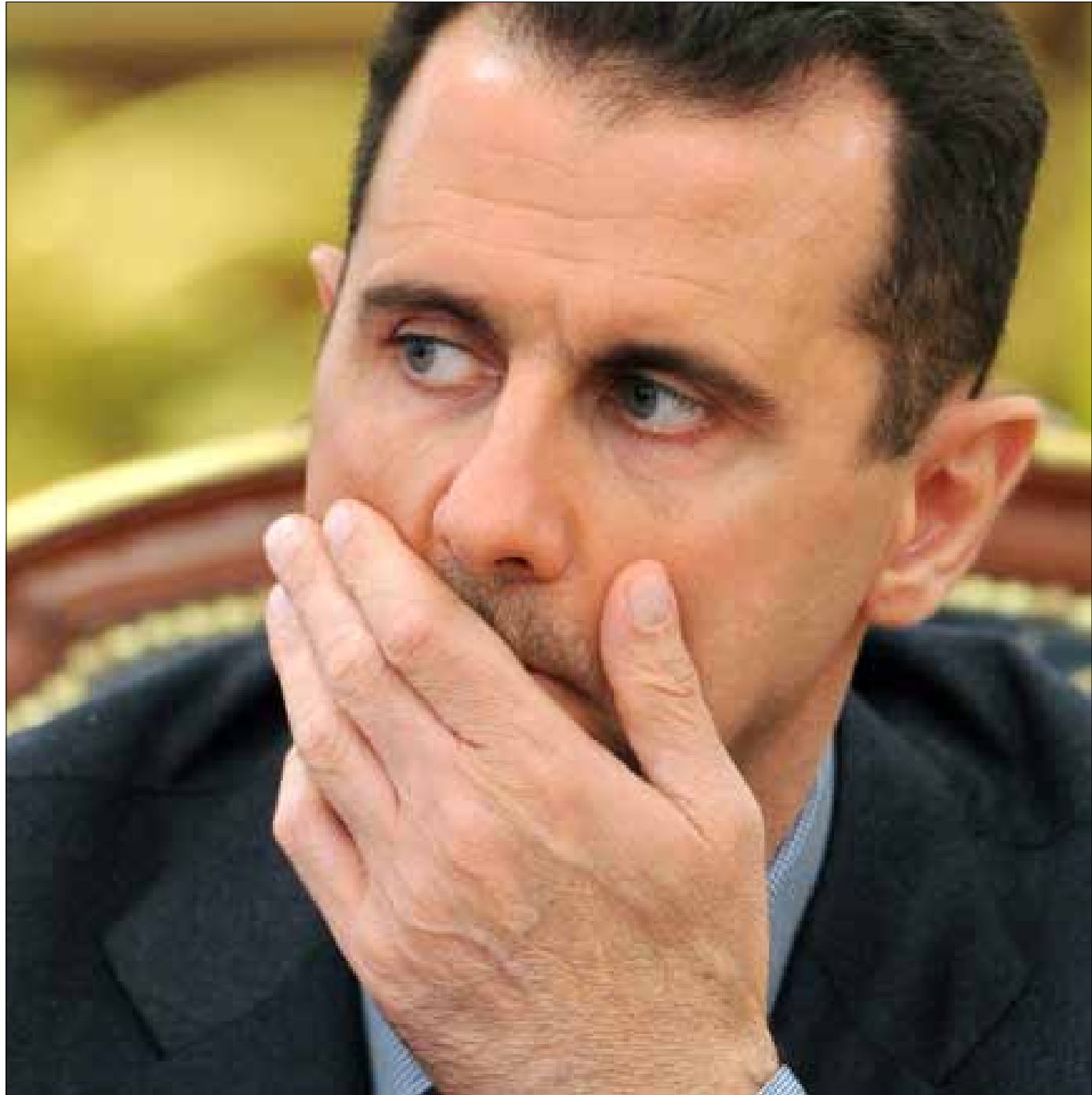
الاسد يريد انتخابات الرئاسة في تموز المقبل بعد استرجاع الجيش المدن الكبيرة وبينها حلب

آنذاك، سمع المسؤول الأوروبي كلاماً إيرانياً قاسياً عن دور السعودية وقطر في نشر الإرهاب. قال المسؤولون الإيرانيون إن البلدين، وبتشجيع دولي، يخزبان المنطقة وكل جهود السلام في سوريا. قالوا، أيضاً، إن الإرهاب سيرتد على السعودية وقطر. قدّموا معلومات ولوائح ووثائق حول وصول الدعم إلى إرهابيين. تحدّثوا عن أحد أشقاء الأمير بندر بن سلطان كجسر للتمويل. في 26 شباط، أي بعد أربعة أيام فقط من زيارة الوزير البلجيكي، وصل إلى طهران