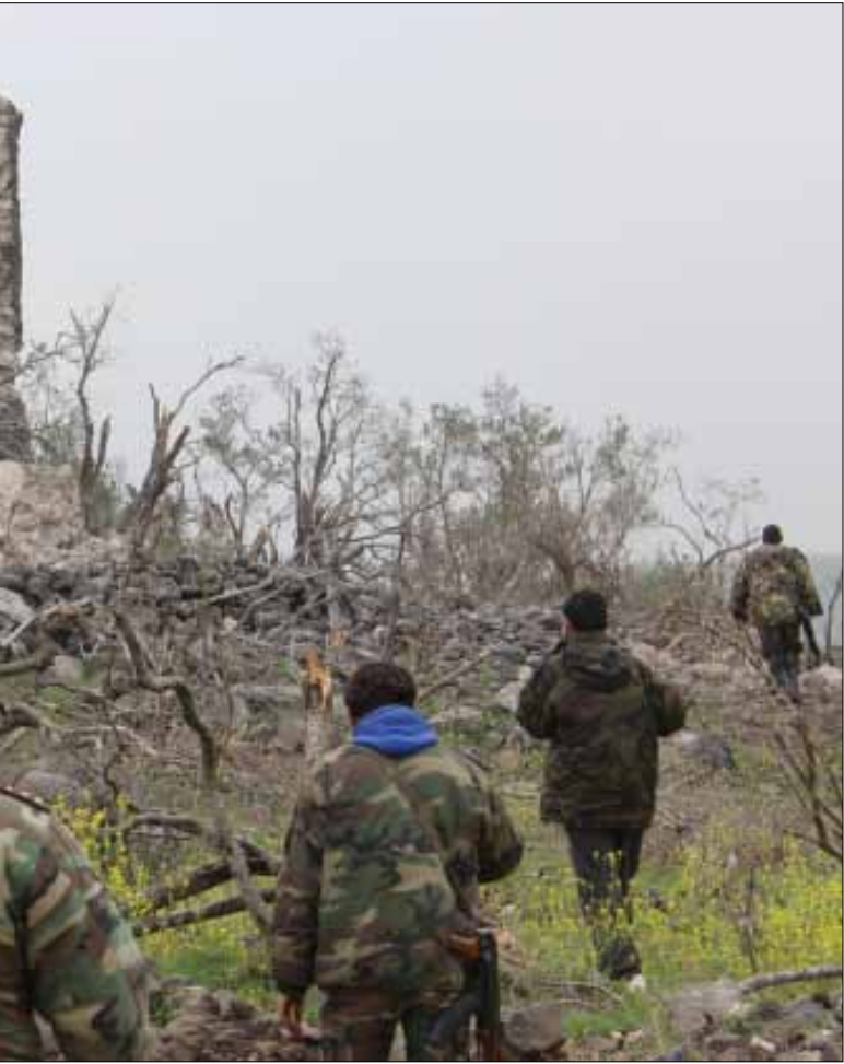
الرحلة إلى البرج تتطلب السير لعبور المتاريس والأنفاق التي خلفها المسلحون

الذي كان يتعرّض للقنص خلال المعارك العنيفة يؤدي إلى حي اليمني، ما يعني المضي في محاذة مناطق الاشتباك، حيث يمكن تمييز سلسلة بيوت أكثر فخامة، في ما يُعرف بـ«قصر اليمني». الطقس المتقلب والهواء الشديد يوحيان بالكثير من الأمطار القادمة.