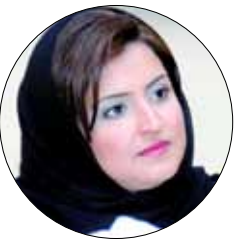
انسحاب الأعلام من «العرب»