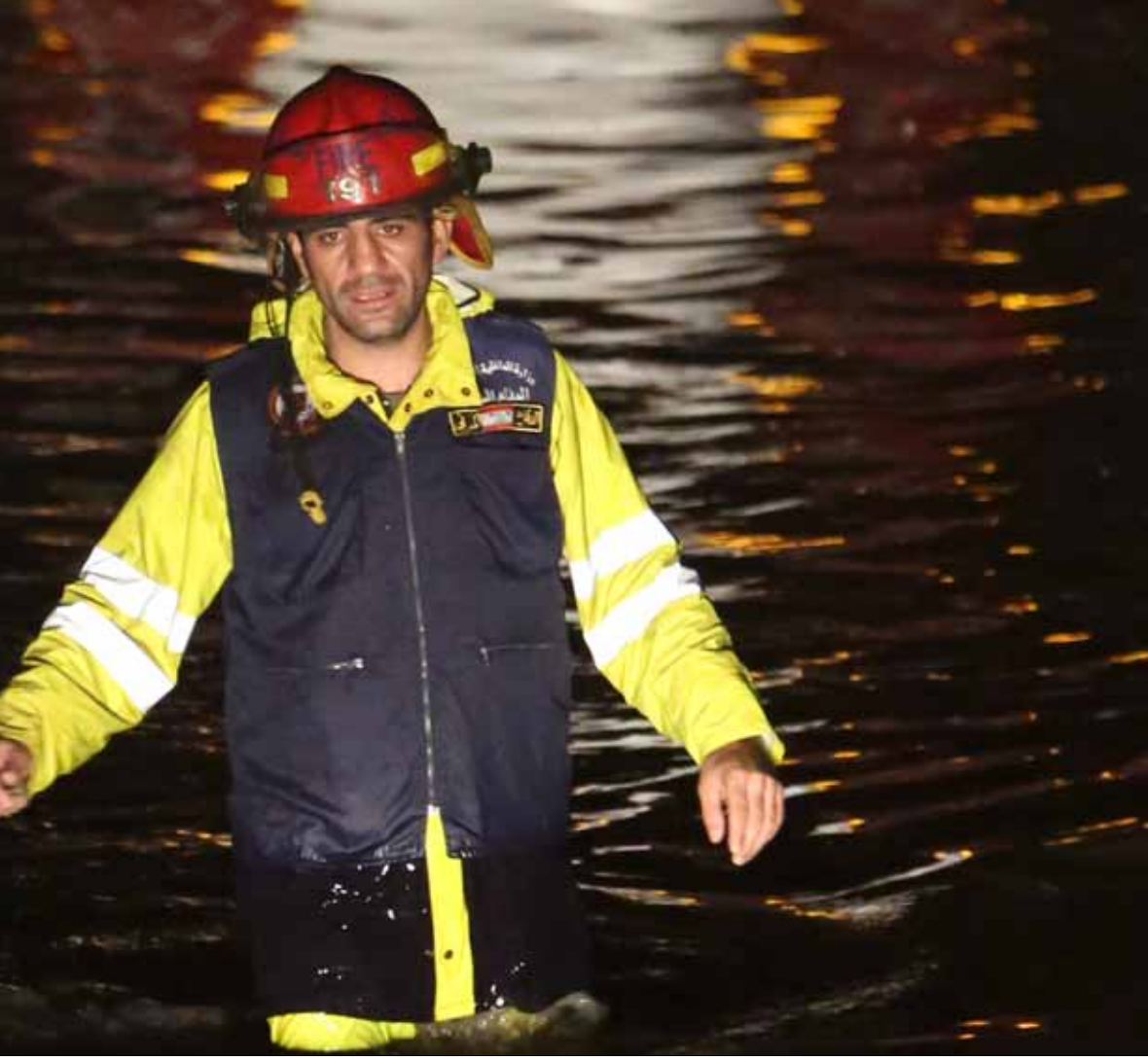
النقاشات الجارية كشفت عن وجود أكثر من مشكلة في بيروت الكبرى

ويضيف النائب: «لقد استمعنا إلى إفادات كثيرة اليوم عن ملفات نعرفها منذ تسعة سنوات ولم تتغير بعد، ولم ينجز أي منها بعد». هذه هي خلاصة ما حصل في الجلسة، رغم أن بدايتها كانت مختلفة قليلاً. فقد دُعي إلى الجلسة كل من أعضائها النواب، والمتعهدين المسؤولين عن تنفيذ التزامات الصيانة، وممثلين عن شركة MEAS، وغاب عنها الوزراء غازي العريضي، المال محمد الصفي والطاقة والمياه جبران باسيل. غياب الوزراء هو أكبر دلالة على مستوى اهتمام الحكومة «المستقبلية» بملف كهذا يُغرق اللبنانيون بالأمطار الشتوية وعواصفها العادية. في البدء، تمحور النقاش حول قضية دفع الأموال التي أثارها الوزير العريضي، متهماً الصفي بأنه سبب