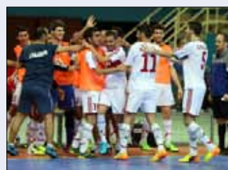
منتخب الصالات يحتفل بالتاهل