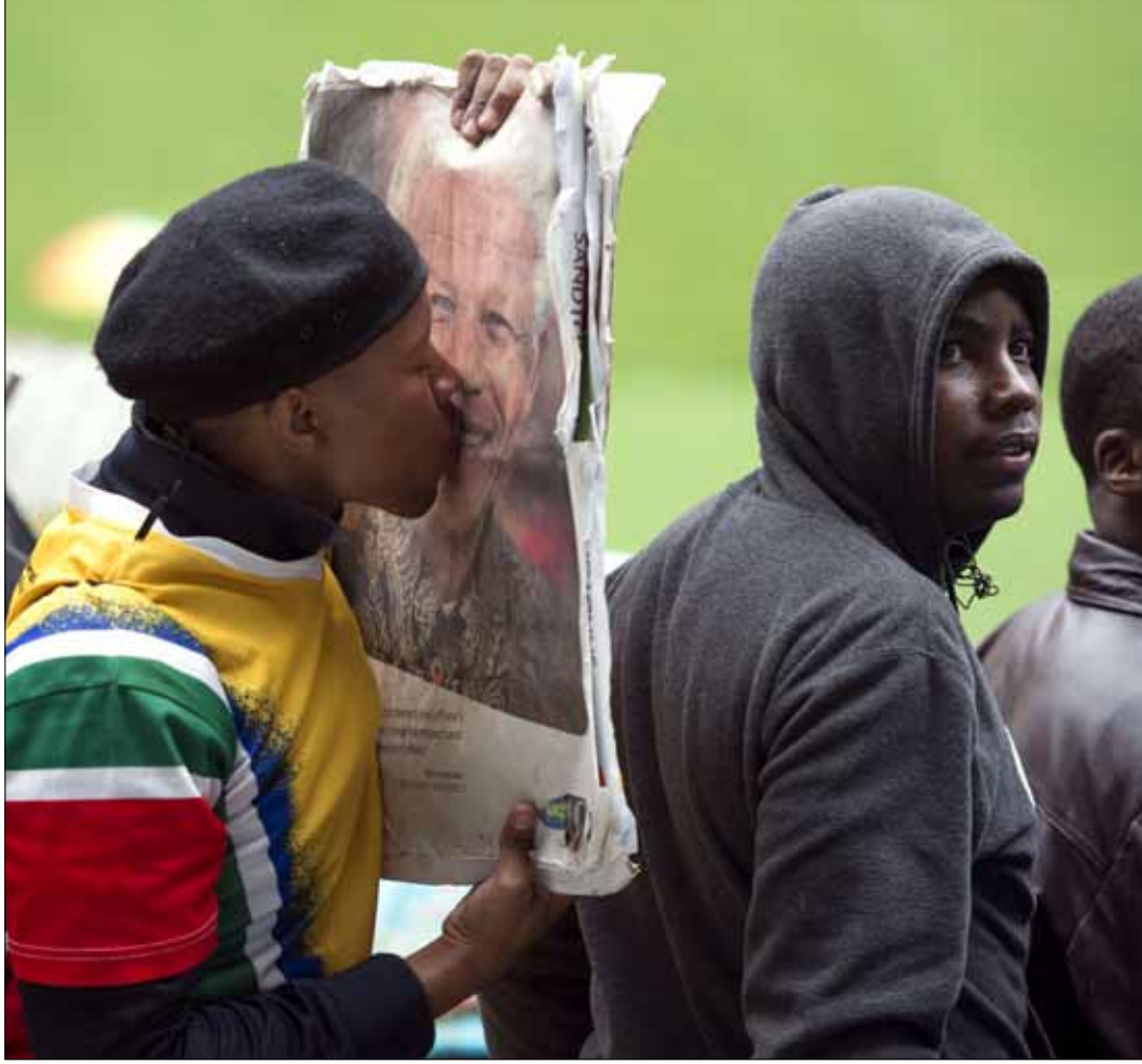
مات مانديلا وتركنا في عالم أكثر وحشية وجهلاً وانانية