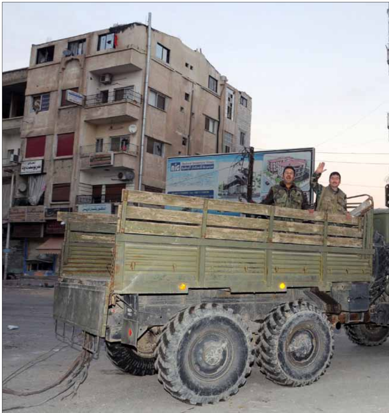
«الجبهة» و«الدولة» يتهمان «جيش الإسلام» بالخذلان، و«الجيش» يقول إنه قاتل وحيداً في النبك

أبي بكر البغدادي» في الشمال السوري، الذي أعلن قبل يومين بدء معركة كبيرة في ريف حلب». معركة تقول المصادر الرسمية السورية إنّ «الجيش أعد نفسه لها جيداً». في السياسة، ليست الرياض في موقع عسكري ميداني يمكنها من المطالبة بثمن إضافي في جنيف 2.