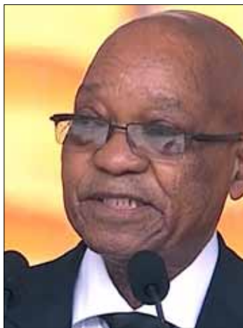
قوبل رئيس جنوب أفريقيا جاكوب زوما بصيحات استهجان

في الوقت نفسه، قوبل رئيس جنوب أفريقيا جاكوب زوما بصيحات استهجان مع بداية مراسم تأبين مانديلا، بينما هتف الحاضرون في الملعب ترحيباً بالرئيس الأميركي عندما ظهر وجهه على الشاشات