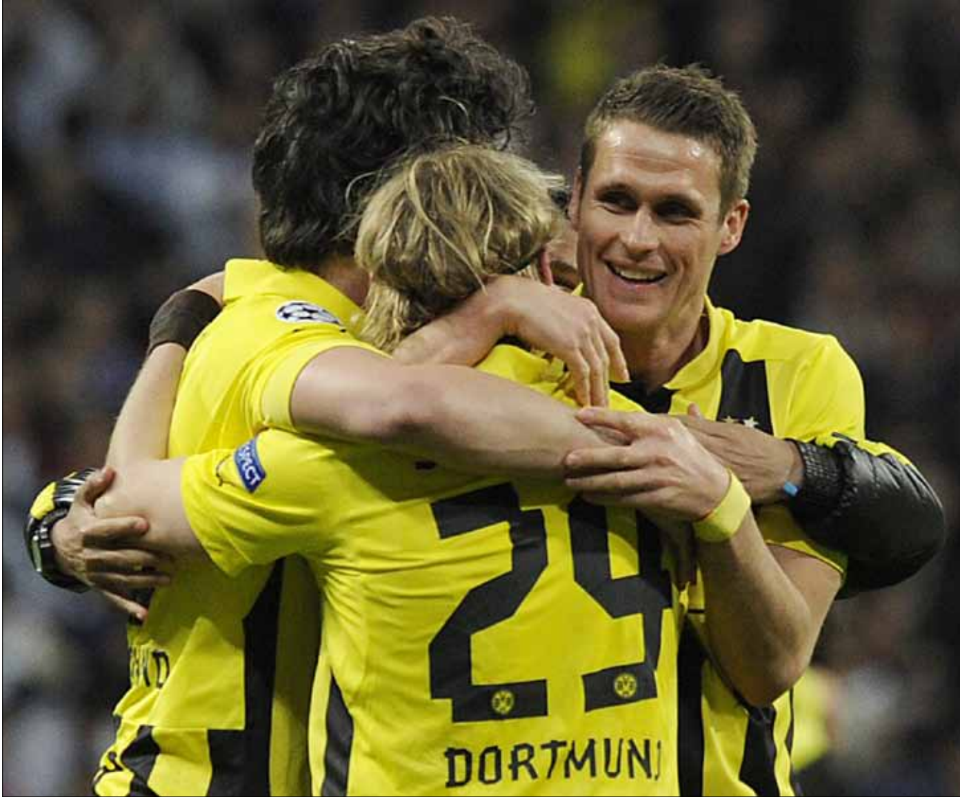
يعاني مدرب دورتموند يورغن كلوب كثرة إصابات لاعبين أساسيين

يعاني بوروسيا دورتموند على صعد عديدة. الفريق الذي وصل الى نهائي دوري الأبطال الموسم الماضي يواجه خطر الخروج من دور المجموعات. في مباراته الليلة أمام مرسيليا (الساعة 21:45 بتوقيت بيروت) ينتظر منه مشجعوه الخروج فائزاً على عكس إدارة النادي التي ترتقب الخسارة، على نحو مستغرب