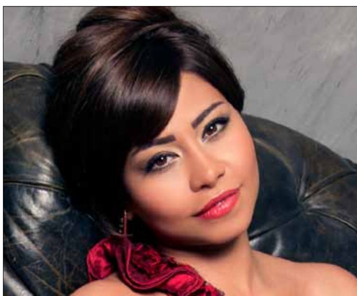
تقدّم في المفاوضات مع باسم يوسف، وشيرين باقية في The Voice

هكذا، تستقبل (مصر) هذا الموسم من The Voice، بينما تستعد لإطلاق سلسلة برامج جديدة، وتسعى إلى تعزيز موقع القناة في المحروسة من خلال مفاوضات تجريها مع مجموعة من الإعلاميين المصريين البارزين للتعاقد معهم، منهم المذيع شريف عامر الذي كان قد استقال من «الحياة» حيث كان يقدم برنامج «الحياة