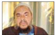
هنا طرابلس 21:30 ■ «المستقبل»

يتمحور برنامج «لعبة الأمم» اليوم حول الاتفاق الإيراني - الغربي الذي جرى التوصل إليه أخيراً في جنيف. يستقبل الإعلامي سامي كليب الديبلوماسي نايف حتى (الصورة)، لي طرح عليه أسئلة عدة منها: «أين العرب وجامعة الدول العربية؟»