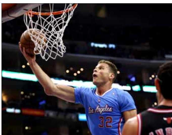
برز غريغين من كليبرز امام فيلادلفيا

فيلادلفيا سفتني سيكسرز 83-94. ورفع كليبرز رصيده إلى 14 فوزاً في 22 مباراة، ولقي فيلادلفيا في المقابل خسارته الخامسة عشرة في 22 مباراة أيضاً، حيث يحتل المركز الثالث في مجموعة الأطلسي.