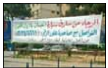
أضحك عليها... تنجل 21:30 ■ Ibc

تستضيف الحلقة الخامسة من برنامج «الخزنة» الليلة حليمة بولند (الصورة) في حوار صريح مع أمير كرارة. كيف تردّ الإعلامية الكويتية على الشائعات التي تتحدث عن استغلال مفاتها لتصل إلى مبتغاه؟ وما حقيقة زواجها بالرئيس الليبي الراحل معمر القذافي؟