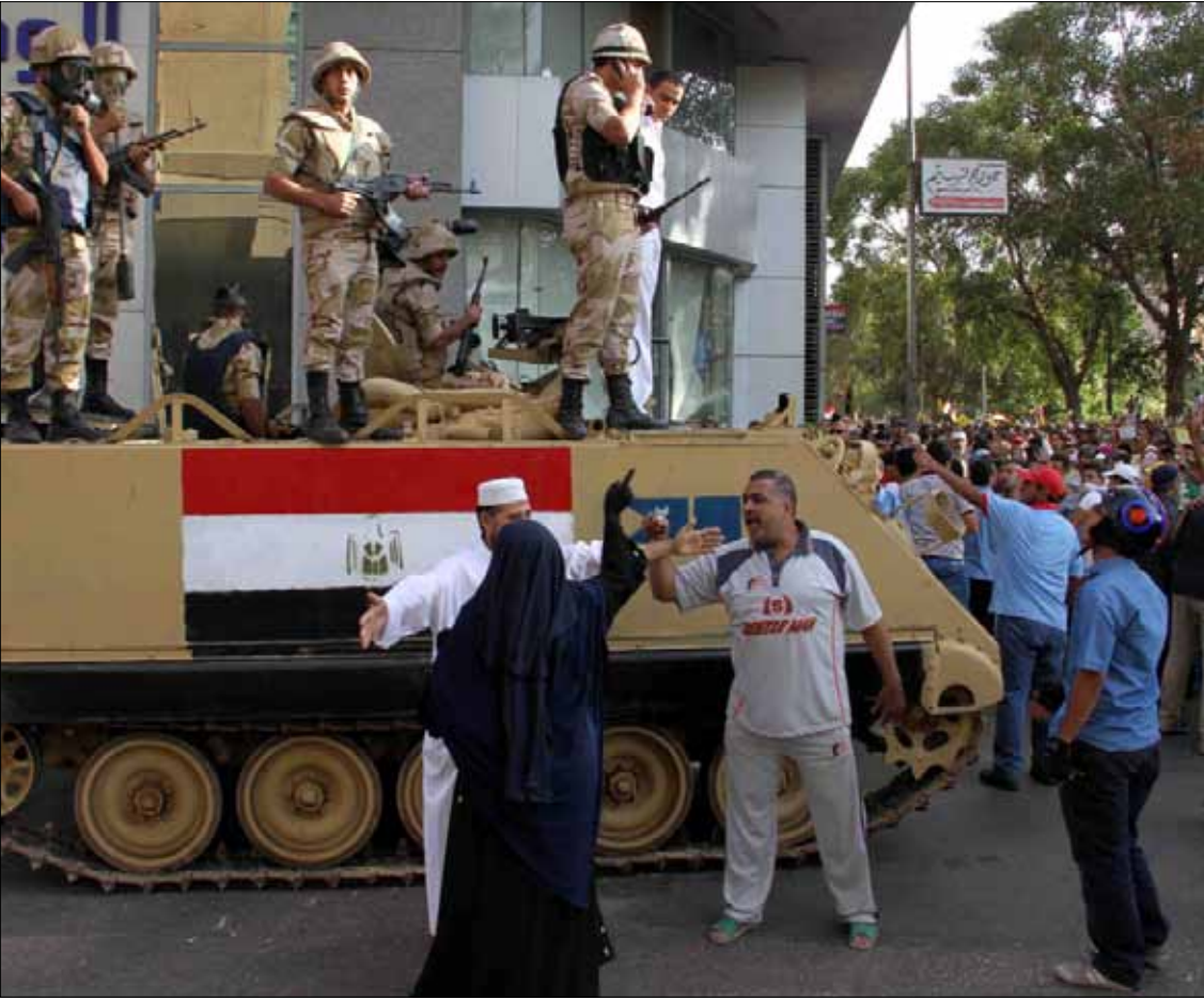
اعتقل 44 شخصاً من مناصري الرئيس المخلوع في أسيوط أمس

في إطار آخر، رأت مصادر مطلعة لـ«الأخبار» أن جهتين لهما مصلحة