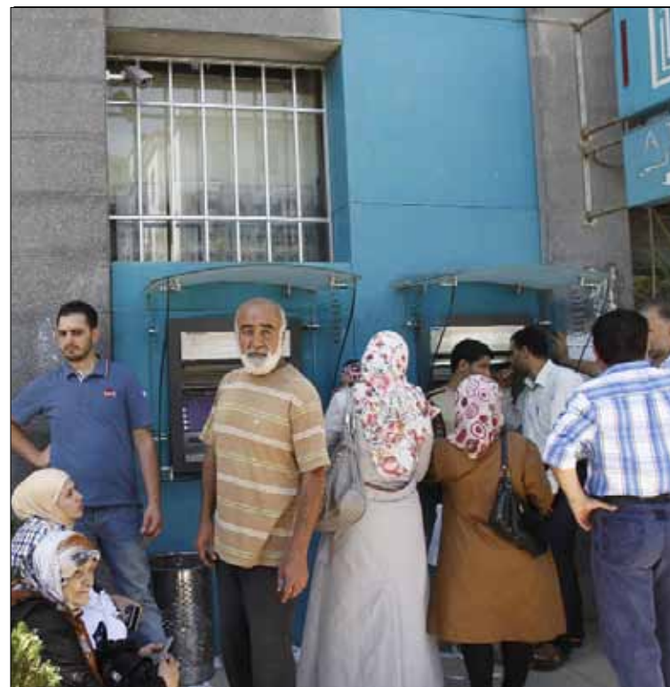
فقد الدولار بريقه بالنسبة إلى كثيرين مع استمرار التلاعب بسعره

التي ستستوردتها أو تبعتها، لكنه يتوقع أن تكون هذه الخطوة تشجيعية للكثيرين لتكرارها، مشيراً إلى أنه ليس من الضرورة أن تباع هذه الكمية مباشرة، إذ إنها في الغالب ستباع من خلال مراكز تعتمد أسلوب البيع بالجملة لتزويد الصاغة بما باعوه من ذهب. ولفت إلى أن لهذه الخطوة أهمية بالنسبة للخزينة لأنها تسمح بإدخال الذهب الذي يتميز بأنه يحافظ على قيمته ولا يخسرهما مثل باقي المنتجات. وكان تقرير لـ«مجلس الذهب العالمي»، صدر في نيسان الماضي، قد ذكر أن سوريا تراجعت إلى المرتبة 56 في احتياطي الذهب عالمياً، بعدما احتلت المرتبة 55 عام 2012. وأشار إلى أن سوريا احتلت المرتبة الثامنة عربياً وأن مصرف سوريا المركزي يحوز 25,8 طن من الذهب، وهي كمية لم تتغير منذ عام 2008 حتى نيسان 2013.