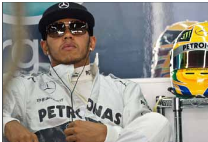
هاميلتون خلال التجارب

المستقبلي في فيراري الاسباني فرناندو ألونسو الذي حل سادساً في الجولة الاولى امام الفرنسي رومان غروجان (لوتوس رينو).