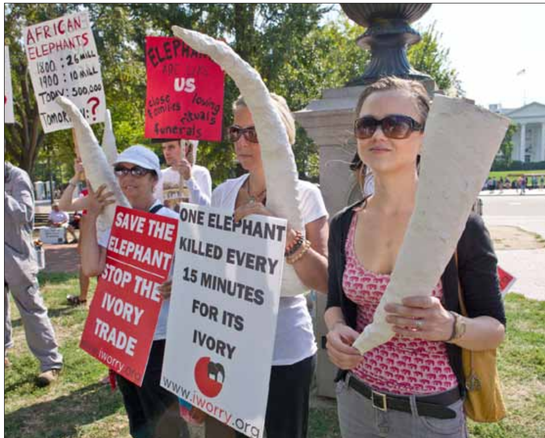
تعلق الولايات المتحدة بين حدي مقص: من جهة يزداد اعتمادها على العولمة ومن جهة أخرى، تنقلص حصتها من هذا الاقتصاد

تبدو قضية أميركا في النظام النقدي كمحاولة ملاكم هزم في معركة أخيرة لاستعادة الحزام الذهبي