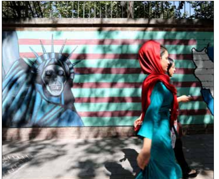
سارت في طهران امس مسيرة ضد سياسة اوباما (عطا كناري - ا ف ب)

كانت هذه الضغوط ذات جدوى لكان لزاماً أن يتنازل الشعب قبل سنتين عندما قلتم ان هذا الحظر هو حظر مشل».