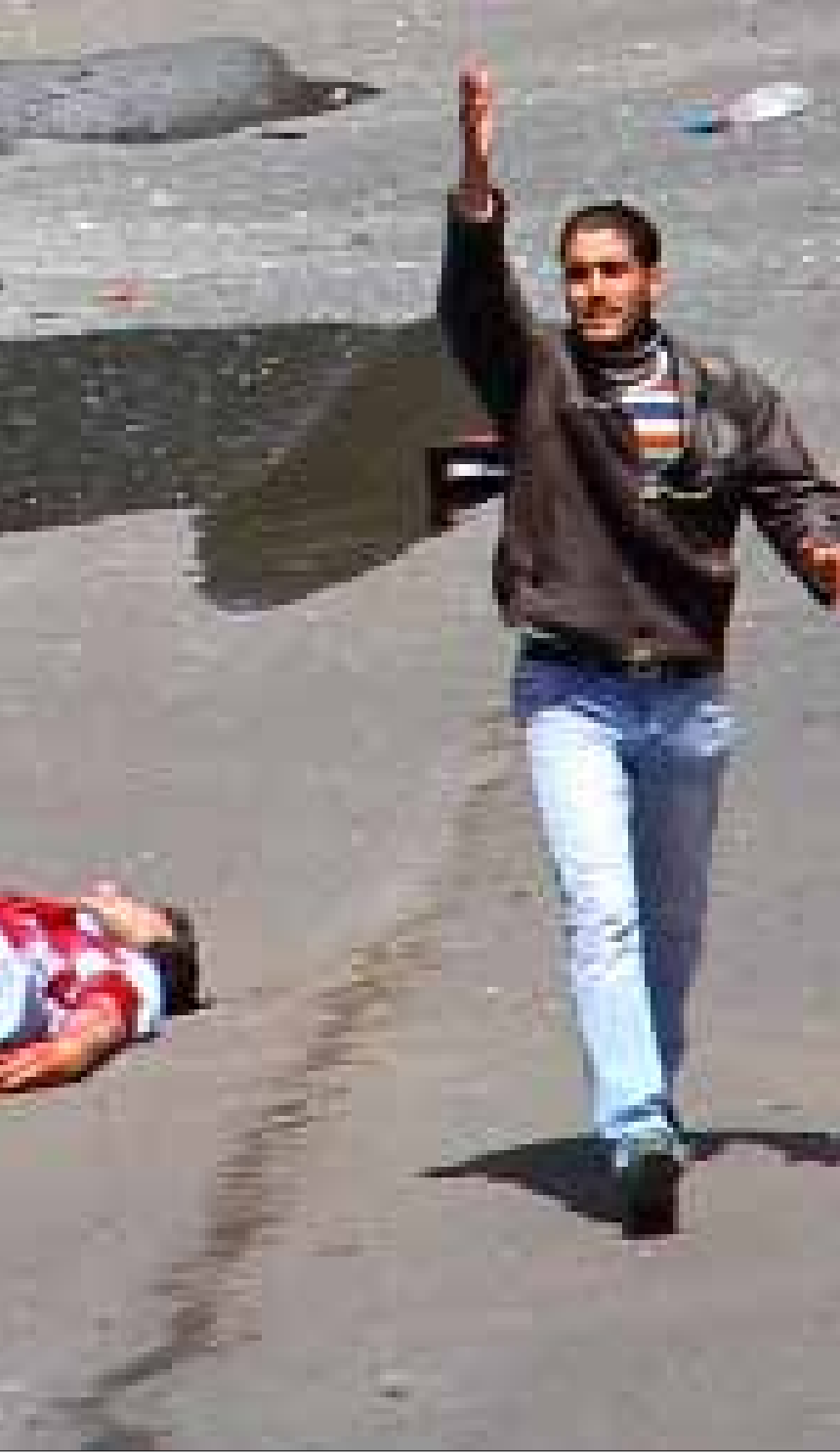
تعرض جرمانا لسقوط قذائف الهاون على نحو شبه يومي من جهات ثلاث (أ ف ب)

لقذائف الهاون التي تنهال على دمشق وضواحيها، على نحو شبه يومي، أثر خاص في حياة الدمشقيين، يتجاوز تهديدها المباشر على حياتهم. فإلى جانب تأثيرها السياسي، الذي يتمثل بنقل التصعيد العسكري إلى التجمعات البشرية الكبرى، الأمانة نسبياً، يبرز دور نفسي - اجتماعي مدمر لهذه القذيفة البدائية بما تشيعه من رعب وقلق دائمين