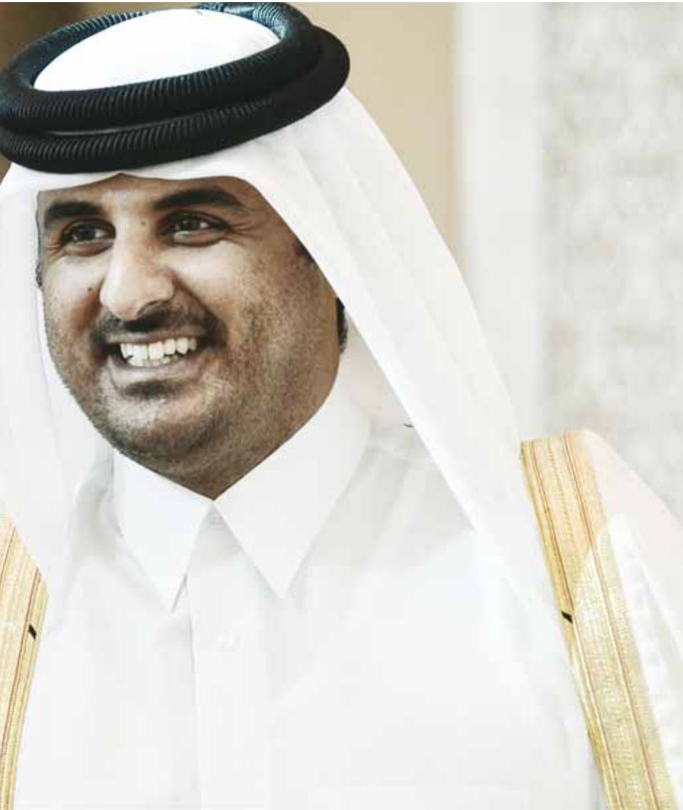
من يزور قطر يرى معالم الوجود العسكري والاستخباراتي الأميركي أينما حلّ

لكن النظام القطري تحالف مع أعداء النظام السعودي: إيران وسوريا وحزب الله وحماس. غير أن قرار التحالف هذا كان بدافع التباعد