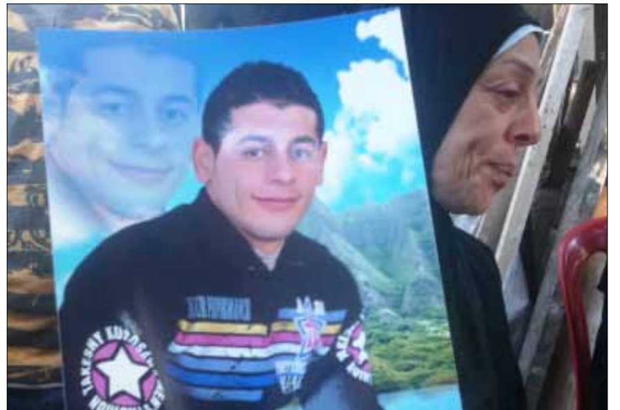
تم حتى الآن الكشف على 36 جثة (أرشيف)