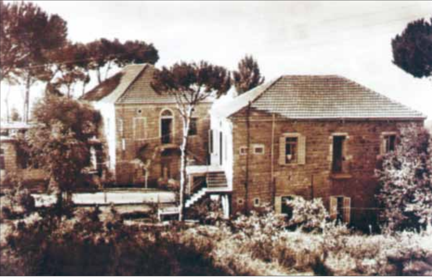
ناشر مجهول، بطاقة بريدية، فندق «رويال»، حوالي عقد 1940