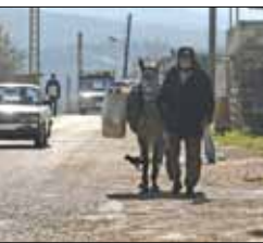
فندق أو عاصمة الجرد العكاري المنكوب: مأساة العبارة بدأت هنا