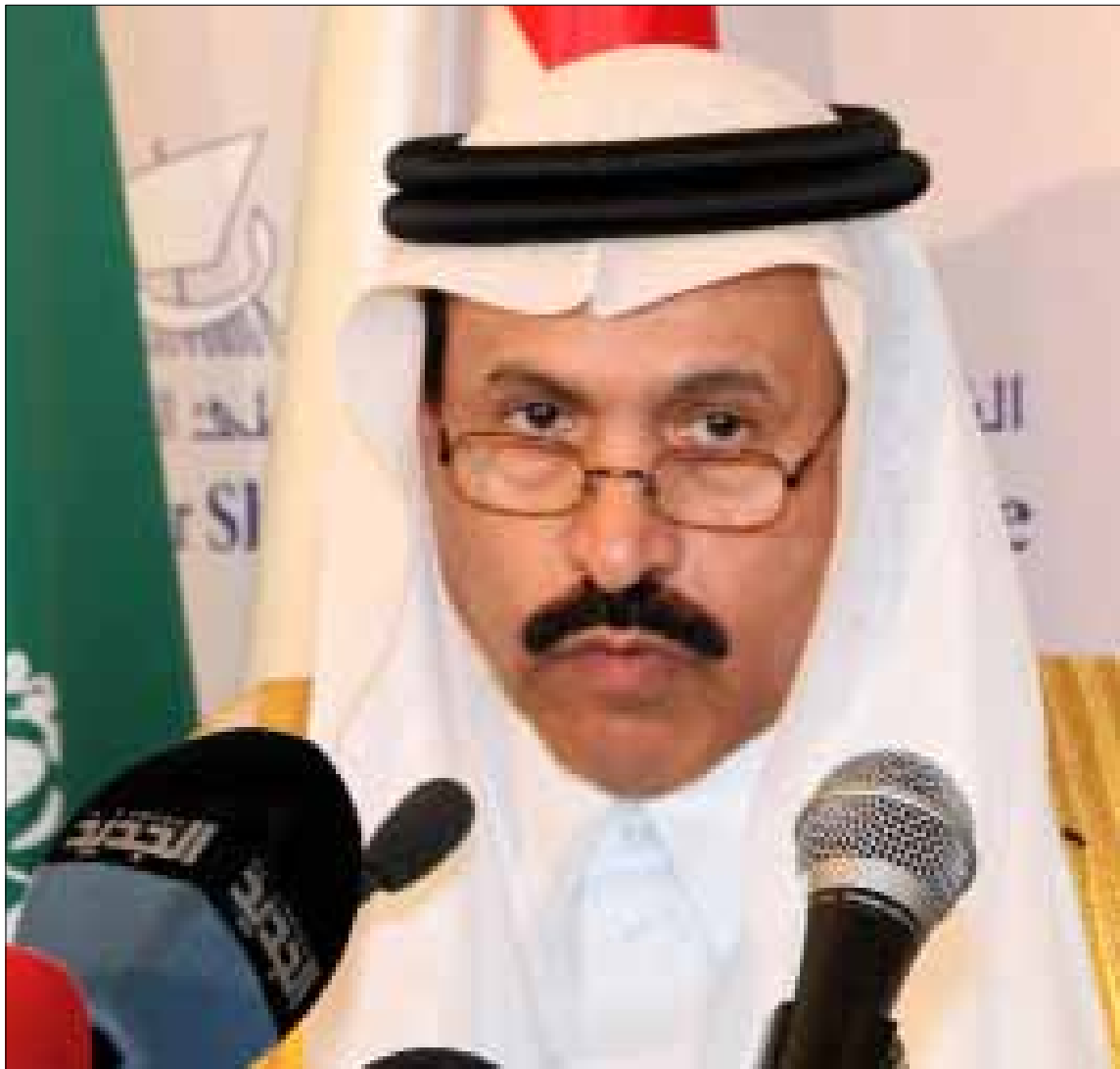
السعودية مصرة على نقل المخاض السوري إلى لبنان في السياسة والأمن

قد يؤدي التيار الوطني الحر دوراً إيجابياً في تخفيف حدة الاحتقان السياسي، ويؤمّن الحد الأدنى من التواصل بين مختلف الأطراف، كحزب الله والمستقبل مثلاً، وقد لا ينجح. لكن «فليطمئن المنتظرون. ليس الجنرال عون من يفضّ تحالفاته، وخاصة في الوقت الذي يكون فيه حليفه تحت النار المحلية والإقليمية والدولية».