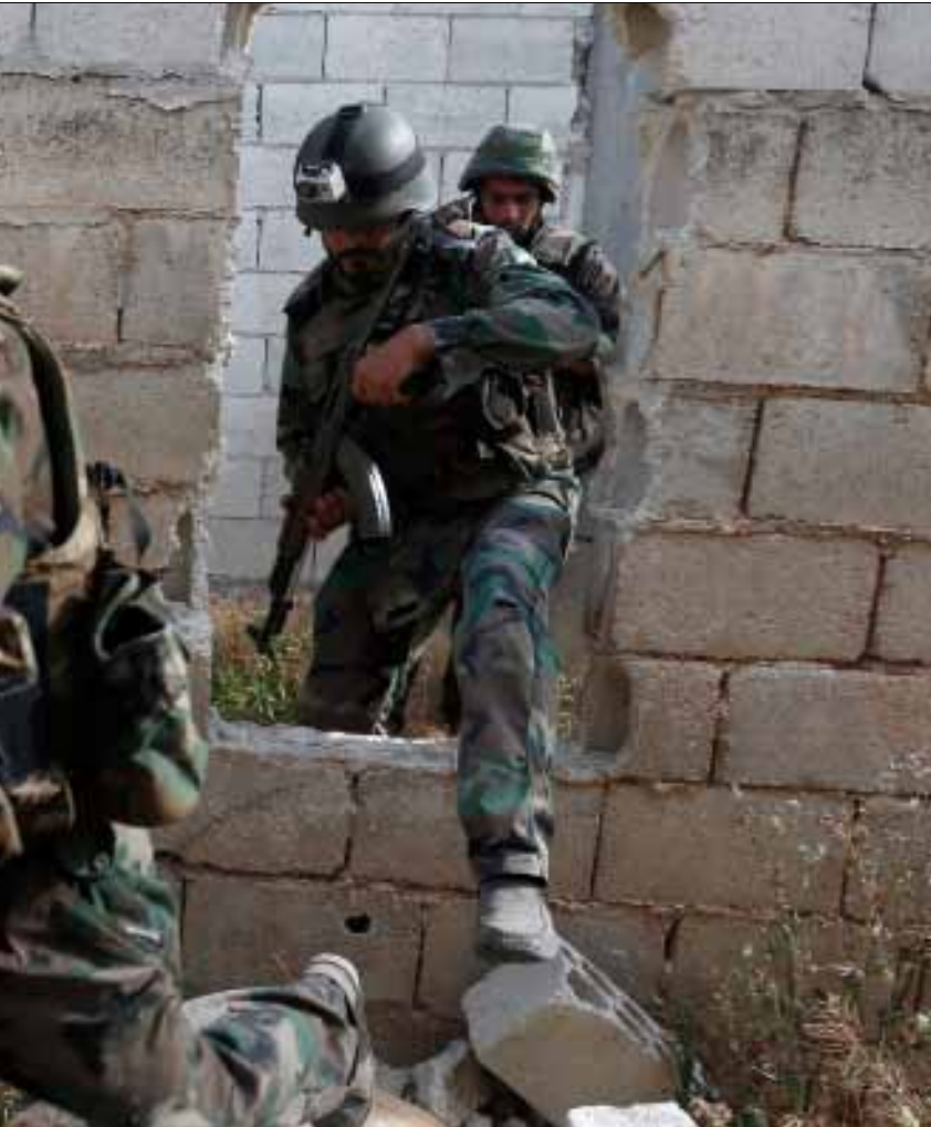
تدمير مدارج المطارات العسكرية يحقق أول تكافؤ بين النظام ومعارضيه (هينم الموسوي)

1 - يتصرف الأسد على أنه مرتاح إلى سير عمل آلة الدولة والإدارة وانضباط الجيش والأجهزة الامنية العاملة بانتظام إلى حد، وأن كانت قد فقدت هذه سيطرتها على عدد من المناطق جزئياً أو كلياً. لا يزال النظام ممسكاً بمركزية القرار وتوجيه الإمرة وإدارة النزاع المسلح مع المعارضين، معولاً