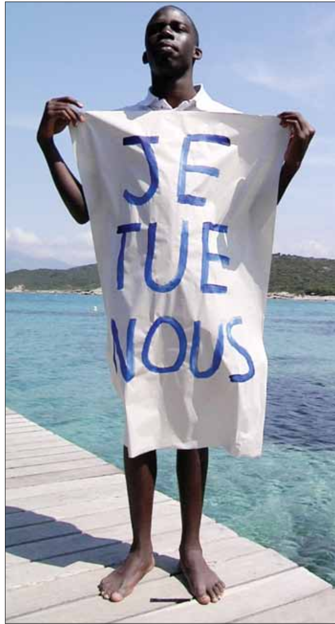
من تجهيز «2031 في المتوسط، مستقبلاً»

والبيئة والحكم مع الوجود الكلي للبحر والزرقة وأصوات الأمواج. «هنا، عندنا» عبارة يصرخ بها أحد سكان العشوائيات في مرسيليا، فيما كتب تونسي «جدار أبيض، شعب أبيض» أو «الشعب يريد» غداة ثورة قلبت بلاده، فيما يقول فلسطيني من مخيم صبرا «أريد العودة إلى بلادي». من خلال اعتماد البساطة، ينجح سودير في نقل قلق الشباب في العشوائيات الفقيرة الملوثة التي تقع على البحر، لكنها تدير له ظهرها، كما تديره للسفر والاستهلاك في سياق مختلف، يذهب تجهيز «أبعد من الأفق» لمخرج الأفلام الوثائقية برونو أولمير (أهلاً أوروبا) إلى استكشاف موضوع انتقال السلع والبشر في المتوسط. على جدار مرتفع، تترامى كلمات متصلة بالبحر، بالسفر، بالجسر، بالمنفى. ثم ندخل قسماً يذكرنا بأجواء أسواق تركيا. وعلى شاشة في صالة صغيرة أخرى، يمكننا أن نشاهد وثائقياً خيالياً بعنوان «المهاجرون غير الشرعيين» حيث الشخصيات مهاجرون اختبروا البؤس ووصلوا سرّاً إلى شواطئ أوروبا فانقذهم الصليب الأحمر. نخرج من هذا القسم لتدخل آخر على شكل مركب. ها نحن على متن سفينة فخمة تصدح فيها الضحكات الفارغة، حيث الرقص والمراكات الغالية فيتجلى الاستهلاك في تظهير واضح لغياب المساواة بين صفتي المتوسط، الأمر الذي يندد به برونو أولمير. هكذا، نخرج من الفيلا يتنازعنا إحسانان: إرادة الفنانين المشاركين على كسر الحواجز السياسية والتضيق باللامساواة والظلم بين صفتي المتوسط، ومن الجهة الأخرى سياسيون ينفقون ملايين من اليورو في هذا المشروع الثقافي ذي الغايات السياسية. أمام هذا الواقع، لا نملك سوى التساؤل: في وجه السياسة، إلى أي مدى تقدر الثقافة على التوغل عميقاً وبعيداً في طرح الأسئلة؟