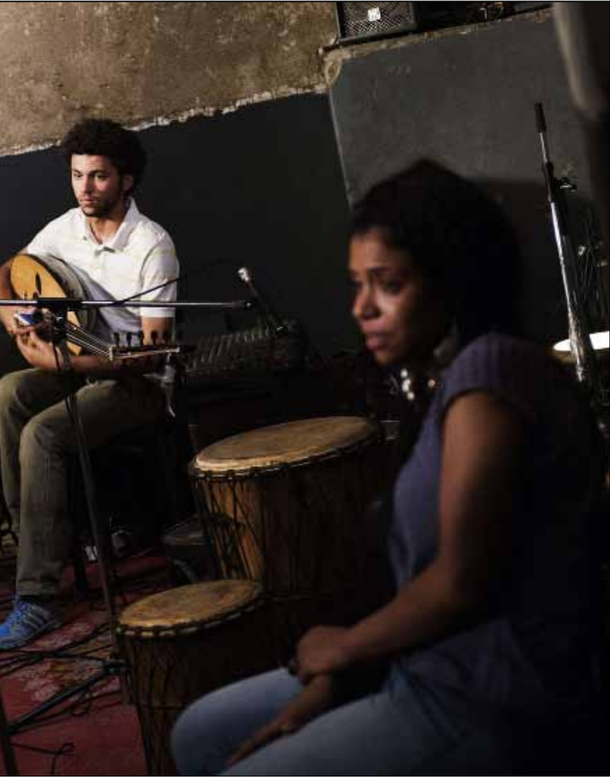
قبل دقائق من بدء سريان حظر التجوال في القاهرة

إلى المنزل والخوف من الاعتقال بتهمة خرق حظر التجوال. وعن استمرار حالة الطوارئ، يقول رئيس الحكومة حازم الببلاوي إن حكومته لا ترغب في فرض إجراءات استثنائية، مشيراً إلى أن حالة الطوارئ هي «إجراء مؤقت ولن يستمر إلى ما لانهاية»، ولمح إلى أن من الممكن مد حالة الطوارئ إلى 3 أشهر، حسب الحالة الأمنية.