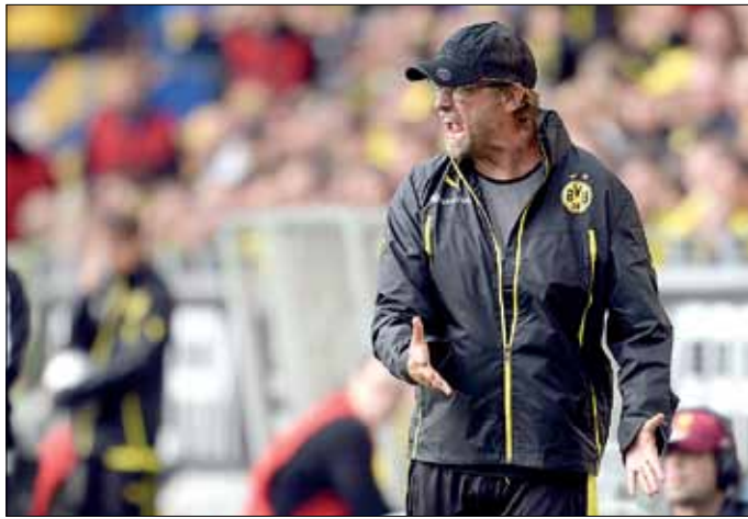
مدرب بوروسيا دورتموند يورغن كلوب

كما وصف كلوب لاعب ريال مدريد السابق مواطنه مسعود أوزيل، الذي انتقل إلى أرسنال الإنكليزي مقابل نحو 50 مليون يورو، بأنه «نجم». ولم يبد قلقاً من مواجهة مواطنه عندما يلتقي الفريقان في نفس المجموعة بمنافسات بطولة دوري أبطال أوروبا.