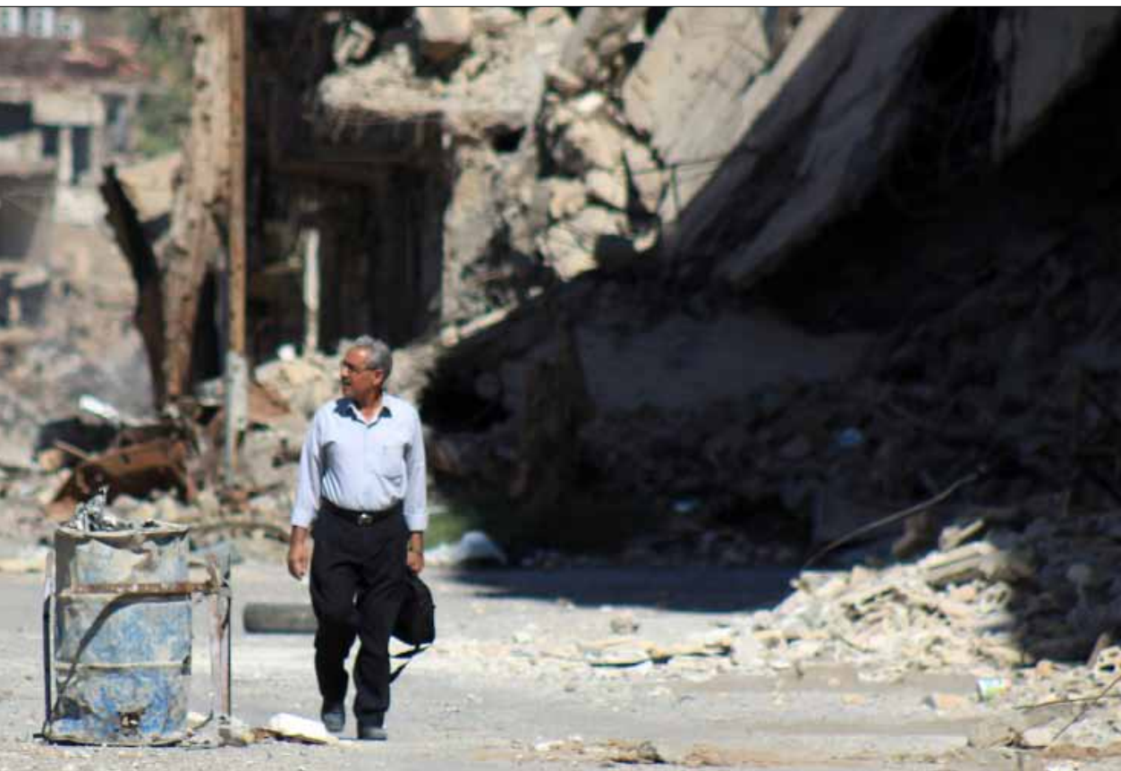
في احد احياء دير الزور المدمرة أمس

في إطار آخر، أعلن الأمين العام للأمم المتحدة بان كي مون، في تصريح على هامش أعمال قمة العشرين في بطرسبورغ، أن «موظفي الأمم المتحدة العاملين في سوريا لا يخططون لمغادرة البلاد، على الرغم من تفاقم الوضع الأمني