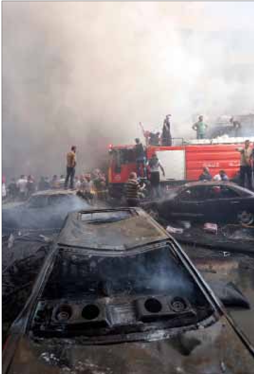
يعبر كثيرون عن سعادتهم بتقلص عدد «الزعران» في الشوارع

على الأرجح لم يكن اختراع مصطلح «البيئة الحاضنة» عبثياً، من الأمن العام لحزب الله