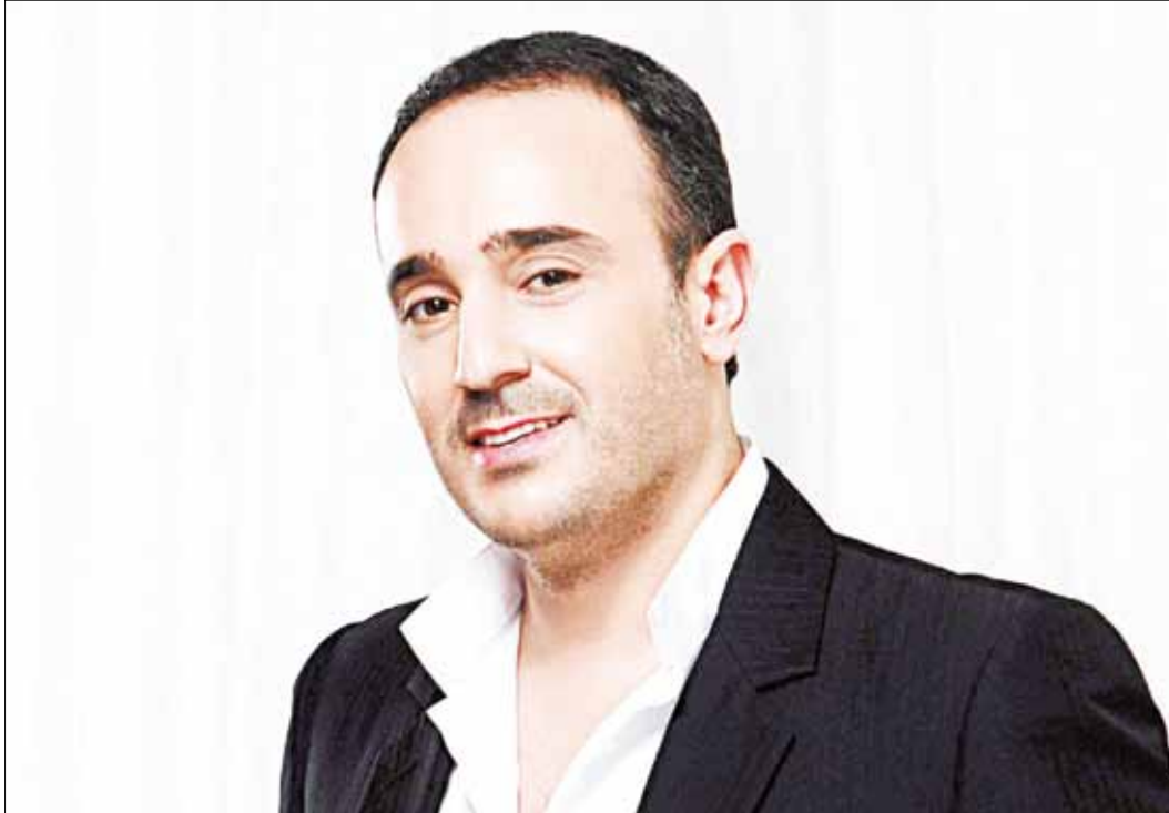
بعدها اشتهر البرنامج على lbei الاحتمال كبير بان تنتزعه mtv

في منتصف الشهر الحالي، سيستمع المدربون الأربعة كاظم الساهر، وعاصي الحلاني، وشيرين عبد الوهاب، وصابر الرباعي إلى المشتركين في الاختبارات الأولى التي تسمى «العمياء»، قبل أن تتقالى المراحل وصولاً إلى التصفيات.