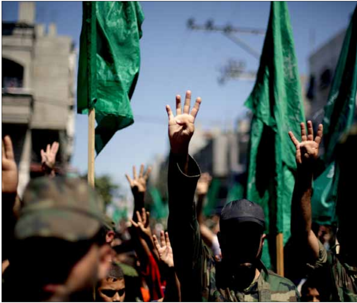
مقاومون يرفعون شارة «رابعة» خلال عرض عسكري لفصائل المقاومة في غزة أمس

وبين تصفيير المتمردين وعرض المقاومين، يبقى الشارع الغزي وحده المخوّل تحديد ممثله الشرعي والوحيد: «تمرد على حماس أم مقاومة ضد المفاوضات والمتمردين».