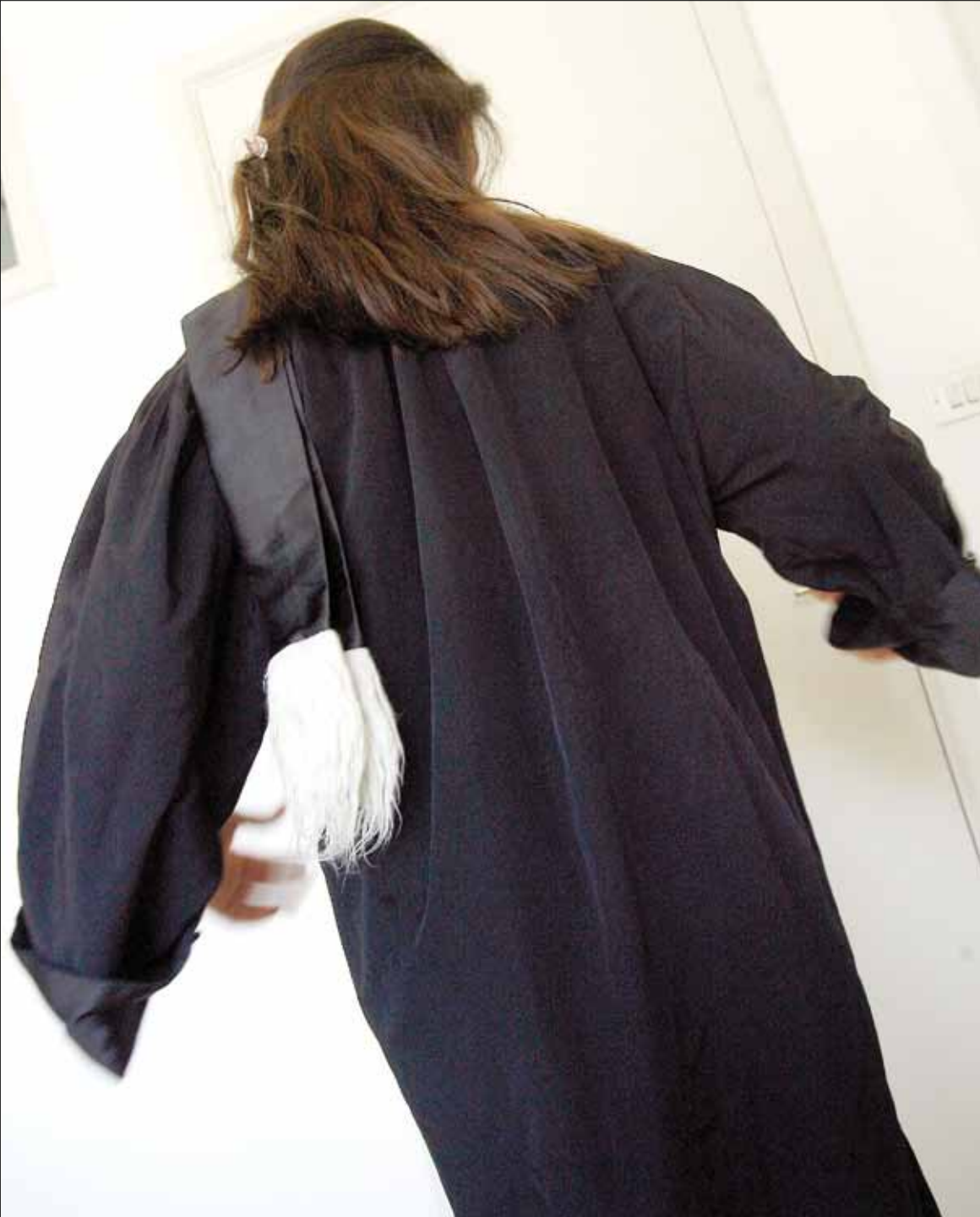
ليس منزلاً ونقطة وانتهى... هو منزل العائلة (مروان طحطح)

هكذا، وصفت منظمة كفى عنف واستغلال «إشارة» القاضية أرليت تابت التي قضت بموجبها بإلزام زوج بتأمين مسكن بديل لزوجته وطفلتيه بعد بيعه منزلهما الزوجي على اثر خلافات بينهما. هذه السابقة التي نادرًا ما تحدث في القضاء، جاءت لتحاكي ما تطمح إليه النساء من إقرار لقانون يحميهن من العنف الأسري