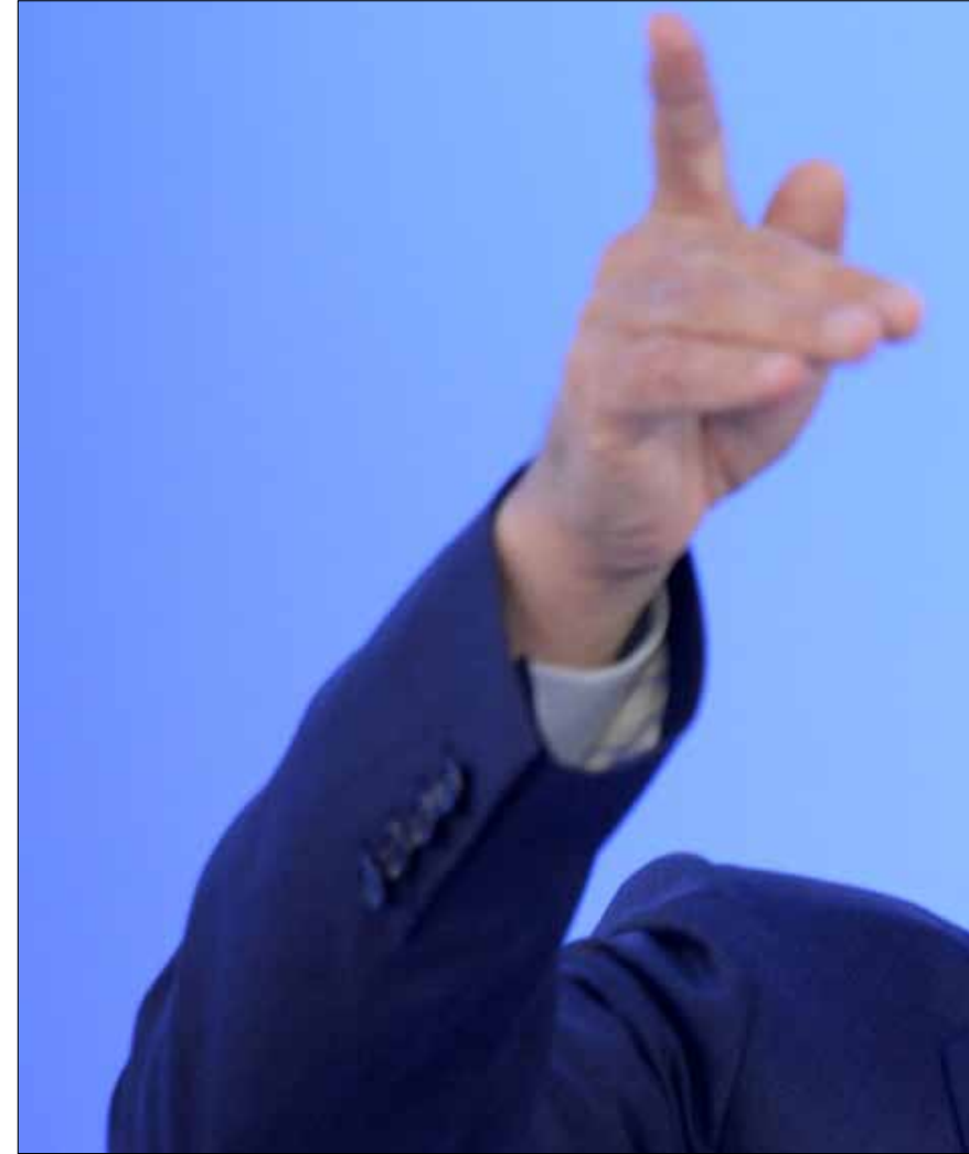
التدخل العسكري الخارجي

من أستراليا وكندا وفرنسا وإيطاليا واليابان وكوريا الجنوبية والسعودية وإسبانيا وتركيا وبريطانيا والولايات المتحدة. لم يصل البيان إلى حد الدعوة إلى القيام برد عسكري، لكنه قال: «ندعو إلى ردّ دولي قوي على هذا الانتهاك الخطير للقواعد والضمير العالمي. وهو ما من شأنه أن يبعث برسالة واضحة مفادها أنه يتعين عدم تكرار مثل هذا النوع من الفظائع. يجب محاسبة أولئك الذين اقترفوا هذه الجرائم». واضح أن الضغوط التي سادت أجواء قمة العشرين ضد الحرب، بما في ذلك مواقف ألمانيا والأمين العام للأمم المتحدة بان كي مون، ودول البريكس، قد أثمرت انخفاضاً في لهجة التصعيد الغربي؛ فالرئيس الفرنسي فرانسوا هولاند، أعلن أنّ فرنسا «تنتظر تقرير محققي الأمم المتحدة، قبل