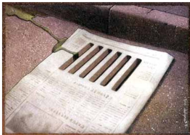
(باول كوزنسكي - بولندا)

الاحترافات الأمنية. موقع جريدة «النهار» الإلكتروني، بدوره، نشر تقريراً حول استعداد مجموعة من الفتيات للنزول إلى «ميدان التحرير» عاريات، احتجاجاً على إخلاء سبيل الرئيس المصري السابق حسني مبارك. التقرير المفبرك اعتمد على صفحة فيسبوكية عنوانها «لو مبارك أخذ براءة هنزّل التحرير ملط (عراة بالعامة المصرية)»، مضى على إطلاقها عامان تقريباً. لكن صاحب الخبر الكاذب يعلم أنّ القراء لن يسعوا إلى التحقق منه. الأدهى من ذلك، هو قيام صحف ومواقع معروفة، أبرزها «اليوم السابع» بنقل تصريحات لشخصيات سياسية وخصوصاً تلك المحسوبة على الإخوان المسلمين عبر حساباتهم على تويتر، رغم أنّها حسابات مزيفة تؤسّسها عادة مجموعة من الهواة.