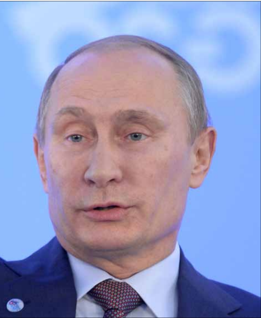
أكد بوتين أن بلاده «لا تريد الانجرار إلى حرب، لكنها ستواصل دعم دمشق بالمستويات الحالية نفسها في حالة

وتقلبت اسعار المواد الأولية». وقبل أن يدافع عن سوريا، انبرى بوتين، في مؤتمر صحافي أمس، للدفاع عن الدول التي تحاول تحقيق ذاتها اقتصادياً، فدعا إلى «ضرورة تحقيق المكاشفة والشفافية في أسواق الطاقة والخامات لكي يكون الوضع فيها قابلاً للتكهن»، أي قابلاً لاحتساب تكاليف إنتاج السلع والخدمات وتحقيق النمو وفق الخطط الموضوعية، بدل الفوضى العارمة القائمة في فوضى السوق الرأسمالي. وفي ما يخص الهدف الآخر المطلوب تحقيقه لاستقرار أوضاع الاقتصاد