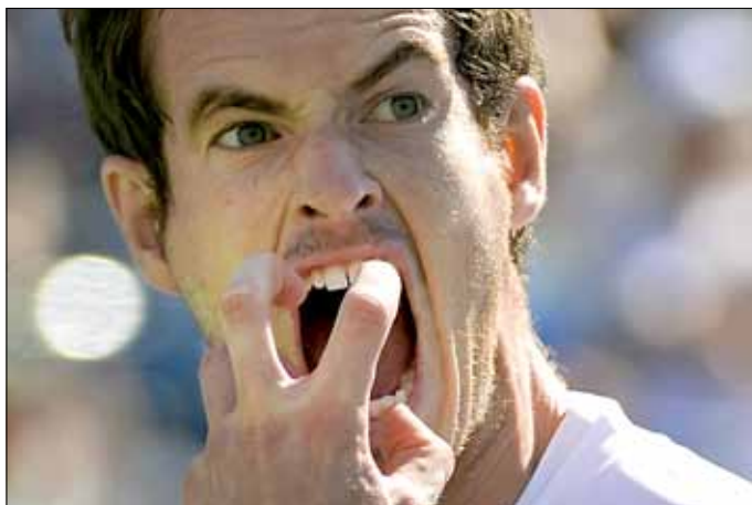
تعبير موراي بعد فقدانه اللقب

ويتفوق ديوكوفيتش على فافرينكا بمعدل 12 فوزاً مقابل هزيمتين فقط. وعلق الصربي على منافسه القادم: «لقد عمل كثيراً على تطوير نفسه