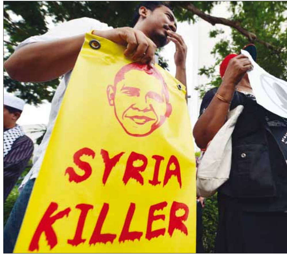
خلال تظاهرة رافضة للعدوان الغربي على سوريا أمام السفارة الأميركية في ماليزيا أمس

أما أبواق أنظمة النفط والغاز في العالم العربي فهي بحكم الجغرافيا مضطّرة لمضغ الكلام الشعبي الرومانيقي (المزيف والمدفوع الثمن) عن الشعب السوري وعن أطفال سوريا (هم أنفسهم الذين يتحدثون عن أطفال سوريا على «فايسبوك» من اللبنانيين الذين كانوا لسنوات خلت يجاهرون بدعوتهم لطرد العمال السوريين من لبنان. هم الذين ينهرون الأطفال