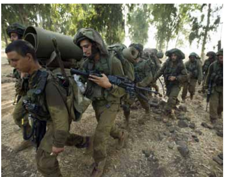
أملت إسرائيل أن تبدأ العملية العسكرية من دون أن تكون في الصورة مباشرة

لهجة إسرائيلية مغايرة حيال إمكانات الضربة العسكرية الأميركية لسوريا. الإعلام العبري عبر أمس عن أمل ضعيف في أن يستحصل البيت الأبيض على موافقة الكونغرس بمجلسيه مجتمعين. تقارير المراسلين الإسرائيليين المتنقلين بين أروقة الكونغرس وقاعاته، يتحدثون عن صعوبات وعراقيل باتت تعترض التصويت بنعم، فيما لا كبيرة تلوح من مقاعد مجلس النواب مع مداولات قد تستمر أسابيع طويلة. هل يكتفي الرئيس الأميركي، باراك أوباما، بتصويت مجلس الشيوخ بنعم على سوريا، من دون أن ينتظر تصويت مجلس النواب بلا متوقعة أيضاً؟ سؤال تناوله الإعلام العبري أمس، باعتباره مخرجاً «للأزمة تراجع الزخم في الكونغرس، بعد أن عاد أعضاؤه إلى