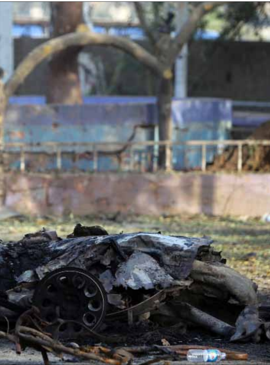
هل سيكون العراق ساحة للرد على المصالح الأميركية؟

«وول ستريت»: سليمانى أمر مجموعات عراقية بمهاجمة