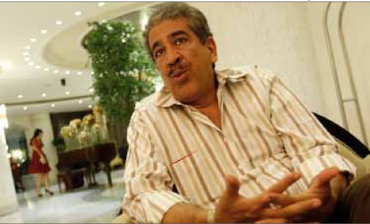
لبنان أضعف من أن يؤثر في الأزمة السورية

يُثقل كاهل مختار لماني مصير سوريا. يحكي المندوب الأممي عن مستقبل أطفالها، عن تاريخها الذي يُحرق وإرثها الحضاري الذي يُدمر. عن العديد من فتياتها اللواتي اغتصبن ثم قتلن. عن النساء اللاتي فقدن الأخ والأب والزوج. يقارنهن بصغيرته، ابنته التي مَرَّ على افتراقه عنها عام كامل من دون أن يراها. يستذكر محادثة بريدية بينهما منذ عدة أيام، ذكر لها فيها ما يجري على فتيات سوريا قبل أن يختم رسالته بعبارة أنه اشتاق لها كثيراً. فردت قائلة: «أنا فخورة ببابا». تدمع عينا الدبلوماسي الذي يحمل الجنسية الكندية، فيحكي عن فرح عظيم يتملّكه عندما يتخيل أنه قد يستطيع أن يُغيّر شيئاً، نحو الأفضل، في مسار مستقبل أطفال سوريا. «ما يهمني هنا المسألة». عبارة تطلقها بحزم ليدخل في صلب الأزمة. من على كرسيه في أحد فنادق جونية، يفرد الرجل أوراق الأزمة السورية. يستعير بعضاً من عبارات