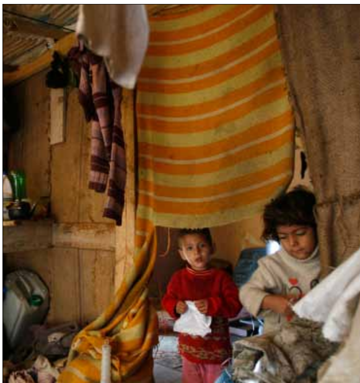
150 ألف مستخدم سوري للخطوط اللبنانية (مروان طحج)

هناك أيضاً بين 20 ألف خط و25 ألف خط سوري عامل على شبكة «Alfa»، عبر خدمة التجوال (Roaming). مع العلم بأنه حتى الآن لا يمكن حصر مستوى تداخل شبكتي الاتصالات الخلوية السورية مع الأراضي اللبنانية.