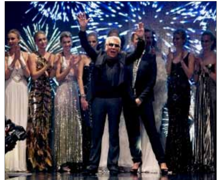
روبرتو كافالي في أول أسبوع موضة في تل أبيب

بعد أشهر على افتتاح مقهى تابع لمصمم الأزياء الإيطالي روبرتو كافالي في وسط بيروت يضم متجراً لبيع أفخم المنتجات الإيطالية من شوكولا ونبيذ وفودكا، أصدرت «حملة مقاطعة داعمي «إسرائيل» في لبنان» أخيراً بياناً لتنبه اللبنانيين إلى مساهمة كافالي في دعم الكيان الصهيوني و«عادته إلى خريطة الأزياء». وجاء في نص البيان: «يهمّ حملة مقاطعة داعمي «إسرائيل» أن تُعلم الشعب اللبناني والمسؤولين اللبنانيين أن كافالي أسهم بنحو أساسي، على مدى سنتين، في الإعداد لافتتاح «أسبوع الأزياء» في تل أبيب خلال تشرين الثاني 2011 بعدما قاطعه