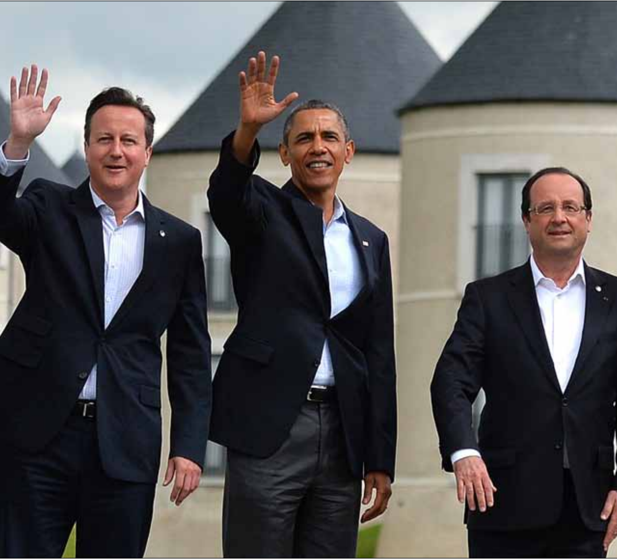
شكك أوباما في جدوى تدخل أكبر من شأنه أن يسمح بتجنب الفوضى

«سبعة مقابل واحد»، لم تنسحب على بيان قمة الثماني الكبار. حافظت موسكو على «ثوابتها»، لتخرج القمة ببيان «روسي الهوى»، يؤكد «بقوة» على أهمية الحل السياسي في «جنيف 2»، وعلى «تدمير المنظمات المرتبطة بالقاعدة»