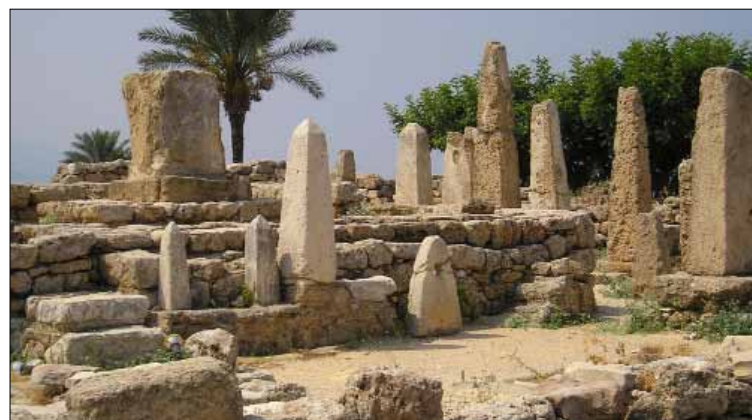
ينقص الموقع حراس لمنع الزوار من تسويه وبعثرة الأحجار (أرشيف)