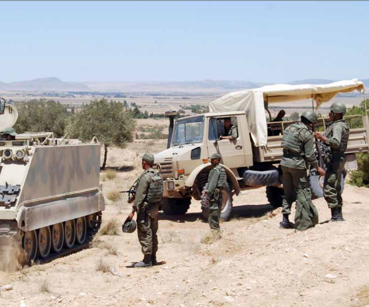
لا يزال الوضع الأمني في جبل الشعانبي التونسي غير مستقر