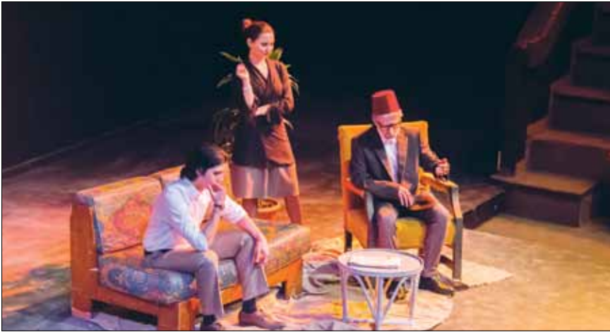
من عرض الافتتاح «فخامة» الرئيس

البنانية، و«حرم معالي الوزير» من «جامعة بيروت العربية». وللمرة الأولى، يغيب «المعهد العالي للفنون المسرحية» في سوريا عن المشاركة في الفعاليات والعروض. كما أنه لا وجود لأعمال تقارب الأحداث الدموية التي تعصف بالمنطقة. قرار شبه جماعي أعلنه طلاب المسرح والفن: «لا للحديث في السياسة، سننقى بعيدين عن أشباح الحرب ومعاناتها التي عاشها أبائنا قبل سنوات طويلة». ربما حضور زياد الرحباني والعمل على إنجاز استقبال يليق بالضيف، يشغل بال الطلبة أكثر من الحرب السورية وتداعياتها وماسيها.