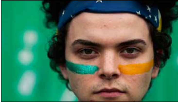
أحد المتظاهرين في مدينة ساو باولو أمس

في أكبر تظاهرات تهرّها منذ 21 عاماً، شهدت البرازيل أمس مسيرات شعبية استمرت لأكثر من سبع ساعات في عدد من المدن ولا سيما في ريو دي جانيرو. وانطلقت التظاهرات التي ضمت حوالي 200 ألف متظاهر بشكل سلمي، في مختلف أنحاء البلاد احتجاجاً على زيادة أسعار النقل العام والنفقات الطائلة التي تصرف تحضيراً لكأس العالم لكرة القدم الذي تستضيفه البرازيل العام المقبل. وشارك في تظاهرة ريو دي جانيرو (وهي الأضخم) حوالي مئة ألف شخص ولكنها تحولت في المساء إلى أعمال شغب وعنف. وهاجم عشرات المتظاهرين برلمان ولاية ريو قبل أن تتمكن شرطة مكافحة الشغب من تفريقها خلال الليل. وقام عناصر القوة الضاربة في الشرطة العسكرية، الذين وصلوا إلى الموقع في أليات مدرعة، بإطلاق القنابل المسيلة للدموع والرصاص المطاطي على مجموعة المهاجمين واعتقلوا عدداً منهم. وألقى المتظاهرون الزجاجات الحارقة والحجارة على المبنى وحاول بعضهم التسلسل من نوافذه. وقام هؤلاء بإحراق سيارة ومستوعبات للنفايات وتحطيم واجهات مصارف وأجهزة الصرف الآلي ونهب متاجر فيما كان متظاهرون آخرون يصيحون بهم «أيها اللصوص! لا نريد أعمال تخريب!». وأصيب