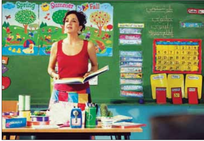
من كليب «يا ولاد» (فادي قاسم)

غدأ، لن يقف شباب المجتمع المدني اللبناني وحدهم أمام مجلس النواب. سننضم إليهم مجموعة من الشخصيات المعروفة من فنانيين وإعلاميين وغيرهم لرفع الصوت عالياً ورفض التمديد للسلطة التشريعية الحالية. قبل سنوات، تحولت تانيا صالح (1969) إلى معلمة في «مدرسة الوطن» التي يرتادها السياسيون اللبنانيون. في كليب أغنية «يا ولاد»، صرخت الفنانة اللبنانية بوجه تلميذها قائلة: «طوشتوني، بكفي بطر، بكفي قرف، بكفي قتال يا ولاد». أما اليوم، فستشارك صالح في التحرك الذي دعا إليه «الحراك المدني للمحاسبة» (تكتل من جمعيات المجتمع المدني) في 20 حزيران (يونيو) الحالي تحت عنوان «رُفعت الجلسة». سيأخذ التحرك شكل جلسة محاسبة لنواب 2009 على ما «أنجزوه» خلال السنوات الأربع الماضية، بدءاً من قانون الانتخاب الذي طال انتظاره ولم يولد، مروراً بحق المرأة بإعطاء الجنسية لأولادها، وصولاً إلى تجريم العنف الأسري. «منكون شعب بلا كرامة إذا منسكت»، تقول صالح لـ «الأخبار»، مضيفة: «ليش بدنا نتركن يمددوا لحالن؟ ليش بدن يقبضوا من جيوبنا وما يعملوا شي؟». وأكدت الفنانة اللبنانية أنه «أن الأوان لنشكل نظاماً ديموقراطياً يكون فيه لبنان دائرة انتخابية واحدة»، موضحة أن مشاركتها هي «فئة خلق». وعن الشباب اللبناني الذي يناضل في سبيل إحداث فرق في التركيبة الحالية، أوضحت