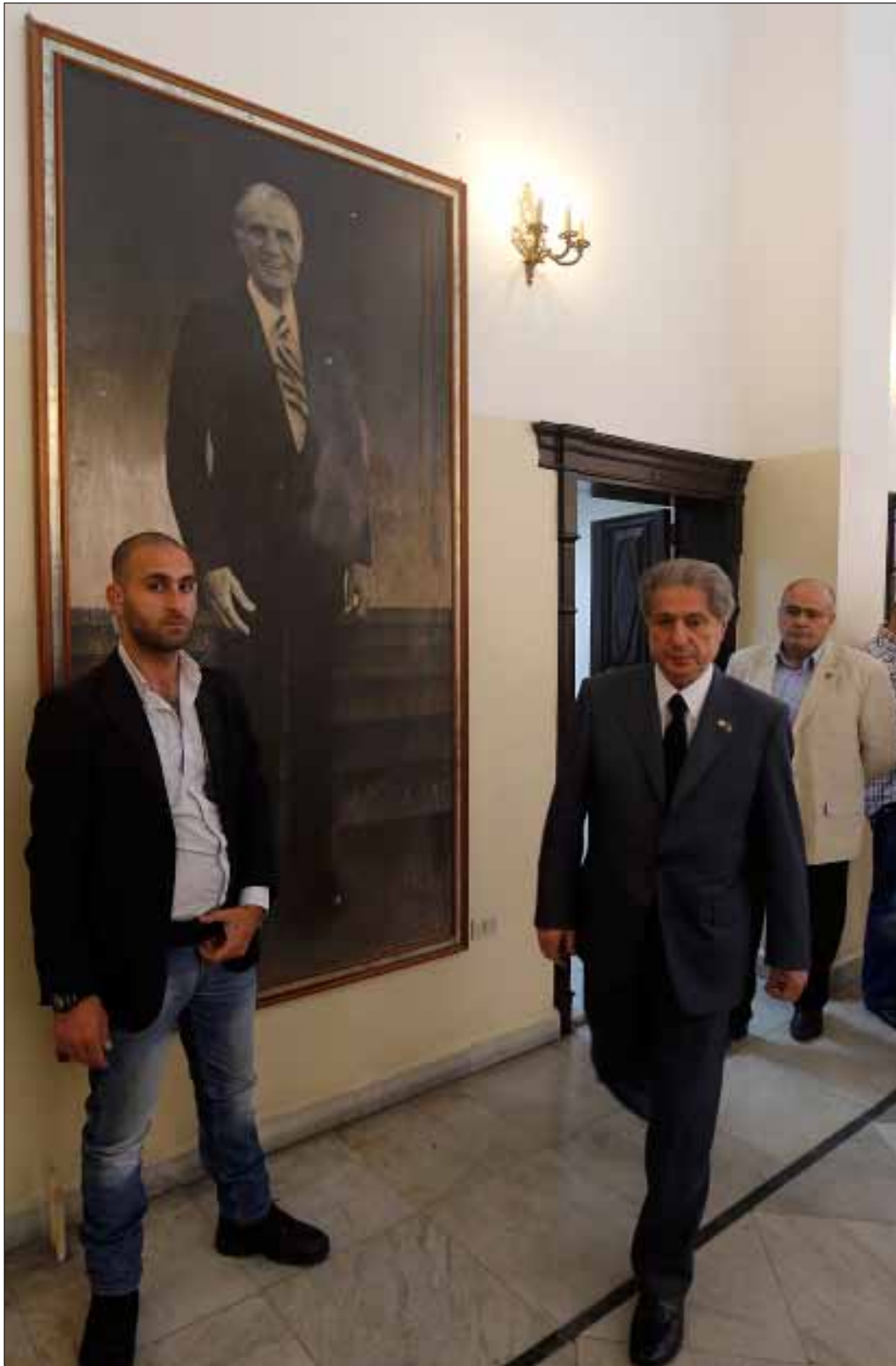
ليس النأي بالنفس الكتائبي عن الأقسام من شيم سامي وحده بل هو من «إنجازات» والده