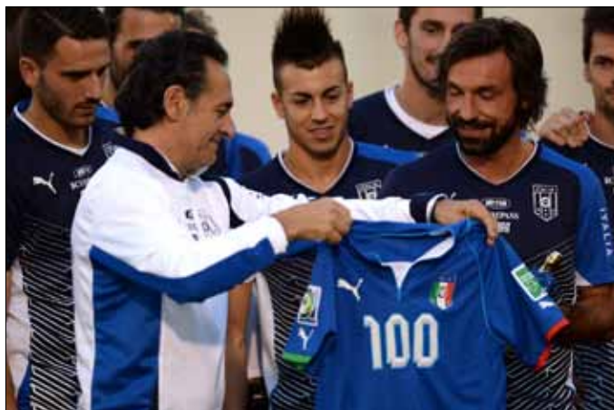
بيرلو يتسلم من برانديلي قميصاً تذكاريًا بمناسبة خوضه مباراته الدولية رقم 100

كما كانت حاله في مبارياته ضمن التصفيات المؤهلة الى موندیال 2014، حيث اكتفى بالتعادل في خمس من مبارياته الست الاخيرة. بدوره، يبدو المنتخب الإيطالي قادراً على حسم تأهله على حساب نظيره الياباني في مباراتهم عند الواحدة من فجر غد الخميس، استناداً الى العرض المميز الذي قدمه في مبارياته مع المكسيك تحديداً في الشوط الأول، وذلك بقيادة «المايسترو» اندريا بيرلو الذي صفت له الجماهير البرازيلية طويلاً الاحد الماضي على ملعب «ماراكانا» الشهير بعد الاداء المذهل الذي قدمه.