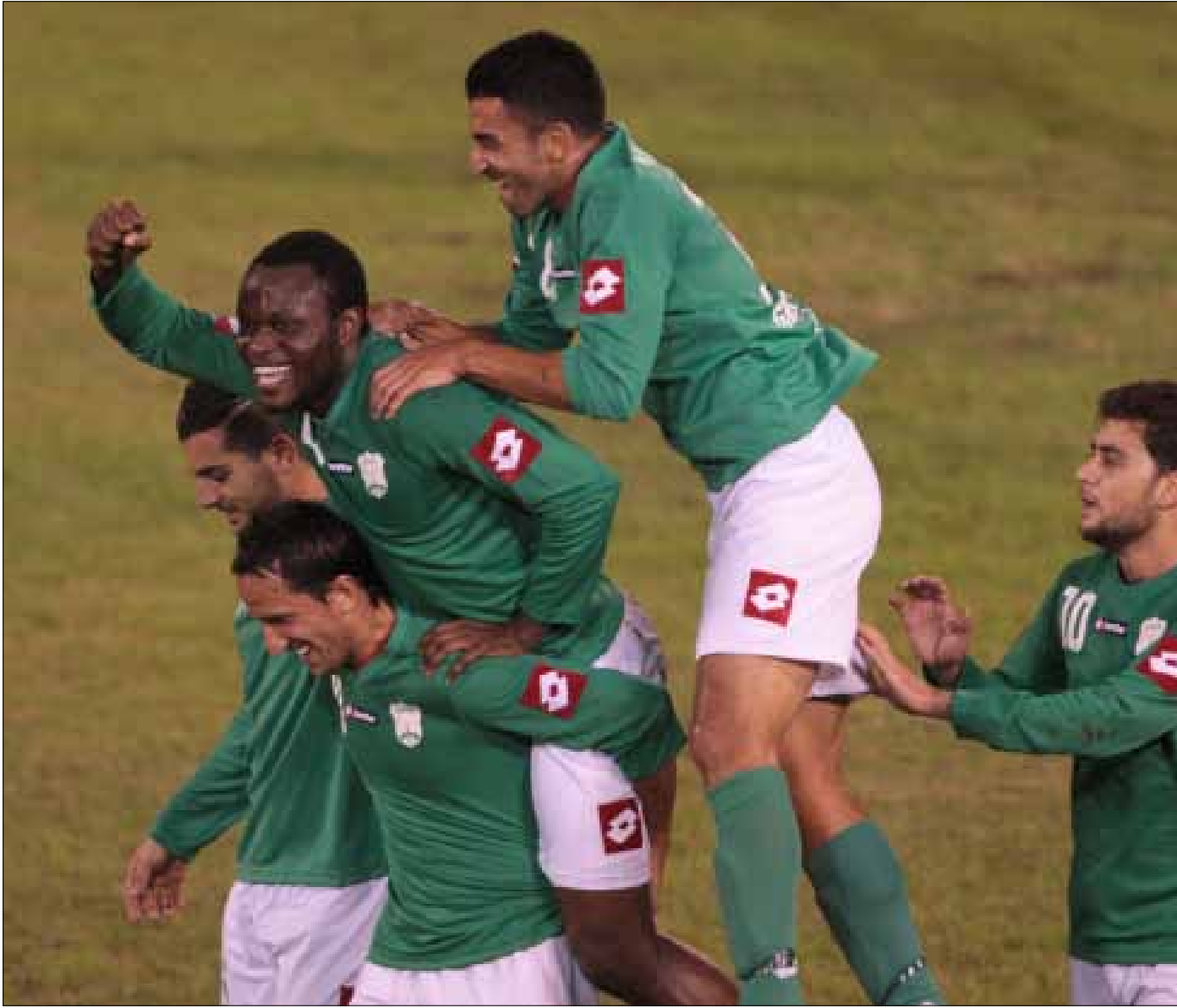
يعتبر الغاني ويسدوم أحد العناصر الرئيسية في المباراة الخارجية

تنطلق اليوم منافسات كأس الاتحاد الآسيوي لكرة القدم بمشاركة لبنانية عبر فريقي الصفاء والأنصار، حيث يلعب الأول في بيروت مع ريغار تاداز الطاجيكي، فيما يعود الثاني إلى الساحة الآسيوية من البوابة العمانية مع فريقها فنجاء في مسقط