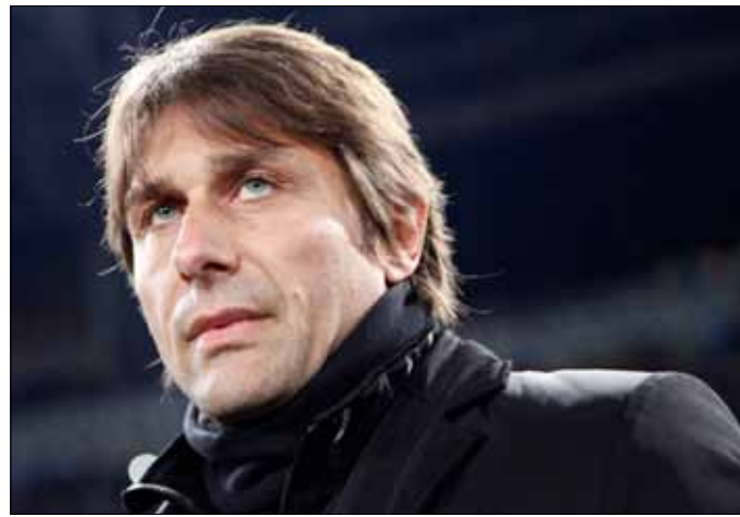
كونتي مرشح لتدريب الموسم المقبل

نهاية الموسم. وأضافت الصحيفة أن كونتي يمكن أن يكون مرشحاً لتدريب ريال مدريد في الموسم المقبل بعد النجاحات التي حققها مع «البيانكونيري» في الدوري الإيطالي، فضلاً عن مشواره في دوري أبطال أوروبا حيث وضع