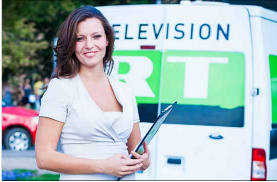
لا تتخطى ميزانية مكتب بيروت 10 آلاف دولار شهرياً

ويعتقد البعض أن مغادرة رئيسة تحرير «روسيا اليوم» العربية تاتيانا ناليتش منصبها تدرج في إطار «حملة التطهير» إذا صح القول، إلا أن تسريبات تناقلتها أوساط الإعلاميين العرب في موسكو أفادت بأن ناليتش ستترأس وكالة أخبار تابعة لقناة «روسيا اليوم». يبقى أن وضع المحطة في موسكو متنازماً أيضاً، وقد صرف قبل فترة أكثر من 60 موظفاً روسياً وعربياً، بالإضافة إلى خفض معاشات البعض. لكن يبقى الحديث أن المكاتب الموزعة في فلسطين والعراق وسوريا ومصر، لا تزال تعمل بنحو طبيعي، فيما يحكى عن عدوى إقفال مكتب العراق لاحقاً... فهل تعود القناة إلى ترتيب بيئتها الداخلي والإطالة بصورة متجددة إلى مشاهديها العرب؟ أم أن إقفال مكتب بيروت هو القرار الأخير؟