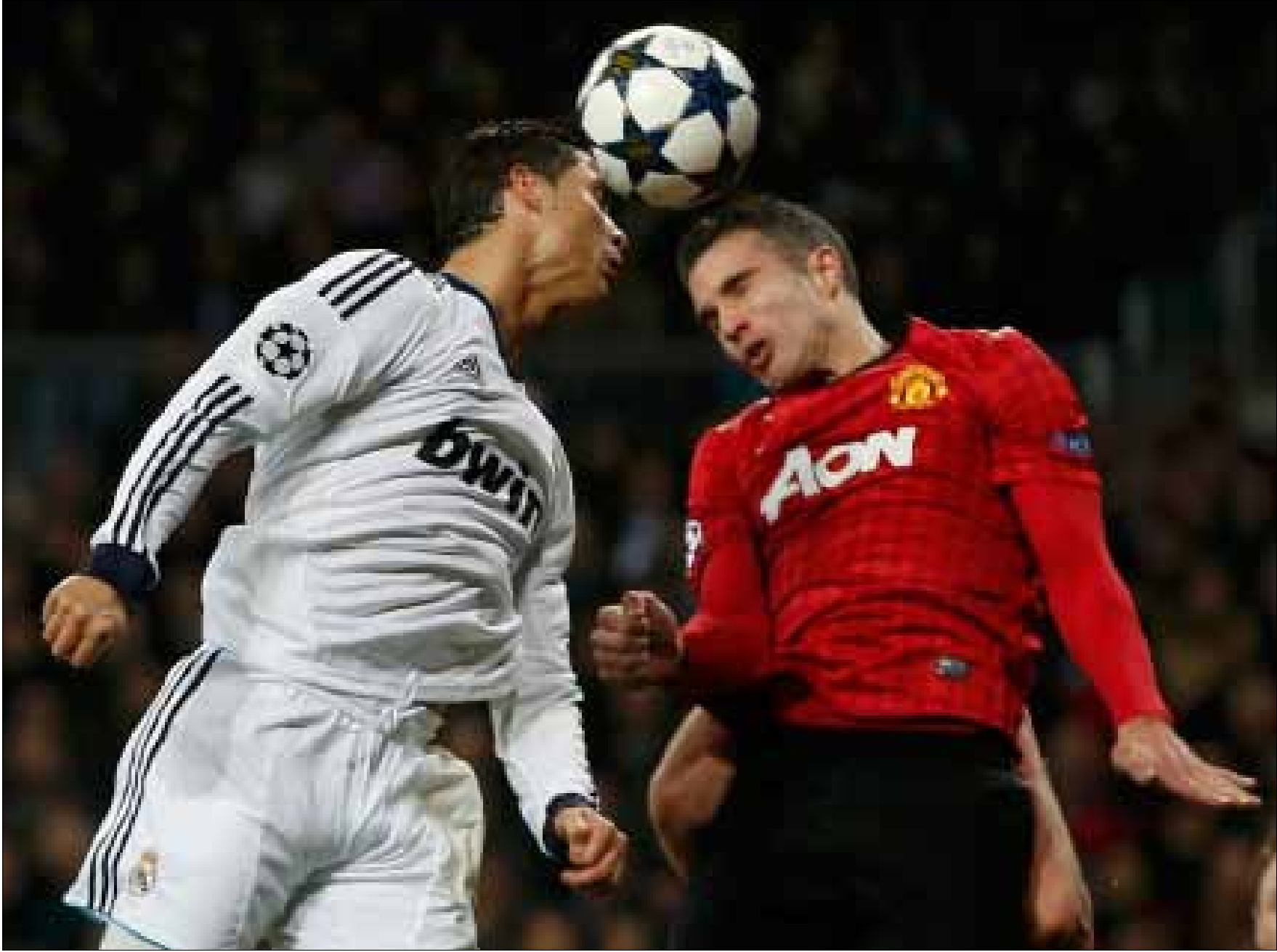
يعود رونالدو الى «أولد ترافورد» للمرة الاولى، ويتواجه مجدداً مع فان بيرسي