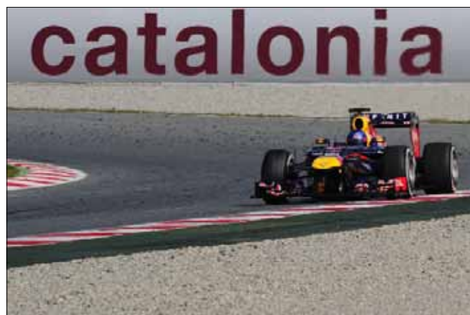
فيتيل خلال التجارب على حلبة كاتالونيا

عانت منها الفرق في التجارب الشتوية، التي اختتمت الأحد، في التعامل مع الإطارات تبقى الباب مفتوحاً أمام جميع الاحتمالات في