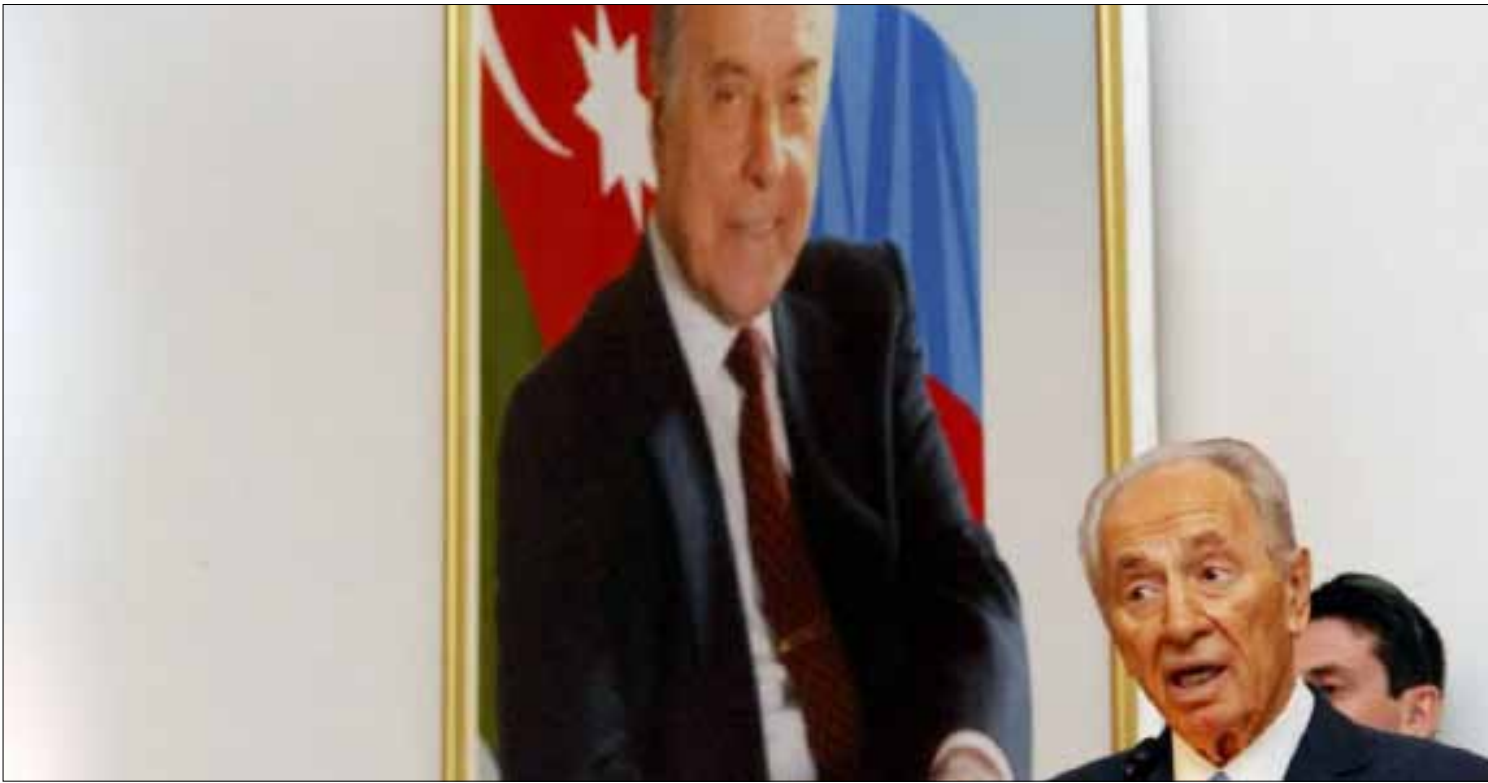
بيريز القى محاضرة في جامعة باكو خلال زيارته أذربيجان في العام 2009

تراهن باكو على تجنيد اللوبي اليهودي الأميركي لمصلحة قضية ناغورنو قره باغ