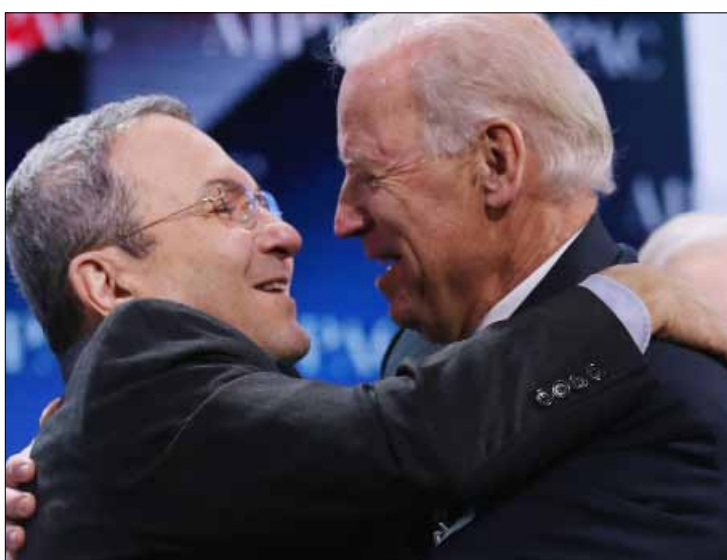
عناق حار بين باين وباراك خلال المؤتمر السنوي لـ «إيباك» أمس

وقال مصدر سياسي إسرائيلي «إذا لاحظ أوباما عدم تعاون إسرائيل ولم تمنحه شيئاً يمكنه من التعامل والعمل معه فسيلاً، بكل بساطة، إلى العمل بمفرده». وأضاف أن طلب أوباما العلني بغير قلق لنتنياهو الشديد، خاصة على خلفية محاولاته تشكيل الحكومة القادمة والعقبات التي سيضعها شريك الائتلاف الرئيسي أمام خطة من هذا النوع.