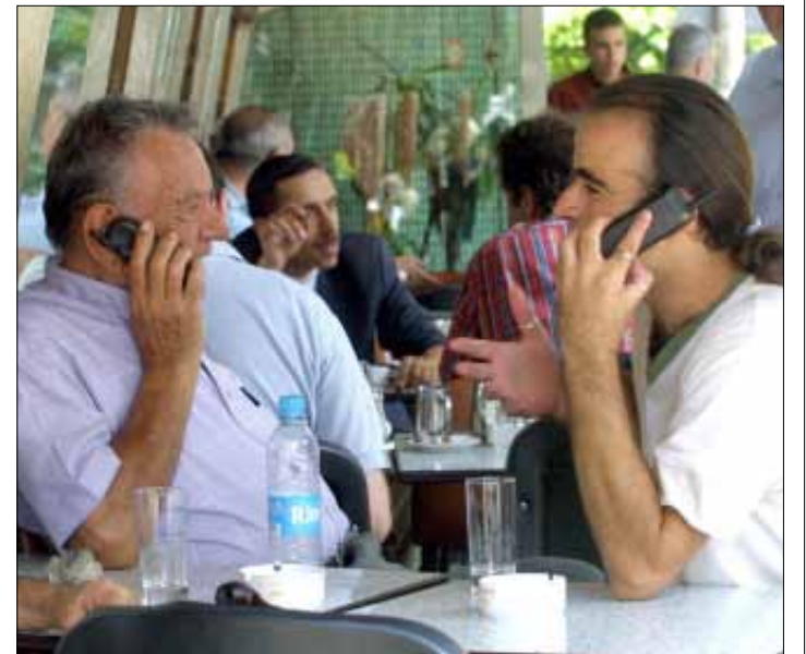
تُحضّر Alfa عرضاً ثانياً بدورها (أرشيف)

التي تستثني، بصيغتها الحالية، شريحة كبيرة من الإعلاميين في البيئة المشروطة نقابياً التي يعيشها القطاع حالياً. فرزمة العرض هي جزء من «العروض المخصصة للنقابات»؛ وهنا المشكلة تحديداً. فنقابة المحررين مثلاً لا تضم