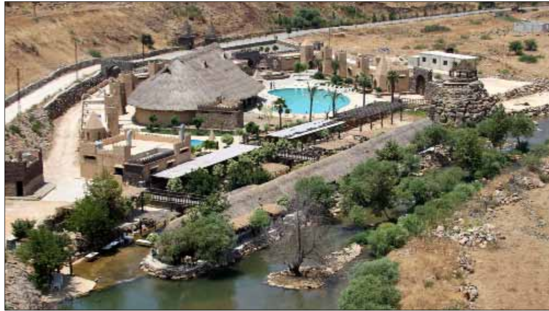
لبنان لم يمانع شق الطريق الإسرائيلية؛ لأنها لا تمس أراضيها

المنتجع على أنه مشروع سياحي ويواظب على رصد الحركة داخله وفي محيطه». مصدر أممي رسمي أوضح لـ «الأخبار» أن الطريق الإسرائيلية لم تنتهك الأراضي اللبنانية حتى الآن. وبحسب الخرائط التي أعطيت لليونيفيل واطلع عليها الجيش، فإنها تجري في الأراضي السورية المحتلة بمحاذاة الحدود. وأكد المصدر أن الجيش يتخذ الإجراءات الدفاعية المناسبة للتصدي لأي خرق محتمل للخط الأزرق. لذا، لبنان لم يمانع شق الطريق إزاء، لبنان لم يمانع شق الطريق الإسرائيلية؛ لأنها لا تمس أراضيها. لكن مصادر معنية احتجت على الطريق