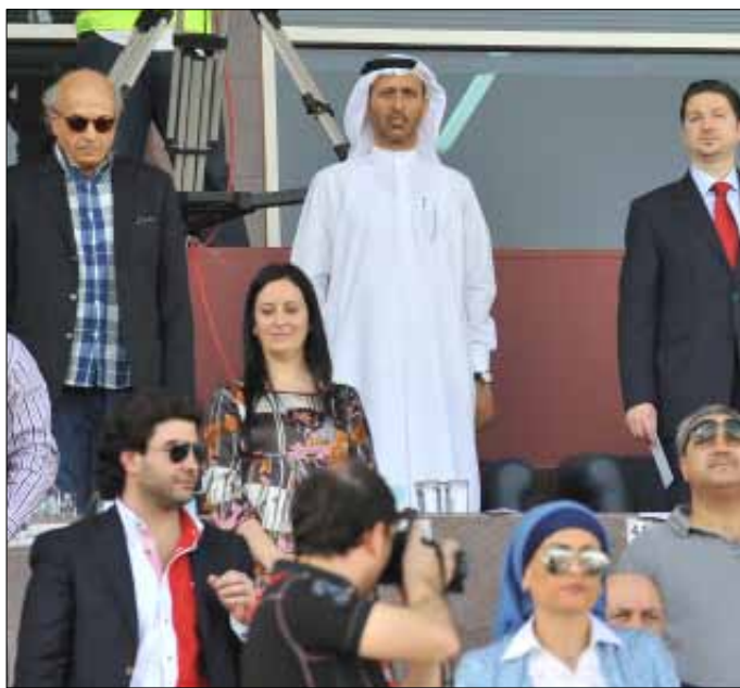
السركال أحد المرشحين الأربعة للانتخابات

من جانبه، أكد المدلج أنه «رشح من قبل الاتحاد السعودي، ولذلك يعتبر مرشح الاتحاد وليس مرشح نفسه»، موضحاً أنه «تلقى اتصالاً من الأمير فيصل بعد لقاء المنتخب السعودي بالمنتخب العراقي في دورة الخليج (أقيمت في كانون الثاني في البحرين)». وتابع «هذا التكليف جاء بعدما فشلت المحاولات في إقناع أحد المرشحين العربيين، وهما: الشيخ سلمان بن إبراهيم آل خليفة