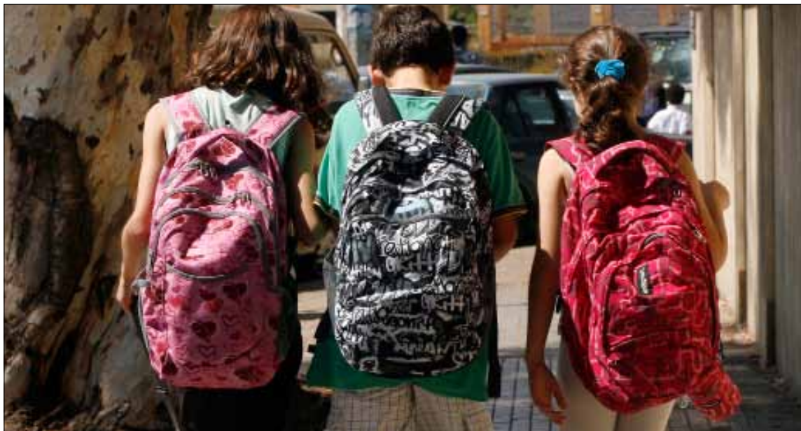
باشرت المدرسة الخاصة مناوراتها وبدأ التهديد بالزودة (ارشييف)

يبقى الطالب، وهو الذي لن يرضى أبداً. فهذا الفرغ بعودته، يحقد على أساتذته الذين حرموه وسحروهم في فترات لاحقة من حقوقهم بطلهم، خصوصاً أن القرار المتخذ «بالتوافق» في بعض المدارس يقضي بأن يمدد العام الدراسي أياماً إضافية من أجل إنهاء البرامج، إضافة إلى الأيام التي يمكن استغلالها الآن، حسب ما يشير بخوس. أما طلاب الشهادات الرسمية، فلن يرضوا على أساتذتهم، ما لم تتغير النتيجة الإيجابية في الامتحان هذه العلاقة.