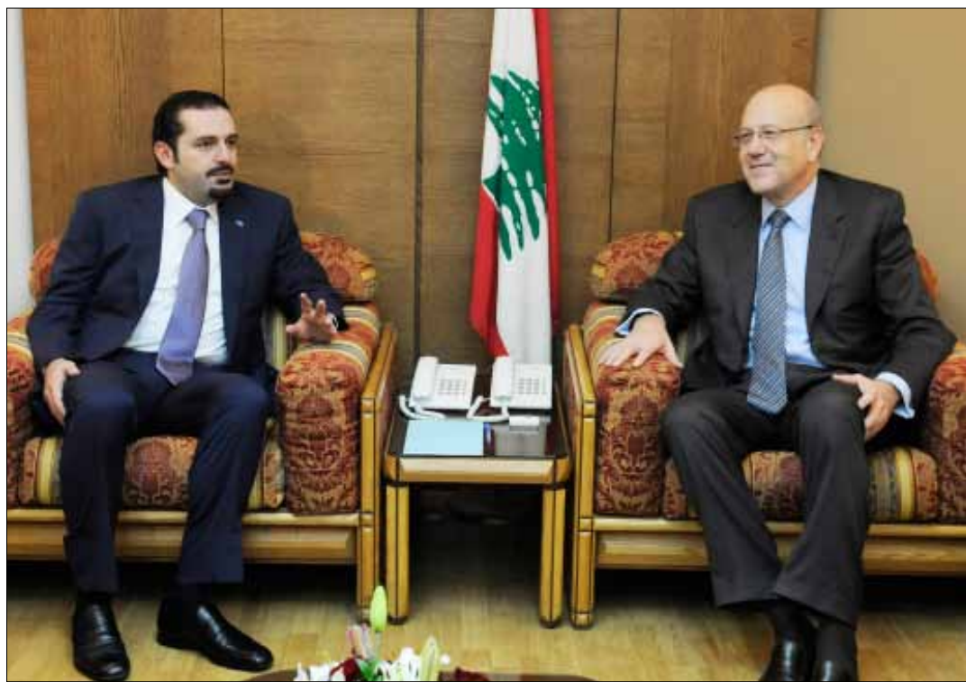
«نجيب يُحاول إدارة البلاد على مسار محايد... وسعد يُقسم وقته بين باريس والرياض» و«ثروتها تزداد! (أرشيف)

14 مليار دولار لستة أشخاص من العائلتين على لائحة «Forbes»