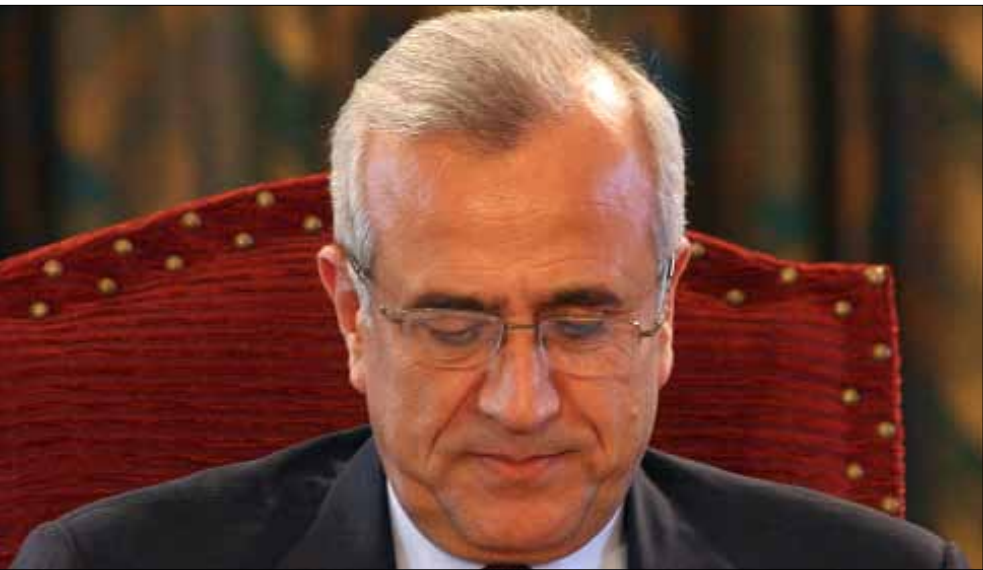
هل أراد البرنامج تقديم ميشال سليمان كنموذج أو قدوة للزعماء الجدد؟ (مروان طحطح)

منها وخصوصاً أن الهواة كانوا وكّن مبرمجين ومبرجات إلى درجة تدفع إلى الملل. أما الحكم زياد بارود فهو سياسي تقليدي بالمعنى المزدوج للكلمة: يسعى جاهداً كي يبقى على علاقة حسنة مع الجميع دون استثناء، وهذه من أسوأ صفات رجل السياسة لأنها صنو النفاق. الزعيم الحقيقي هو الذي لا يتمنّع عن التعبير الحز، حتى لو أدى ذلك إلى خسارة في الشعبية أو التأييد. لكن أين زياد بارود من ذلك؟ أين كانت زعامة بارود عندما أشرف على أسوأ وأفسد انتخابات نيابية في تاريخ لبنان؟ بارود لم يجرؤ على الاعتراض على التدخل غير القانوني للطبيب صفيح قبل ساعات من الاقتراع. لكن ما علينا. الرجل سيستبدل عمّا قريب بإعلاني قوّاتي أدى خدمات جلى لـ 14 آذار وللجيش الأميركي في العراق من خلال حملات إعلانية لم تؤدّ إلى زيادة شعبية الاحتلال في العراق. أما المنافسة، فلم تكن مجدبة لأن الأداء كان مُبرمجاً ومحفوظاً إلى درجة زادت من التشابه في المثالية بين المتبارين والمتباريات. لم يكن من الأفضل لو أنّ «الجديد» طلقت من الأحزاب السياسية السائدة في لبنان إرسال ممثل (أو