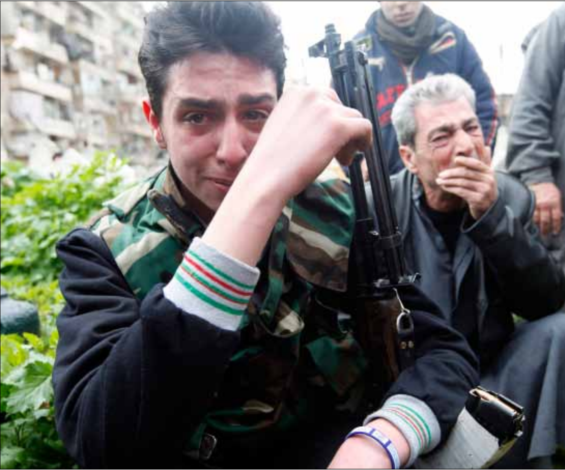
خلال تشييع احد عناصر «الجيش الحر» في حي بستان القصر في حلب أمس

في الميدان السوري المشتعل، الاشتباكات الضارية تتابع، وتعمل المعارضة المسلحة على اختراق الطوق الأمني الذي تفرضه السلطات حول مدينة دمشق، بقصد إحداث ثغرة تمكن المعارضة