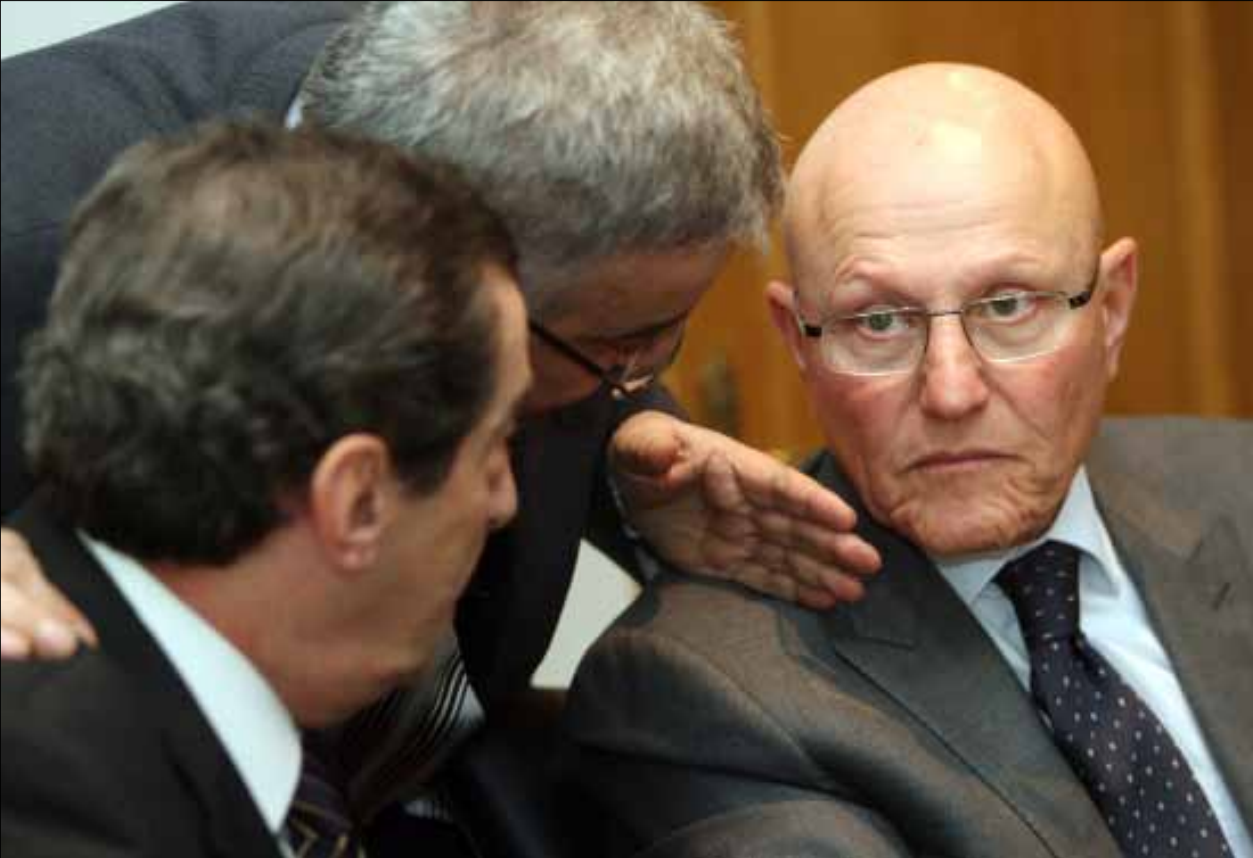
لم تفهم غاية المشرع من تمييز المواطنين المنتمين إلى الطائفة الإسماعيلية واليهودية عن سائر المواطنين (أرشيف)

قانون «الستين» والقوانين السابقة هي التي هدّدت السلم الأهلي وألحقت غيباً تمثيلاً بمجموعات كثيرة من اللبنانيين، لا اقتراح اللقاء الأرثوذكسي. قانون «الستين» والقوانين التي سبقته أجمت الطائفية وأنتجت هذه الطبقة السياسية وأتاحت لتيار المستقبل التفتت من كل حسيب ورفيق، لا اقتراح اللقاء الأرثوذكسي. المآخذ الجديدة على اقتراح إيلي الفرزلي في مكان آخر