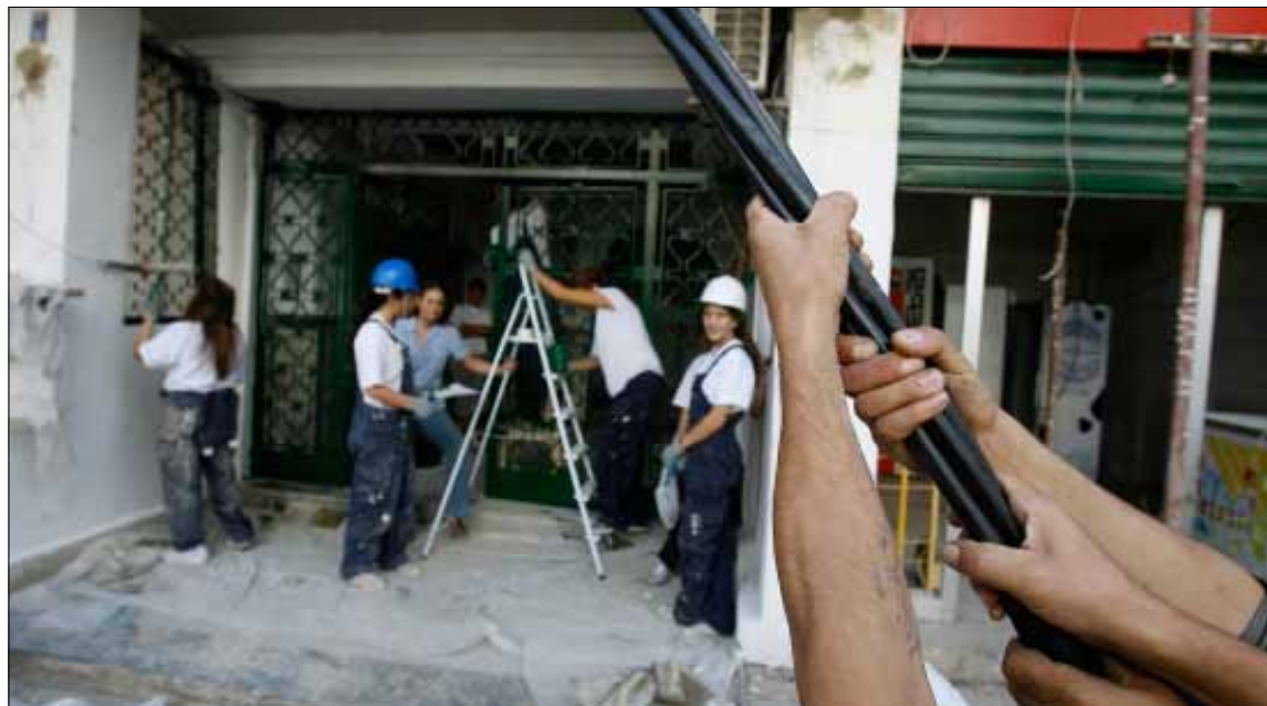
قيمة مرسوم دفع التعويضات 5 مليارات و200 مليون ل.ل.

ب 5 آلاف على أيام التسعينات»، يقول صافي. وهذا ما يقوله الحاج أيضاً. لكن ما يقوله بشير هو العكس «فكل واحد سيأخذ حقّه، وليس هناك معيار، وما يتم تقديره هو وفقاً للأسعار الراجحة، غير أن المشكلة أننا نعيش على الدعاية». وإن يرفض الأهالي التعليق على عبارة العيش على الدعاية، منتظرين وصول الأموال لتقدير الأمر، إلا أنهم يصرون على أن القيمة مهما تكن عالية «لن تكون على قدر ما خسرنها وإلا ما استدنّا»، يتابع صافي. في جعبة الأخير تأكيد على هذا الأمر «وهو أن الجيش أجرى كشفه الميداني في البيوت في غياب أصحابها»، وهذا ما تؤكد أيضاً تيريز حبيب وعبدو