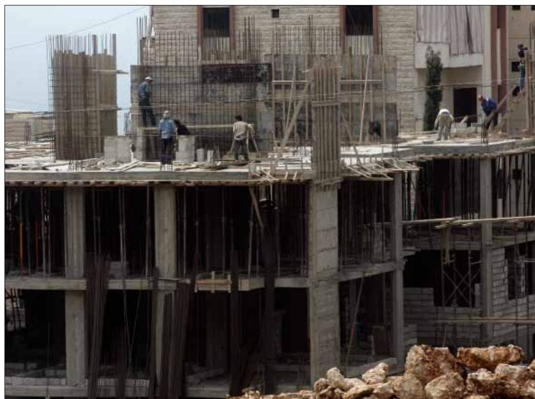
ما تحضله الخزينة من القطاع يقتصر على رسم التسجيل البالغ 6% وعلى رسوم يسدها المطورون لفرز الأراضي والرخص (مروان طحطح)

يُشير التاجر العقاري المخضرم إلى أن معظم حائزي رخص البناء الحديثة في المناطق الأولى في بيروت - على الخطوط البحرية الأولى والثانية