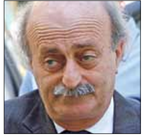
كسر الأعراف في مزرعة الشوف

لتنجح في السياسية بحسب الدرس الأول في المدرسة الحزبية لا بد من أن نعتبر من يذكرك بدبكة والسك في احتفالات المبايعة السورية، بالوطنية والاستقلالية وغيرهما. وتنتهم وأنت نائب في كتلة المستقبل النيابية خصمك بـ«استعمال المال على نحو كامل». وتدافع عن سلاح حلفائك الجدد وتنتقد سلاح حزب الله. وبدل الاستفادة من تحييد ملف أرض تتهب بالتوسط في عملية بيعها عن المزادات الانتخابية، يُشهر شقيقك فايسبوكياً بالملكف استعادة أرض بحجة عدم قيامه بواجباته على أكمل وجه لاستعادتها. ويبلغ الطلاق مع الحياء في تلك المدرسة ذروته عشية الانتخابات، فتتصل بمن لا تعرفهم أو لا تعرف عنهم أكثر من أنهم ضدك لنظائهم بانتخاب لا تحب، على غرار موظف في جهاز حراسة مقر العماد ميشال عون في الرابية،