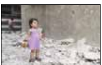
الجيم السوري 3/9 - 4:30 مساءً