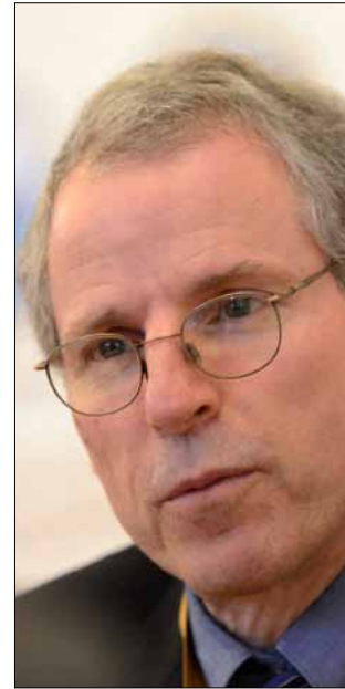
السفير فورد

ماذا يقول السفير الأميركي روبرت فورد عن حقيقة الموقف الأميركي المضمحل حيال سوريا. «الأخبار» اطلعت على مضمون كلام خاص له في هذا المجال، هدفه إيضاح أن موقف واشنطن لم ولن يتغير من قضية المطالبة الرئيس بشار الأسد بالرحيل