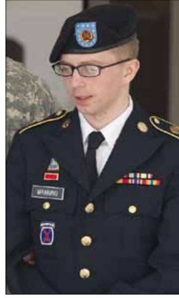
الوثائق التي سربتها هي أهم وثائق في تاريخنا الحالي

بلاده ومسؤوليه وزملائه وأهله ورفاق السلاح، وهو مدرك أن العقاب سيكون مرّاً. فسحة أملة الوحيدة، كما قال، كانت «أن يفتح نقاش داخلي واسع حول دور