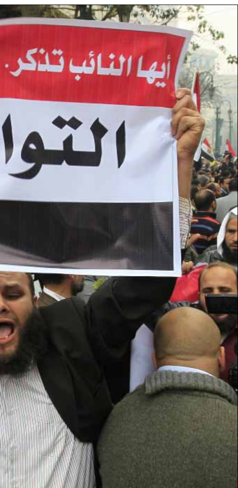
مناصرون لحزب النور السلفي (أرشيف - أ ف ب)

على أنه نذ للإخوان بدءاً من الانتخابات البرلمانية السابقة، فغامر بنزوله منفرداً على رأس قائمة ضمت إليه الأحزاب السلفية، وابتعد عن التحالف مع الإخوان، الجماعة الأقوى والأكثر خبرة وتنظيماً. وفي الانتخابات الرئاسية أيضاً لم يؤيد «النور» مرشح الجماعة في الجولة الأولى، وأيد القيادي المنشق عن الإخوان المسلمين الدكتور عبد المنعم أبو الفتوح ويرى غازي أن حزب النور لا يمكن وصفه بالأحزاب الموالية للإخوان وإن اقترب منها في بعض المواقف السياسية انطلاقاً من القرب الإيديولوجي والتمسك بالشرعية الانتخابية. وقال «لعل الظروف السياسية وحالة الاستقطاب السياسي والإيديولوجي تشكل عاملاً مهماً في اختفاء الكثير من التباينات السياسية أو تجميدها على الأقل في الوقت الراهن».