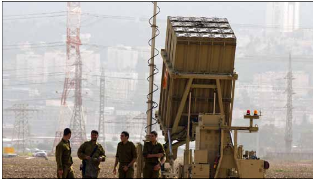
جنود للاحتلال بالقرب من قبة حديدية في حيفا قبل يومين

وكانت إسرائيل قد خضعت لجلسة أولى من المراجعة الدورية الشاملة في عام 2008 لكنها لم تلتزم إلا بعدد قليل من التوصيات التي قدّمت إليها.