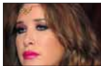
... ودوري عند منى 21:30 ■ MTV