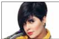
شمس سطعت على رابعة 20:40 ■ «الجديد»