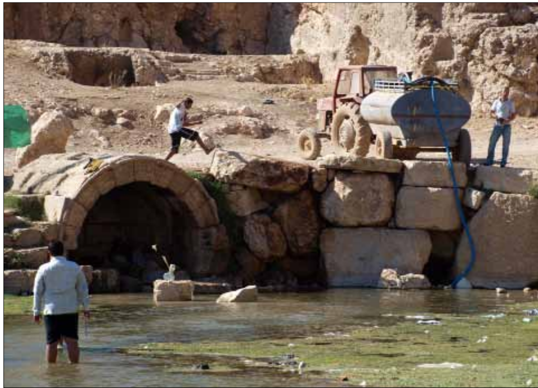
«حوش باي» ليس المعلم الأثري الوحيد في بلدة طاريا، بل هناك مغارات عذبة