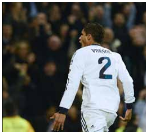
فارار محتفلاً بتسجيله هدف التعادل

تعادل ريال مدريد وضيفه برشلونة 1-1 في «كلاسيكو» ذهاب نصف نهائي كأس اسبانيا الذي اتسم بالندية والأثارة، في وقت وسّع فيه مانشستر يونايتد الفارق في صدارة الدوري الإنكليزي الممتاز