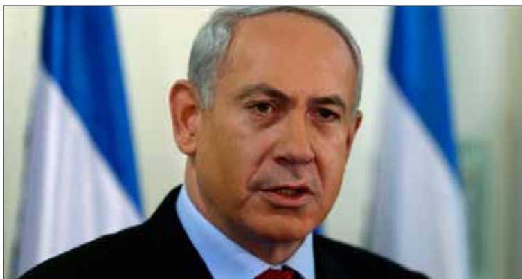
نتنياهو يعول على التدخل الأميركي

وبحسب «معاريف»، برزت نزعة الشك، التي ظهرت في تصريحات نتنياهو حول استعداد أميركي لوقف إيران بالقوة العسكرية، مرة أخرى على خلفية المصادقة المرتقبة على تعيين تشاك هاغل هذا الأسبوع في منصب وزير الدفاع الأميركي. ويبدو أن نتنياهو قرر، انطلاقاً من ذلك، إعادة