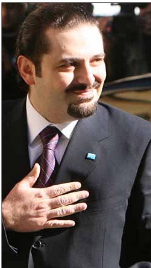
حين طلبت معراب «تشكيل» نواب زحلة إليها أوعز الحريري فوراً إلى رفاق عقاب صفر للالتحاق

تبقى أبعاد ما يحصل، والقراءة الأكثر بعداً لأزمة «الأرثوذكسي» بين الرجلين الحليفين. يقول المستقلون إنهم يدابون على ترميم ما تهدم. لكن في محيط سعد من يقول له: انش موضوع القانون، وانس الانتخابات. المسألة أكبر وأعمق. يحاولون إقناعه بأن شيئاً ما تغير لدى جعجع في السياسة وفي الأساس. ولأن سعد لا ذكرا له حيال مرحلة الطائف، ثمة من يتطوع يقول له: لقد فعلها من قبل مع والدك. كان شريكاً له في إقرار الطائف منذ اللحظة الأولى سنة 1989. لكنه بعدما قدموا له رأس ميشال عون راح «يمتنع». اللعبة نفسها يكرها الآن معك. يومها قال له أحدهم إنك دخلت الطائف في التوقيت الخاطئ وتخرج منه في التوقيت الخاطئ أيضاً. ما سيجعلك تدفع ثمنه مرتين. اليوم يحاول أن يلعبها بشكل آمن، فلا يدفع أي ثمن، لكنه يريدك أنت يا شيخ أن تدفع أثمانه، كما اعتدت منذ ثمانية أعوام... وهناك في محيط سعد من يقول