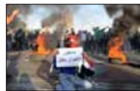
من يوقف نرف المحروسة؟ 21:00 ■ «المنار»