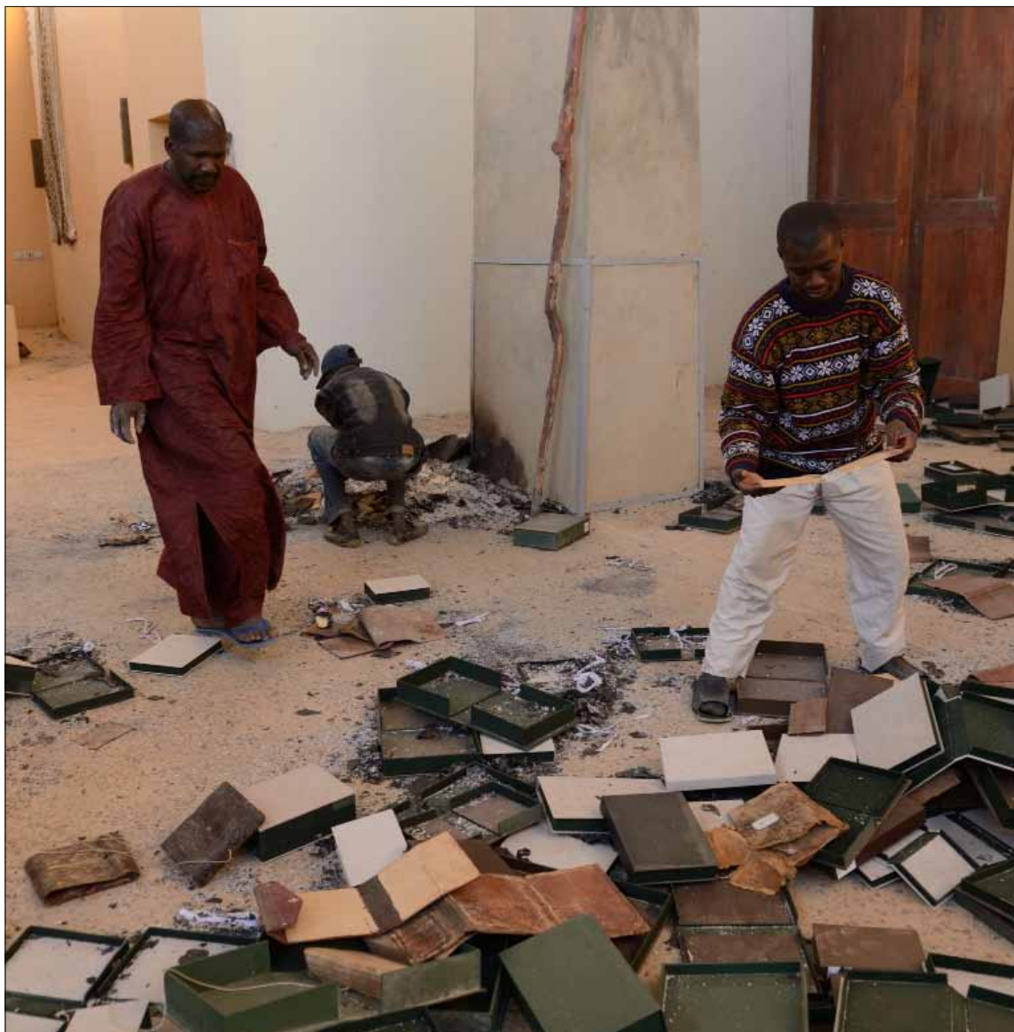
من آثار الدمار الذي لحق بالمكتبة

ونقلت صحيفة «ديلي تلغراف» البريطانية أن كبار الشخصيات العسكرية والنواب من فريق الموالاة والمعارضة في بريطانيا شددوا، خلال مناقشة عاجلة لقرار الحكومة، على وجود مخاوف من صراع طويل في شمال أفريقيا يشبه الحرب في أفغانستان وفيتنام، فيما شدد وزير الدفاع البريطاني فيليب هاموند على أن بريطانيا لديها «واجب حتمي» للتدخل ضد الإرهابيين، معترفاً بوجود خطر في المهمة. وأوضح هاموند أن المملكة المتحدة لديها مصلحة في استقرار مالي وتأمين أراضيها لكي لا تصبح مساحة متاحة لتنظيم القاعدة لتنظيم هجمات ضد الغرب.