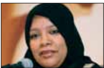
لينا حكيت صالحة 21:00 ■ «أبو ظبي الإمارات»