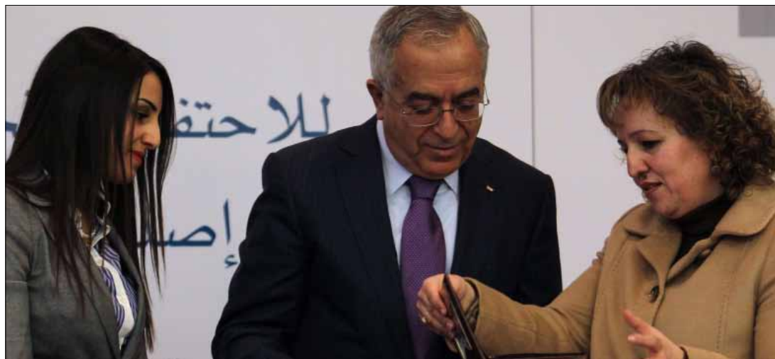
سلام فياض خلال إزاحة الستار عن طابع بريدي يحمل اسم دولة فلسطين في رام الله أول من أمس

وكانت الحكومة الإسرائيلية قد علقت تحويل المستحقات الضريبية إلى السلطة الفلسطينية قبل نحو شهرين، وذلك رداً على توجه السلطة الفلسطينية إلى الأمم المتحدة، لرفع مكانتها في