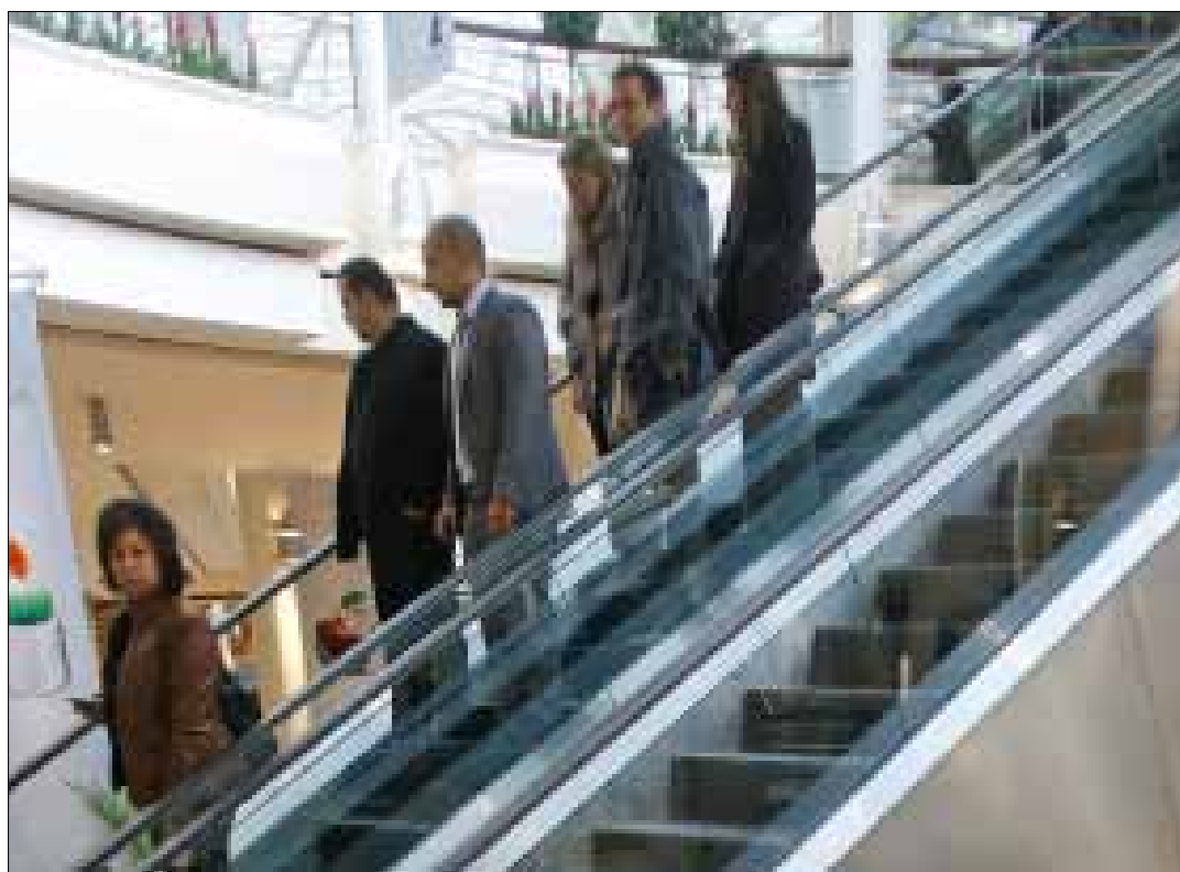
الواردات تكشف عورات النظام الاقتصادي والاجتماعي

النفط وسلم الرفاهية والغذاء تسيطر على الواردات