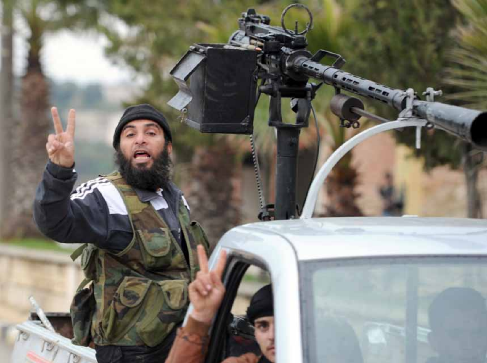
سوريا ربطت بين الغارة والهجمات الفاشلة للمعارضة على المنشأة ذاتها (أ ف ب)

مع اقتراب الذكرى الثانية لاندلاع الأزمة السورية، قررت إسرائيل الانخراط علناً في معركة إسقاط نظام الرئيس بشار الأسد. غارة يتيمة استهدفت منشأة عسكرية للبحوث العلمية، لكن دلالاتها والأسئلة التي خلفتها وإمكانات الرد عليها وحجمه، فتحت صفحة جديدة لا شك في أن ملامحها وآلياتها ستكون مختلفة عن كل ما سبق