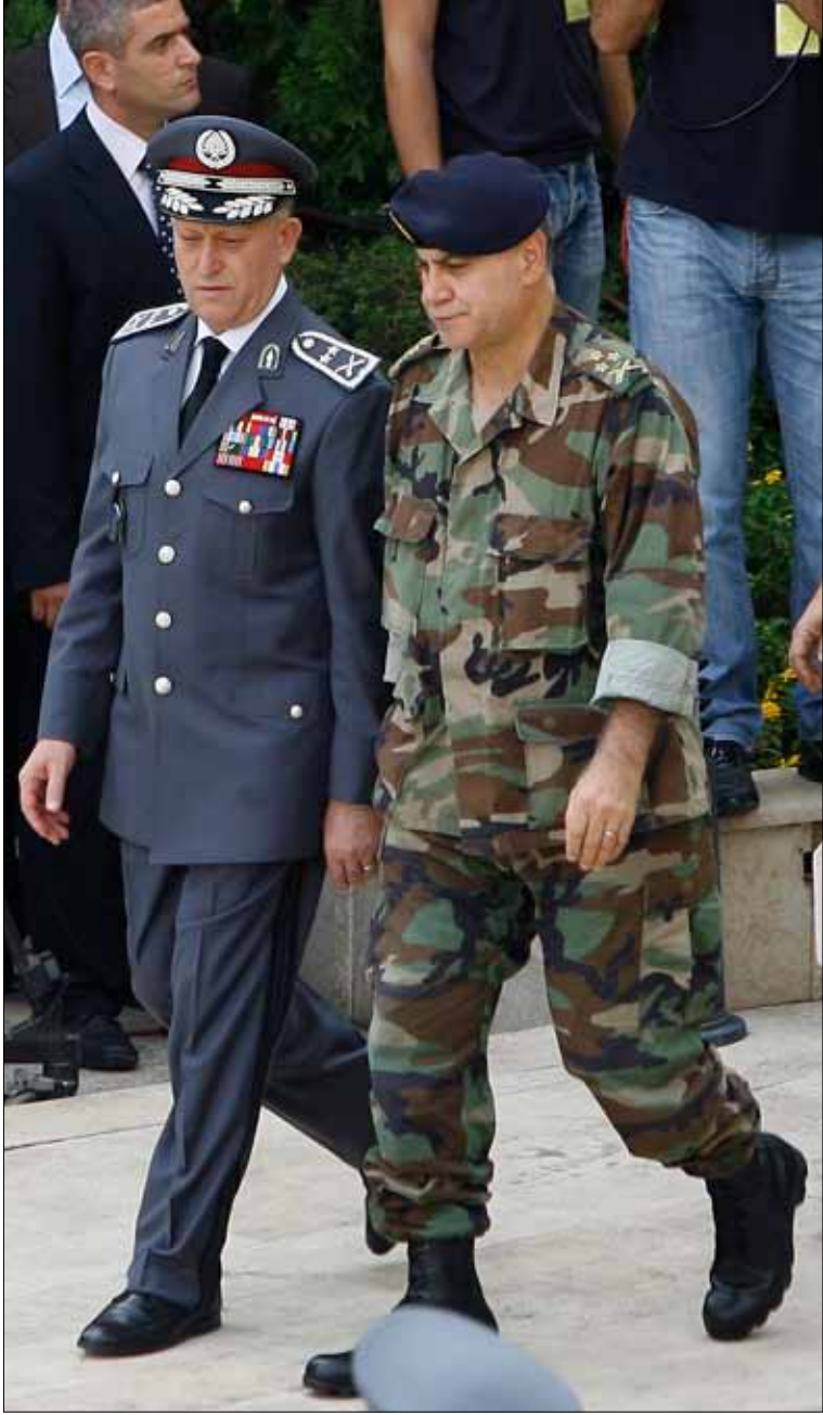
يحرص الجيش على حسن التعاون مع المخابرات الفرنسية في إطار مكافحة الإرهاب

مع زواره من دبلوماسيين وممثلين عسكريين، أو خلال زيارته الرسمية وأخرها لبريطانيا.