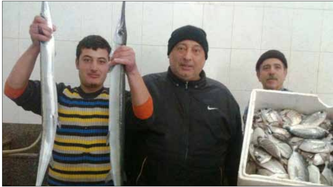
مطالبة باستيراد كميات محددة من السمك (الأخبار)

يتجاوز عكرة هذه النقطة إلى أخرى، فيشير إلى مطلب آخر يعرضه على أنه اقتراح متمنياً على وزير الزراعة حسين الحاج حسن أن يتبناه، وهو «فرض مبلغ مقطوع قدره 500 ليرة لبنانية على كل كيلو سمك مستورد، على أن يخصص هذا المبلغ للصيادين كي يستفيدوا منه في مجال الضمان