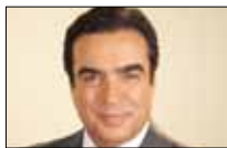
فرداجي عوني ونص 20:30 ■ OTV