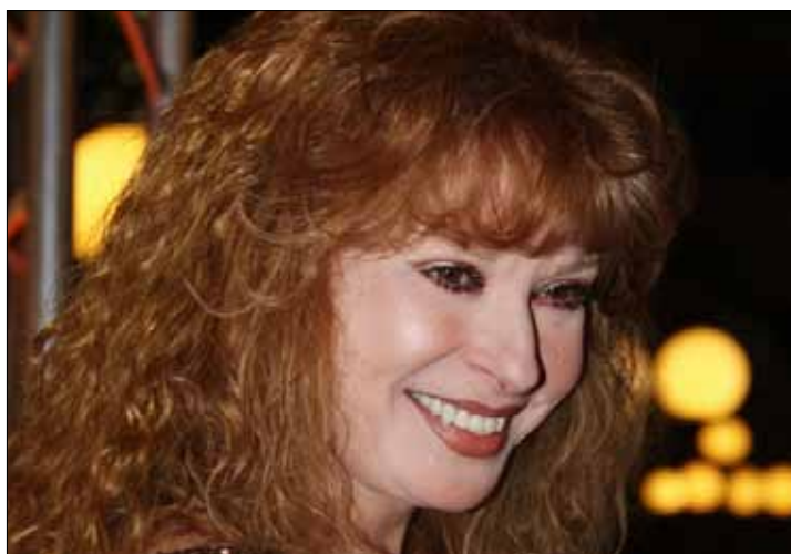
منع فيلم نيللي على متن «مصر للطيران»

صهر الرئيس محمد مرسي انزعج من شريط كان يعرض على متن رحلة تابعة لـ«شركة مصر للطيران»، فطلب وقفه. «جبهة الإبداع المصري» أصدرت أخيراً بياناً تطالب فيه شركات الإنتاج بعدم بيع حقوق عرض الأفلام لشركة الطيران الحكومية