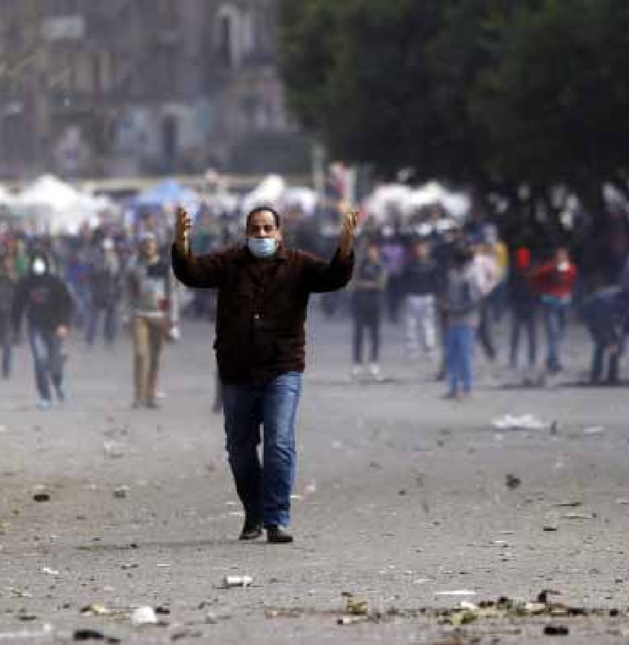
فشلت أمس المبادرات لوقف الاشتباكات في ميدان سيمون بوليفار في القاهرة