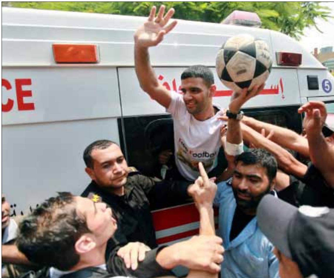
السرسك عند وصوله الى غزة أمس

قالت أم عبد العزيز ودموع الفرح في عينيها: «فرحتي لا توصف ولا يمكن تخيلها، فعودة الحياة لجسد ظن أنه مات لا يستطيع أحد التعبير عنها، وهذه حالنا نحن أمهات الأسرى، خاصة حين نحرم منهم لأعوام وأعوام». وأضافت «ابني صمد وقاوم، حتى بعدما انهارت صحته ودخل مرحلة الخطر رفض أن يساوم أو يتنازل عن حقه بالحرية لأن اعتقاله ظالم». وتابعت «منذ صغره كان حلمه أن يمثل فلسطين في ملاعب