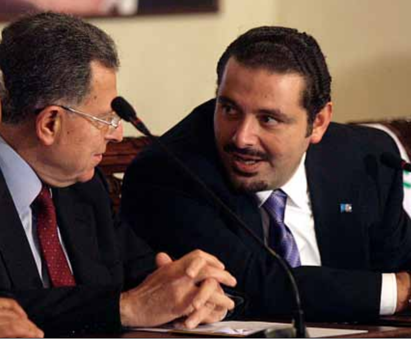
النظرة السنية إلى الجيش لم تعد هي نفسها

انتقاصاً من دور نواب التيار المعروفين بمواقفهم المعتدلة وبحرصهم على بقاء سلطة الدولة، لكن ذلك يعني أن مشروع «المستقبل» كمشروع سني «معتدل»، بات عرضة للاهتزاز في ضوء المزايادات التي تحكم الشارع السني العكاري والطرابلسي. لذا، يصبح الناخبان معين المرعبي وخالد ضاهر ناطقين باسم الشريحة الكبرى من سنة الشمال، أخذين معهما مشروع «المستقبل» الأساسي ونوابه المعتدلين رهينة حتى الانتخابات النيابية المقبلة، إلى الحد الذي لم يعد المستقبل قادراً على التبرؤ من أي خطأ يرتكبه النائبان المذكوران. وتكاد المشكلة تكون أكثر فداحة مع النواب المسيحيين من تيار «المستقبل» أو المواليين له. ومشكلة هؤلاء أنهم