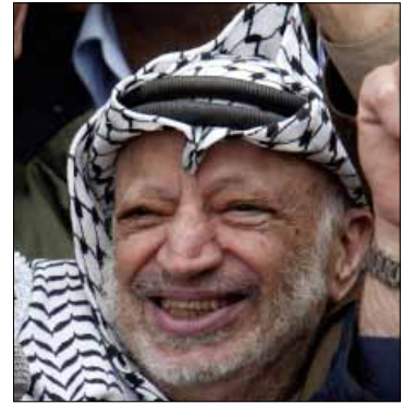
الزعيم الفلسطيني الراحل يخاطب مناصريه في رام الله عام 2004

يصل الى رام الله اليوم، رئيس اللجنة الطبية للتحقيق في ظروف اغتيال الزعيم الفلسطيني ياسر عرفات من أجل فحص عينه من رفات الأخير للتأكد مما إذا كانت تحمل آثار مادة البولونيوم