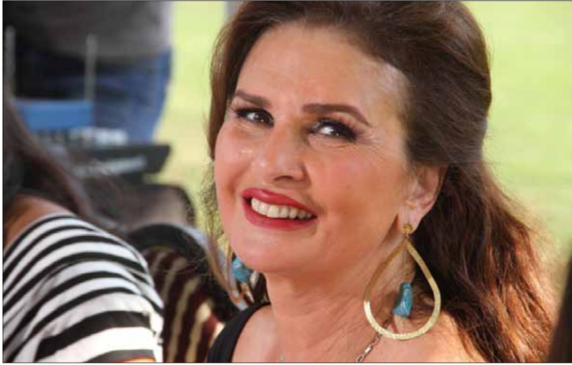
تشرع يسرا في تصوير فيلم جديد بعد إجازة عيد الفطر (شريف عبد ربه)

وتشرح أن الشخصية التي تجسدها في العمل أرهاقتها جداً، فـ«شربات (اسم الشخصية) سيدة في العقد الرابع من عمرها، تعمل خياطة ولديها شقيقان، وتزوجت ثلاث مرات، ولم تنجح تجاربها مع شركائها، ثم تبدأ رحلتها في الصعود نحو الثراء». تنفي صاحبة «قضية رأي عام» أن تكون شخصية شربات قريبة من شخصية نادية أنزحة، التي قدمتها قبل سنوات في مسلسل «أحلام عادية»، مع أنها تشعر ببعض التقارب بينها وبين شربات، فكلتاها تحب الخير لمن هم حولهما، وتتحملان الكثير من المشاكل بكتمان. وهنا دافعت عن اختيارها الفنان الكوميدي سمير غانم ليشاركها بطولة المسلسل رغم تراجع أسهمه في التلفزيون والسينما خلال السنوات الأخيرة. وأكدت أنه سيكون مفاجأة للجماهير من خلال شخصية حكيم، التي يؤديها في «شربات لوز»، الذي سيرعرض على قنوات «أبو ظبي الأولى»