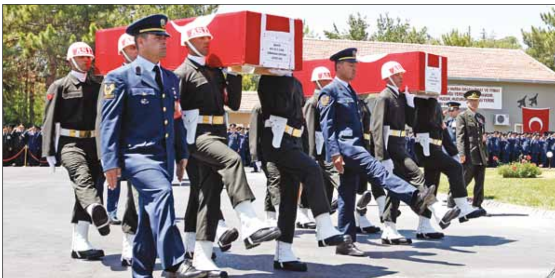
من تشييع الطيارين التركيين يوم الجمعة الماضي

من ذلك لشرح أين أصيبت وكيف»، وأشار زيريك إلى أنه تحدث مع بعض الدبلوماسيين الغربيين الذين لا يفهمون سبب إصرار تركيا على روايتها بأن الطائرة أصيبت بصاروخ في الأجواء الدولية. وأضاف الكاتب أنه تحدث مع بعض المسؤولين في حزب «الحرية والعدالة» الحاكم، وقالوا له إنهم توصلوا إلى هذه الرواية بناءً على معلومات أعطتهم إياها المؤسسة العسكرية. وبحسب الكاتب التركي، فإن أنقرة اليوم تستعد لعرض روايتها الآتية: إن الطائرة أسقطها السوريون من دون إنذار، وهذا انتهاك للقانون الدولي.