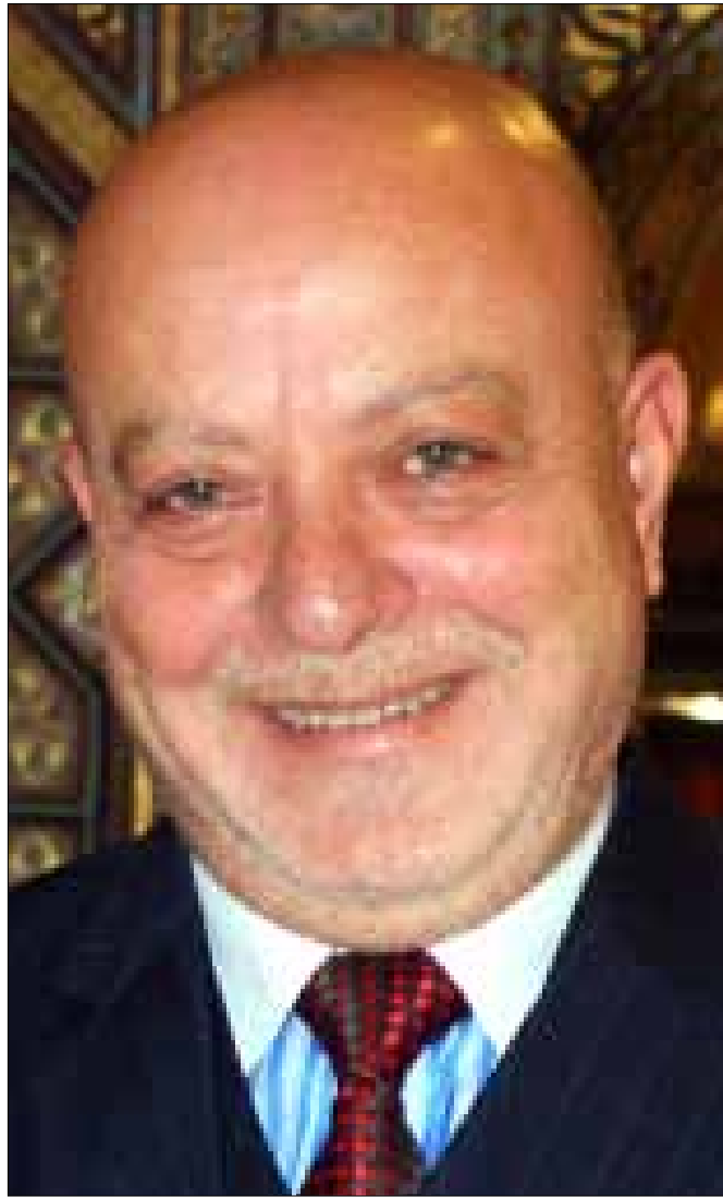
الشعار اعتبر أن إدارة هذه المرحلة الاستثنائية تتطلب آليات وحلولاً استثنائية

الاستثنائية التي نعيشها والتي تتطلب آليات وحلولاً استثنائية.