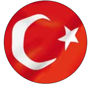
يحلو لبعض الصحافيين الأتراك إطلاق لقب «السلطان العثماني» على رجب طيب أردوغان (أدم الطان - أ ف ب)

النغمة الدارجة منذ صعود النفوذ التركي في المنطقة مع وصول حزب «العدالة والتنمية» إلى السلطة، هي التغني بأمجاد السلطنة العثمانية واستعادة دورها، ولا سيما في ظل ربيع الثورات العربية، كي تكون القوة السنية المناوئة لأمجاد الإمبراطورية الفارسية، المتمثلة اليوم بإيران الشيعية. لكن على من يستجدي أمجاد السلطنة العثمانية أن يدرك أن تاريخها مليء بالجرائم العائلية التي تقشعر لها الأبدان