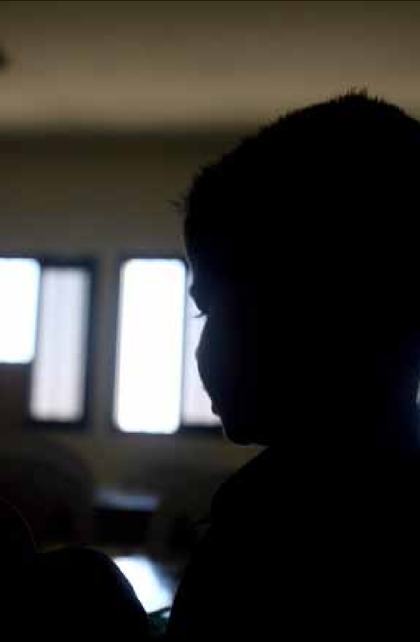
طفل من سبعة يتعرّض للتحرش الجنسي في أماكن يفترض أنها آمنة (مروان طحطج)

أصدر قاضي التحقيق في جبل لبنان، إيلي الحلو، قراراً ظنياً في جريمة التحرش بفتيات أطفال في مدرسة عينطورة، التي اتهم فيها أحد أساتذة الفنون التشكيلية. وبخلاف التوقعات بشأن تجريمه، كان اللافت في قرار القاضي منعه المحاكمة عن المتهم بجرم محاولة الاغتصاب المنصوص عليها في المادتين 511/509 لعدم كفاية الدليل، والظنّ به بموجب المواد 519 و520 و523 من قانون العقوبات اللبناني. وبذلك اقتصر التهم الموجهة إلى الأستاذ على جنح التحرش. وعلمت «الأخبار» أن