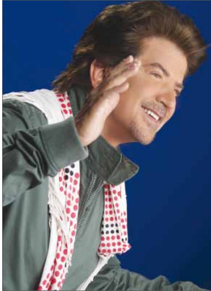
سجل مديحا في مناسبة رمضان

مشروع فيلم عن حياته يتولاه المخرج سمير حبشي