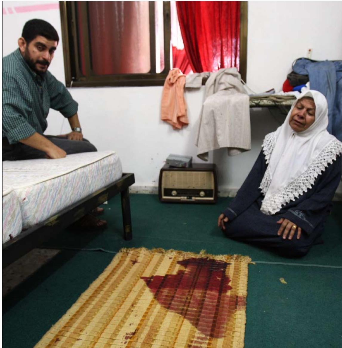
زوجة شلبياء وشقيقه يجلسان في غرفة النوم حيث تم اغتياله

على وقع المفاوضات المباشرة، ظهر أمس تصعيد للوضع الأمني في الضفة الغربية، تمثل بإقدام قوات الاحتلال على اغتيال قيادي في حركة «حماس» في الضفة الغربية، وسط تحذيرات إسرائيلية من تطوير الحركة لقدراتها الصاروخية