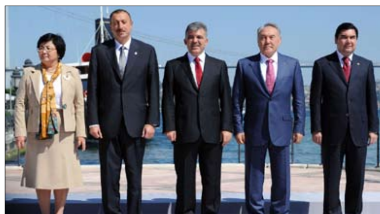
رؤساء الدول الخمسة في إسطنبول أول من أمس

نحن أمة واحدة، لكننا في 6 دول، ونحن فخورون للغاية بذلك. سنواصل جهودنا لإرساء مستقبل أفضل لشعبونا وللسلام في المنطقة والعالم». وكلام الأمة الواحدة الموجودة في 6 دول هو إسقاط للوصف التاريخي للعلاقات التركية - الأذرية (أمة واحدة في دولتين).