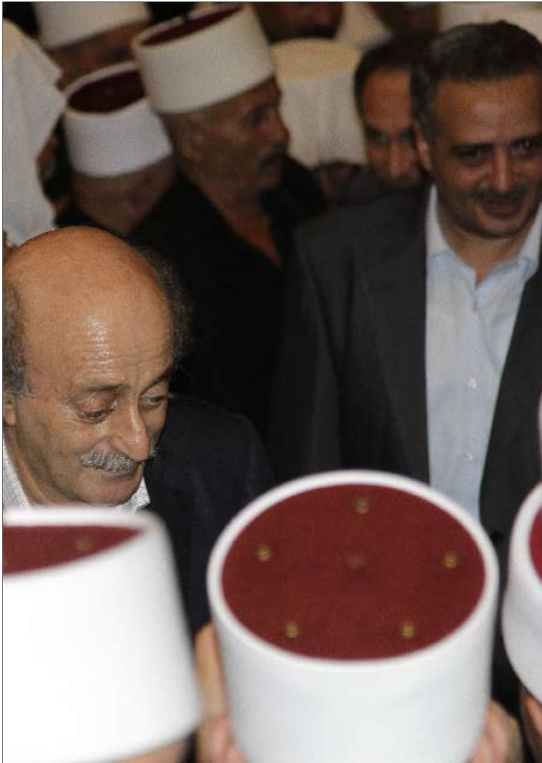
ما يبشر به جنبلاط في السياسة منذ انعطافه الأخيرة تحقق ميدانياً (أرشيف)