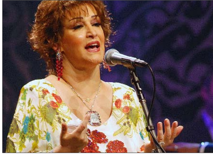
كان من المفترض أن تصدر ورثة الجزائرية البومين مع «روتانا»