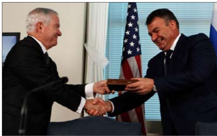
سيرديوكوف وغيتس في البنغازي

أكدت الإدارة الأميركية عزمها على تزويد حلفائها بالأسلحة الأميركية الحديثة في سياق ما تقول إنه دعم لاستقرار المنطقة. وقال الناطق باسم وزارة الخارجية الأميركية فيليب كراولي إن ذلك يصب في مصلحة الولايات المتحدة التي تسعى إلى تشجيع الاستقرار في المنطقة ومواجهة أي تهديد محتمل من إيران. وأضاف في إيجازه الصحفي «إننا نزيد عدداً من حلفائنا في الشرق الأوسط، مثل إسرائيل، بموارد عسكرية ومساعدات أمنية لأن ذلك يصب في مصلحتنا القومية للمحافظة على الأمن والاستقرار في المنطقة». وأضاف «نحن