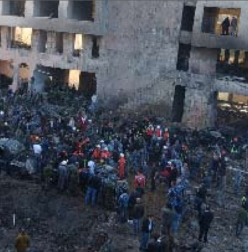
هل لشهود الزور علاقة بالمسؤولين عن جريمة 14 شباط 2005؟

لم ينجح المدعي العام الدولي دانيال بلمار في مجابهة طلبات اللواء جميل السيد بالحصول على وثائق تتيح له ملاحقة المسؤولين عن اعتقاله تعسفاً لنحو 4 سنوات. ففي الجولة الثانية قرر قاضي الإجراءات التمهيدية تأكيد اختصاص المحكمة النظر في طلبات السيد، وفتح جولة ثالثة من السجال تمتد عشرة أيام يحسم بعدها الأمر