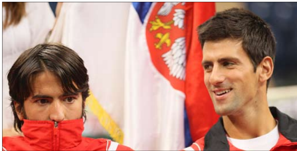
ديوكوفيتش ويانكو تيبسارفيتش خلال مشاركتهما في سحب قرعة نصف نهائي كأس ديفيس

وتأهلت إلى الدور نصف النهائي أيضاً الروسية ألكسندرا بلافينا بفوزها على مواطنتها كزينا بيرفاك 3.6 و1.6، وهي ستواجه في مباراتها المقبلة مع الصينية شويي زهانغ الفائزة على