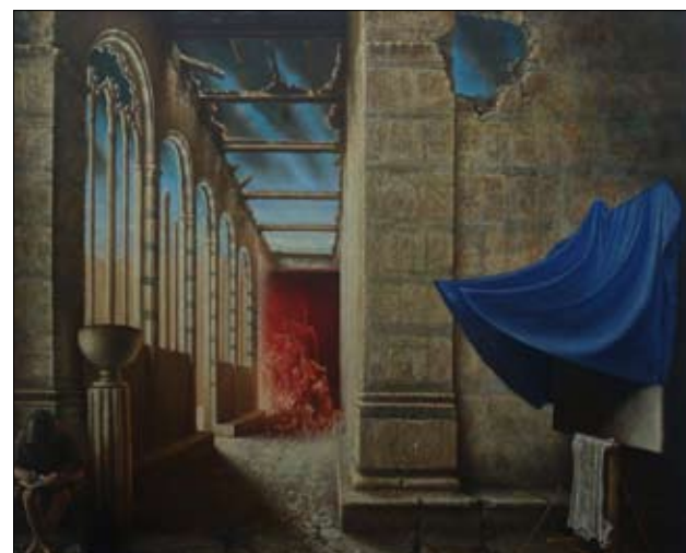
من لوحة «سيرة» (زيت على كانفاس - 140x160)

تراجميدية المشهد، نرى امرأة ثملة تنظف طفلاً بطريقة مقرفة أمام ناظري الملك، وفي الخارج مشاهد من حرب مستعرة. في مشاهد تلك المعركة، برجا «مركز التجارة العالمي» في نيويورك وإلى جانبها مئذنة لا يقل ارتفاعها عن ارتفاع البرجين... أما الملك