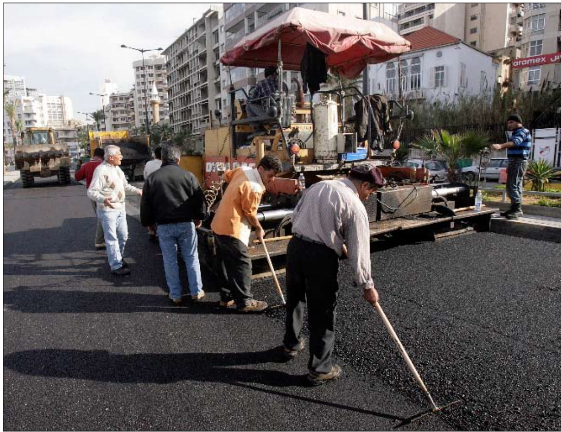
تبلغ كلفة تزفيت المتر المربع 7,5 دولارات وتشمل برش الطريق