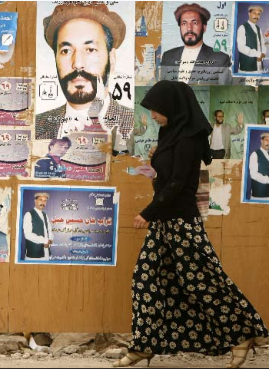
أفغانية بالقرب من صور للمرشحين في كابول امس

جديداً ولائحة بالناخبين المسجلين. بعدها، صاغت حكومة الرئيس حميد قرصاي، أحادياً، قانوناً انتخابياً جديداً، أقرّ تعيين الأعضاء الخمسة للجنة شكاوى الانتخابات من قبل الرئيس بالتشاور مع رئيس البرلمان، فيما كان سابقاً يجري تعيين 3 أعضاء أجنب من قبل الأمم المتحدة إضافة إلى 2 أفغان، لكن مجلس النواب رفض هذا الإجراء. وفي 23 تموز، مع إقفال باب الترشيحات، أطلق 2577 مرشحاً من 34 مقاطعة حملاتهم الانتخابية للمنافسة على 249 مقعداً في انتخابات مباشرة سيشرف عليها أكثر من 270 ألف مراقب أفغاني ودولي. والاقتراع سيكون وفق نظام