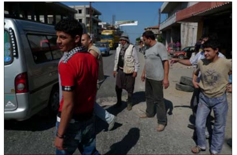
يطالب الأهالي بوضع مطبات لتخفيف سرعة السيارات