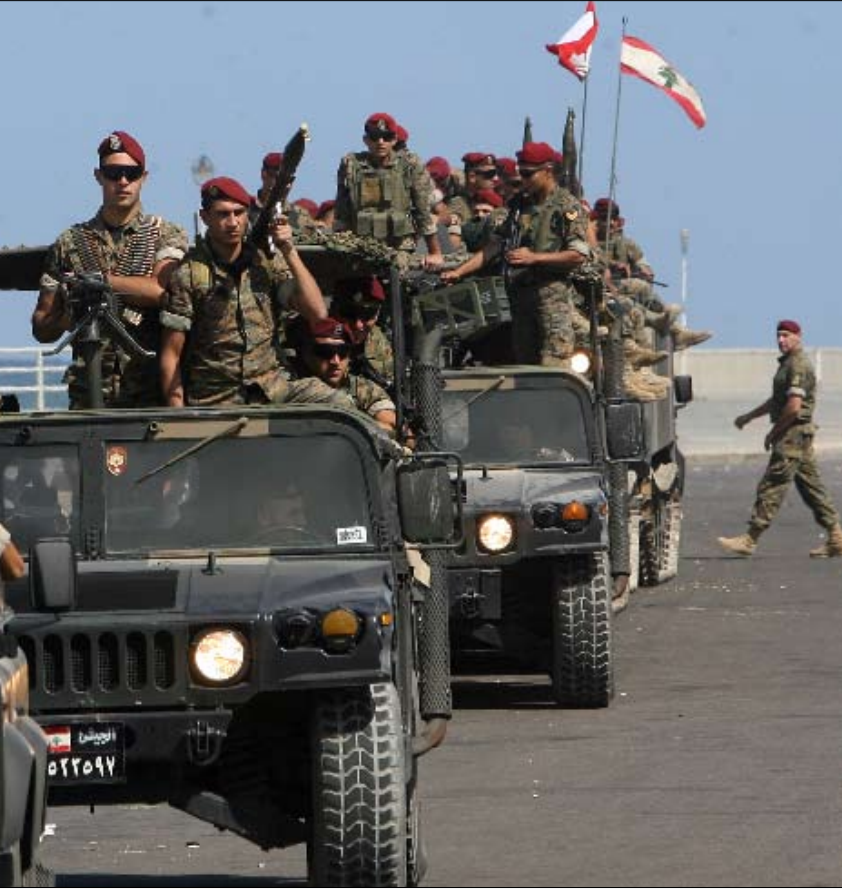
انتخابات صيدا كانت الأكثر اضطراباً

نحو التوافق في كل المناطق، وتحويل الانتخابات إلى مرحلة في منتهى الهدوء ومن دون صخب، وهي تستند في هذا القرار إلى توافق إقليمي، وكل ما تحصل عليه من مكاسب سياسية في المرحلة التالية على الانتخابات النيابية من الوصول إلى حكومة وحدة وطنية بالثلث الذي طالبت به، والوزراء الذين اقترحهم وأصرت على وجودهم، وصولاً إلى تحويل طاولة الحوار إلى مركز للنقاشات الهامشية.