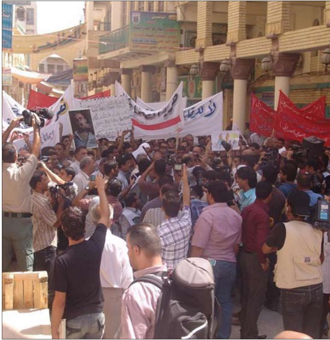
من تظاهرات للصحافيين العراقيين الصيف الماضي

أصدرت منظمة «مراسلون بلا حدود» بياناً، الأسبوع الماضي، أعلنت فيه استنكارها لـ«الاعتداءات التي يرتكبها الجيش الأميركي والجنود العراقيون والجماعات المسلحة في حق الصحافيين العراقيين». وأعلن البيان أنه منذ مطلع الشهر الحالي جرى التهجّم على ما لا يقل عن ثلاثة صحافيين. وأعلنت المنظمة: «نذكر مجدداً بأن تبني مشروع قانون يعني بحماية الصحافيين قد يسمح بتحسين ظروف عمل الإعلاميين. ويبدو أن تأخر البرلمان في مباشرة النظر في مشروع القانون المؤجل باستمرار منذ أيلول (سبتمبر) 2009 هو السبب الأساسي لاستمرار الاعتداءات المرتكبة بحق الجسم الصحافي العراقي».