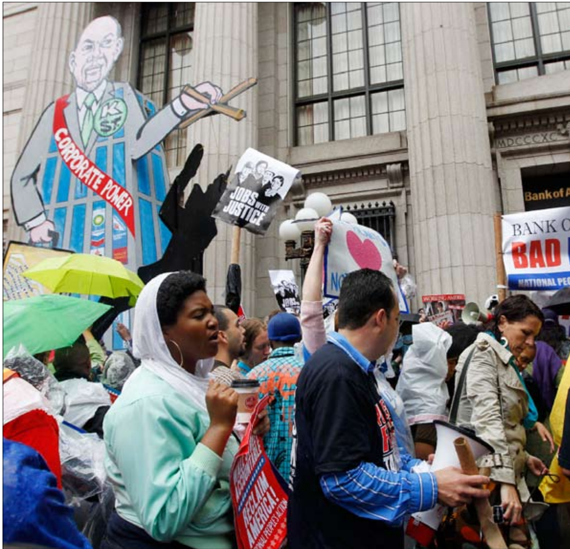
مظاهرون امام «بنك أوف أميركا»

شاركت في المؤامرة شركات استشارية مع مجموعة من كبار المصارف تشمل