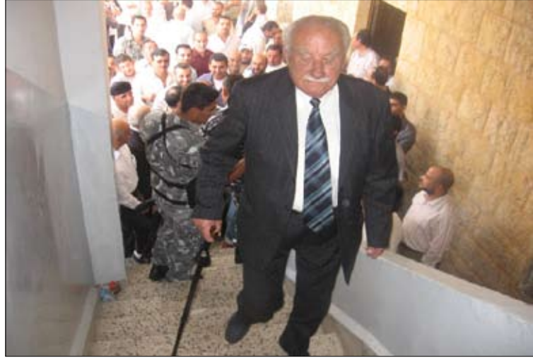
خلال الانتخابات الماضية في الضنية (الأخبار)

ومع أن سباقاً محموماً يدور بين مرشحي العائلات الكبيرة في هذه البلدات من أجل حمل لقب «الرئيس»، وهو تنافس يطغى على أي اعتبار آخر، فإن العائلات المتوسطة والصغيرة فيها لم تخف طموحاتها أيضاً، لجهة حرصها على تمثيلها داخل المجلس البلدي المقبل، أو اقتسام «الكعكة» الانتخابية التي أصبحت كبيرة في نظرها. فيطمح البعض إلى أن تنال عائلة أو أحد أفرادها مناصب المختار، على أن تنال عائلة أخرى أو أحد فروعها منصب رئيس البلدية أو التمثيل داخل المجلس البلدي. هذا على الرغم من أن عدد المقاعد محدود في هذه المجالس، إذ لا يزيد على 9 أعضاء، باستثناء القطين التي يضم مجلس بلديتها المستحدث 12 عضواً. ويبدو واضحاً في هذا البلدات أن