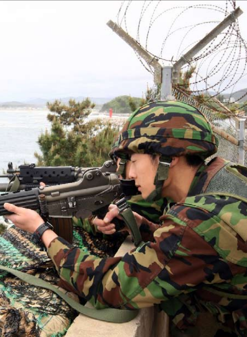
جندي كوري جنوبي في وضعية قتال في كانغونغ شرق سيول امس

بمساعدة من الولايات المتحدة واليابان، مهاجمتنا». وحددت هدفها بـ«إتمام مهمة التوحيد التي لم تنجز أثناء الحرب» التي خاضتها الكوريتان في عام 1950 واستمرت حتى عام 1953. وعلى الرغم من ارتفاع منسوب التوتر خلال اليومين الماضيين، مع قطع كوريا الشمالية خطوط الاتصالات الأساسية مع الجنوب والانسحاب من معاهدة «عدم الاعتداء» وطرد العاملين في منطقة «كاسونغ» الصناعية الحدودية والتهديد بقطع آخر طريق بري يربط بين الشمال والجنوب، يبقى خيار اندلاع حرب شاملة مستبعداً، لتكون المناوشات في عرض البحر الأصفر الأكثر ترجيحاً.