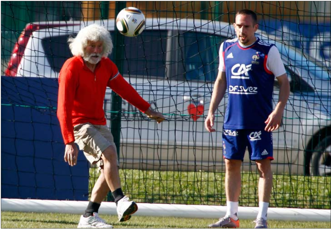
نجم المنتخب الفرنسي فرانك ريبيري يتابع مواطنًا محليًا يتلاعب بالكرة عقب الحصة التمرينية أمس في مدينة تينيس الألبية