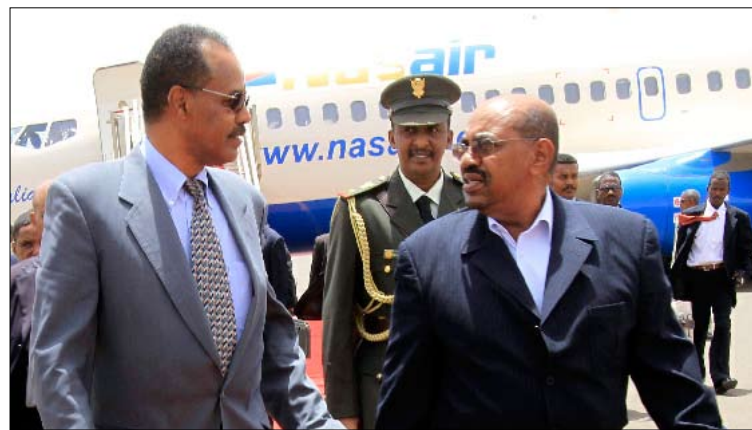
البشير يستقبل الرئيس الأيرتري إيسايس أفيوركي في الخرطوم أمس

الدولية. ونددت المنظمات الدولية المدافعة عن حقوق الإنسان، منها منظمة «العفو الدولية» و«هيومان رايتس واتش» والمنظمة الدولية لحقوق الإنسان، بمشاركة ممثلين عن الأمم المتحدة والاتحاد الأفريقي في حفل التنصيب. ووجهت رسالة إلى وزير الخارجية