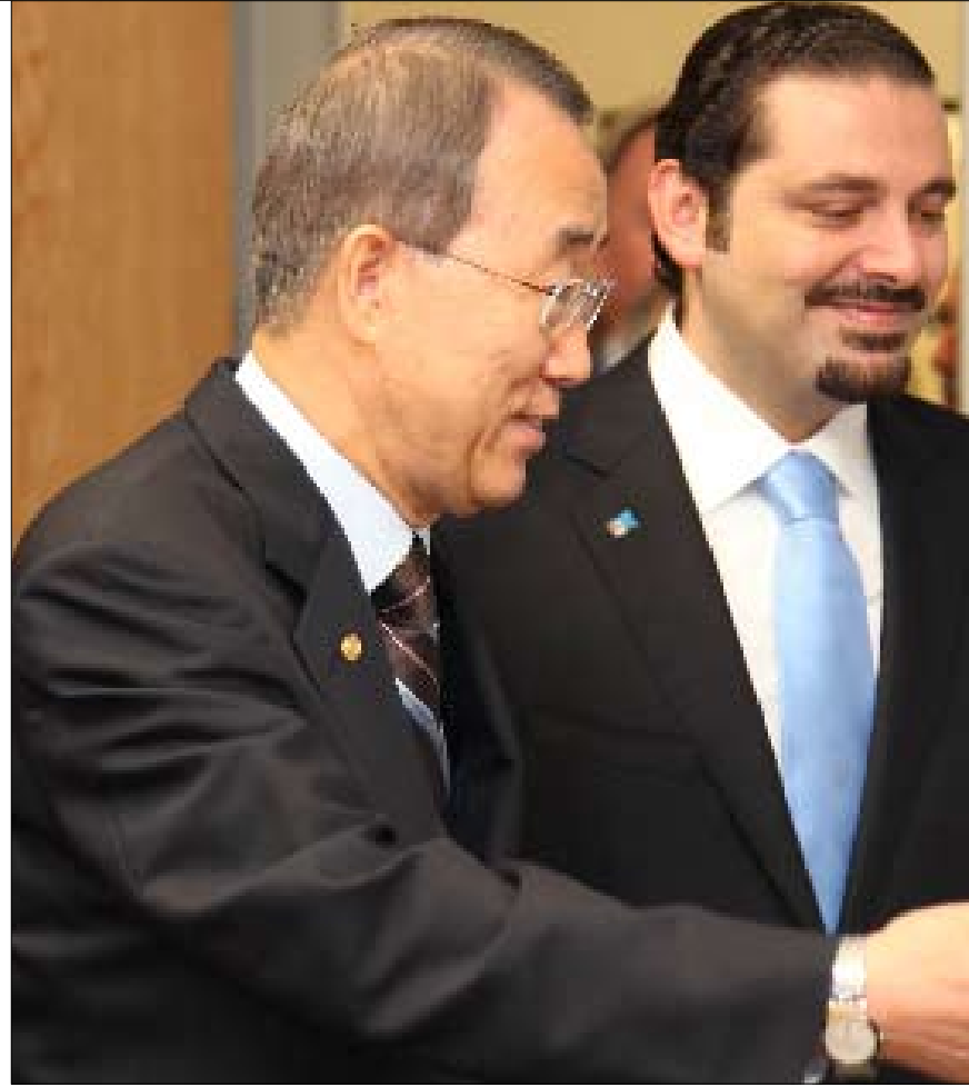
الحريري ويان كي مون في نيويورك أمس