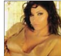
سيمون «حديث البلد» 21:15 ■ mtv

تناقش حلقة الليلة من برنامج «أكثر من عنوان» نتيجة تفاهم أزمة توزيع مياه نهر النيل بين دول المنبع السبع ودولتي المصب أي السودان ومصر. ويضيء على أسباب هذه الأزمة، وتداعيات التوقيع على اتفاقية لإعادة توزيع المياه، مع ضيوف اختصاصيين في هذا الملف.