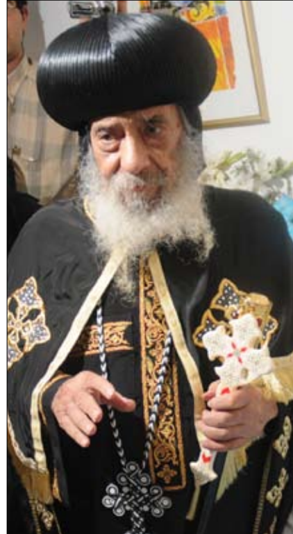
الابا شنودة

انديفكو (أفام) هي مجموعات مسيحية، إضافة إلى مجموعات أخرى رائدة نشطة.