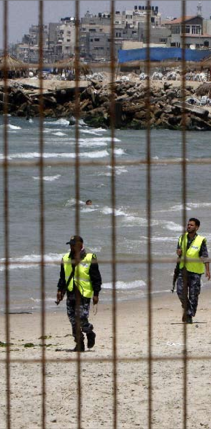
حماس، تتفقد شواطئ غزة استعداداً لاستقبال «أسطول الحرية» أمس

وتقول صحيفة «يديعوت أحرونوت» الإسرائيلية إن إسرائيل «لجأت إلى الحل العسكري بعد فشل الجهود التفاوضية مع الجهات المنظمة للقافلة البحرية، ورفضها عرضاً إسرائيلياً بنقل المساعدات إلى غزة بإشراف إسرائيلي». تفاصيل العملية العسكرية الإسرائيلية،