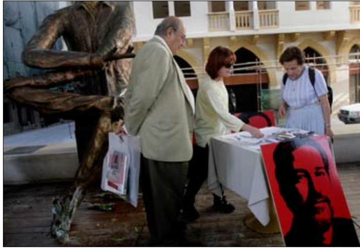
خلال الإحتفال بذكرى اغتيال سمير قصير العام الماضي (هينم الموسوي)

«جائزة سمير قصير» تمنح سنوياً في ذكرى اغتيال الصحفي اللبناني، بإشراف المؤسسة التي تحمل اسمه، بدعم من «بعثة الاتحاد الأوروبي في لبنان». وكما بات معروفاً، فإن النظام الداخلي للجائزة يدرج «إسرائيل» ضمن لائحة الدول التي يمكن