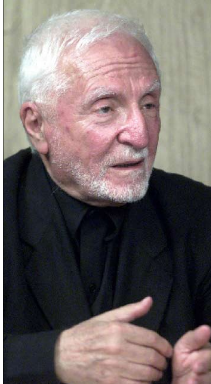
المطران غريغوار حداد (أرشيف)

بالنسبة للفنون الغنائية، أذكر دور المطربين اللبنانيين المسيحيين في كل العالم العربي (صباح - فيروز - ماجدة الرومي - جوليا بطرس - نانسي عجرم - وديع الصافي - فيلمون وهبه - زكي ناصيف - جورج وسوف وغيرهم). والشيء ذاته إنما على نطاق أوسع يقال عن الموسيقى والمسرح الغنائيين مع العائلة الرهبانية وتوفيق سكر وغيرهم. كذلك لا بد