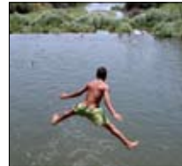
خناقة على «النيل» 21:00 ■ «الآن»

صباح اليوم موعدم مع النائب في كتلة «القوات اللبنانية» أنطون زهرا، ضمن برنامج «كلام بيروت» على شاشة «أخبار المستقبل». سيتناول الحديث تحضيرات «القوات» للانتخابات البلدية في الشمال، إضافة إلى آخر التطورات السياسية المحلية.