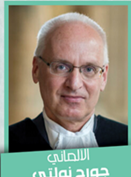
الألماني جورج نولتي