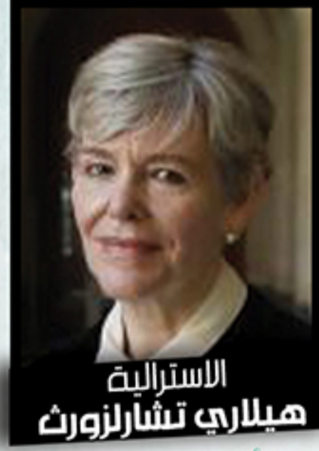
الاسترالية هيلاري تشارلزورث