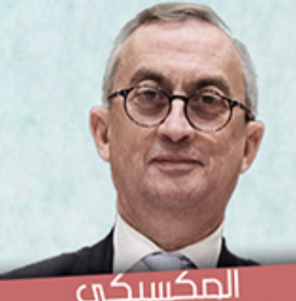
المكسيكي خوان فيردوزكو