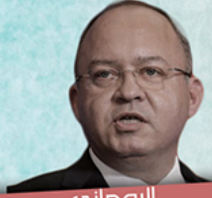
الروماني بوجدان أوريسكو