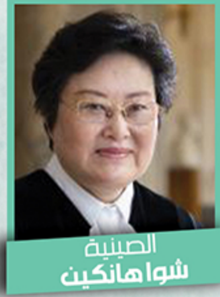
الصينية شوا هانكين