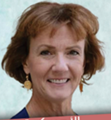
الأميركية سارة كليفلاند

هؤلاء القضاة تنتهي ولايتهم في 6 شباط 2024