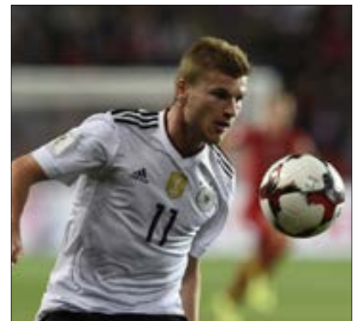
تابع ريال مدريد في مباراة ألمانيا والنرويج

للتعاقد مع البرازيلي فيليبي كوتينيو من ليفربول والأرجنتيني أنخل دي ماريا من باريس سان جيرمان الفرنسي، وهذا ما فشل النادي الكاتالوني في إتمامه في النهاية.