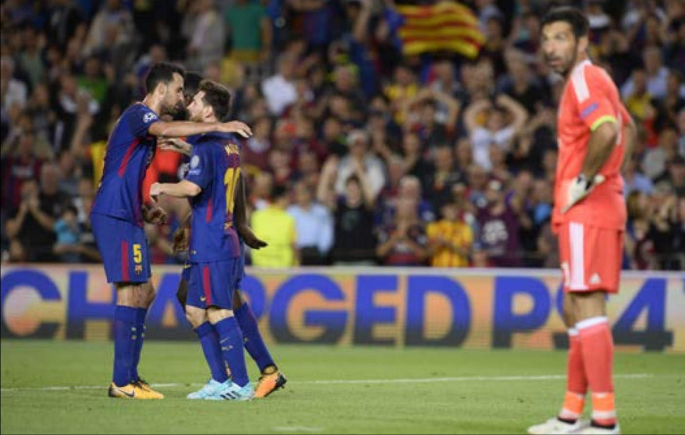
نار برشلونة لخسارته امام يوفنتوس الموسم الماضي

انطلاقة قوية لك من برشلونة وباريس سان جيرمان ومانشيستر يونايتد وتشلسي وبايرن ميونيخ في الدور الاول من بطولة دوري أبطال أوروبا. حيث أكد كل فريق على حدة ان هذه البطولة ستكون حامية الوطيس بشكل كبير هذا الموسم، والصراع على اللقب لن يكون سهلاً على أي منهم