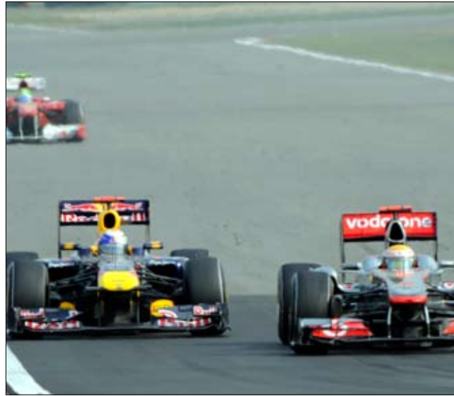
هاميلتون متخطياً فيتيل