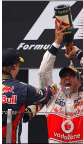
...ومحتفلاً معه

وانقض باتون وهاميلتون على الصدارة مبكراً على حساب فيتيل الذي انطلق من المركز الأول، إذ جاءت انطلاقته بطيئة جداً فوجد نفسه خلف باتون عند الأمتار الأولى، ثم خلف هاميلتون الذي ضغط عليه وانتزع المركز