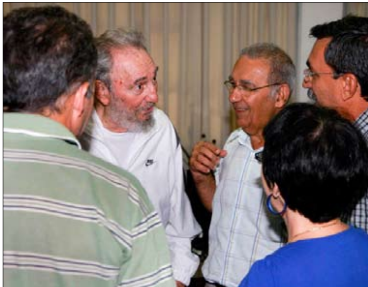
كاسترو بين موظفي «المركز الوطني للأبحاث العلمية»

للمرة الأولى منذ أربع سنوات، ظهر الزعيم الكوبي فيديل كاسترو نهار الأربعاء الماضي في حفل عام بمناسبة مرور 45 سنة على تأسيس «المركز الوطني للأبحاث العلمية». وقد تجمع العاملون في المركز عندما أدركوا أن زعيم الثورة حاضر بينهم، والتقطوا صوراً له على أجهزتهم الخلوية بدأت تظهر على المدونات الموالية للثورة. وقد صدر أول من أمس تأكيد رسمي للزيارة على موقع «كوبا ديبارتي»، مزوداً بخمس صور التقطها نجل الزعيم المصور اليكس كاسترو. وتدل الصور على أن فيديل، الذي كان يرتدي لباسه الرياضي الذي صار لباسه شبه الرسمي منذ مغادرته السلطة،