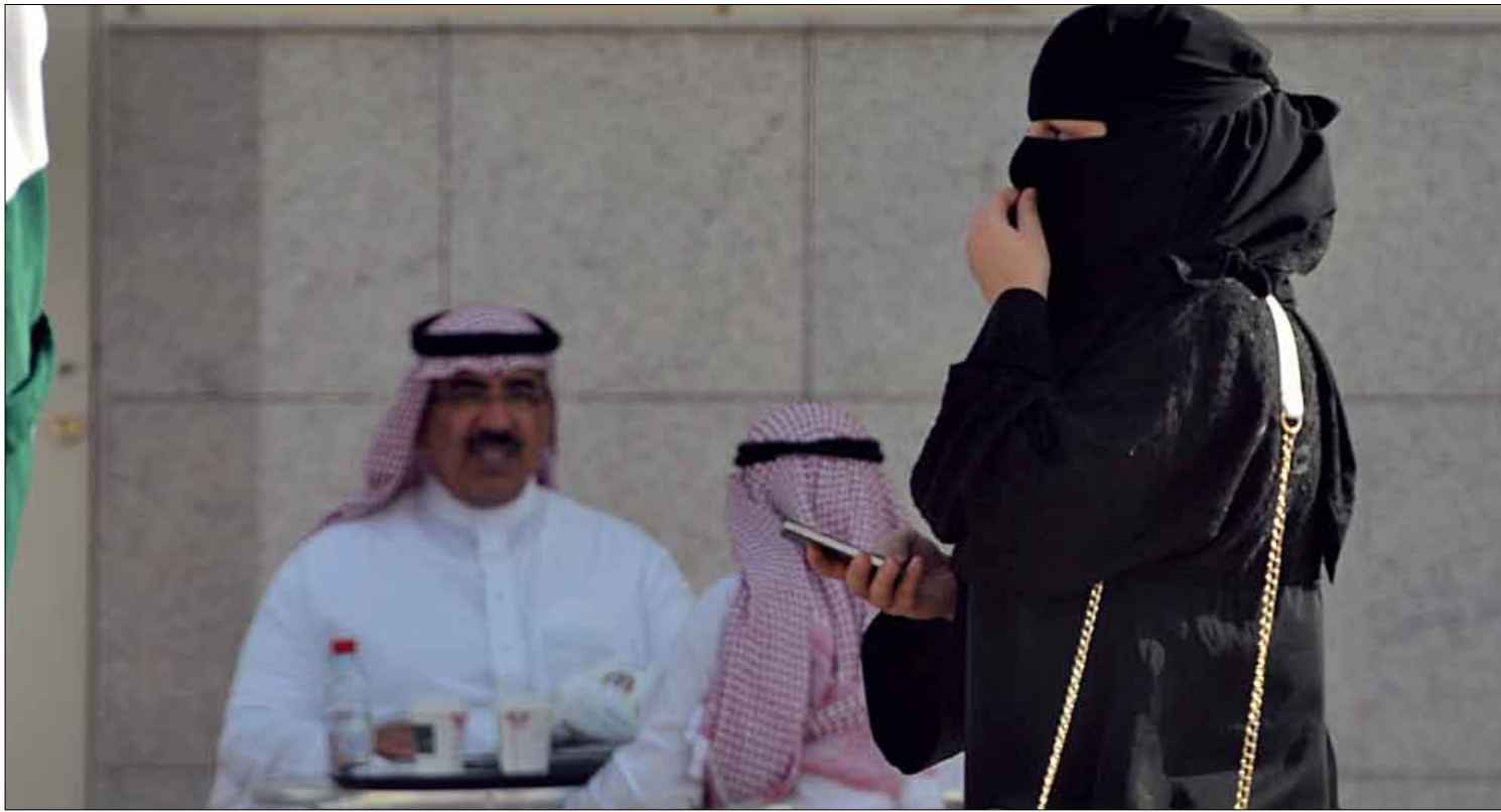
يعمل اليمنيون في مهن يرفض السعوديون الأشتغال فيها

تنازلت صنعاء عام 2000 عن عسير وجيزان ونجران للسعودية إلى الأبد