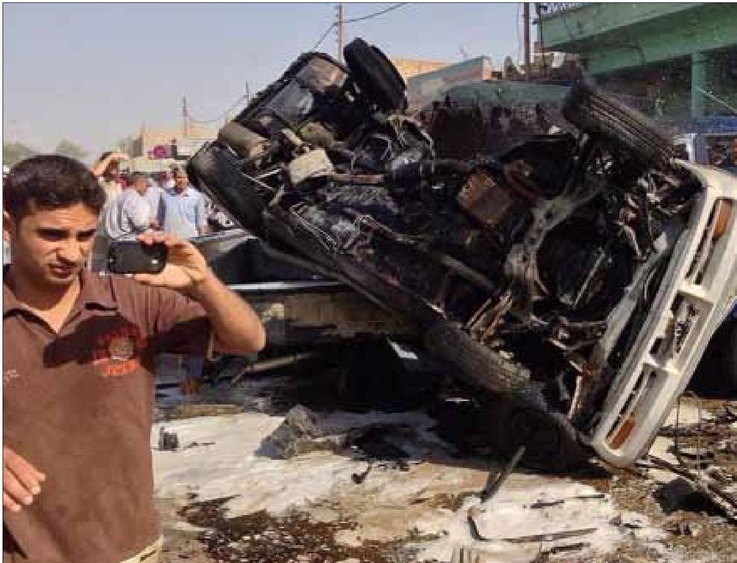
بمراجعة بسيطة لما يعم ديار المسلمين عصبية ثارية تجتاح البلاد والعباد ولا علاقة للدين فيها أو المذهب

وحرية المنافسة. وهكذا، انتشت أفكار بفعل فلسفة التسامح، من مثل: النزعة الفردانية والإنسية والعقلانية المفرطة، والتعددية. وصولاً إلى قيم التسامح الثقافي والليبرالية. أما في الأفق الإسلامي، فإننا نكاد نجزم بأن فكرة التسامح انطلقت من مفهوم العفو والرجاء الإيماني، وأن على الإنسان أن يمارس فعل العفو على الأرض ومع الناس، كذلك فإنه يطلبه من رب السماء، وارتبط هذا المفهوم بالبعد الأخلاقي، وكان نقبضاً لمفهوم «الفضيلة»، وهذا ما أشار إليه القرآن الكريم «وَلَوْ كُنْتَ فَظًّا غَلِيظًا لَلْقَلْبُ لَأَنفَضُوا مِنْ حَوْلِكَ» [4]. وارتبط بالسلوك الاجتماعي - السياسي، كما جاء في الحديث النبوي الشريف «آلة الرئاسة سعة الصدر»، أي القدرة على التحمل وتحمل من نختلف معه. وفي زماننا هذا، شهدت الساحة الثقافية في بلاد المسلمين نقاشاً في الدين والتسامح في