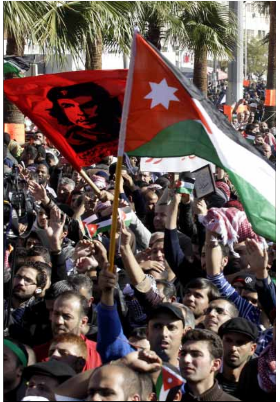
خلال إحدى التظاهرات في عمان