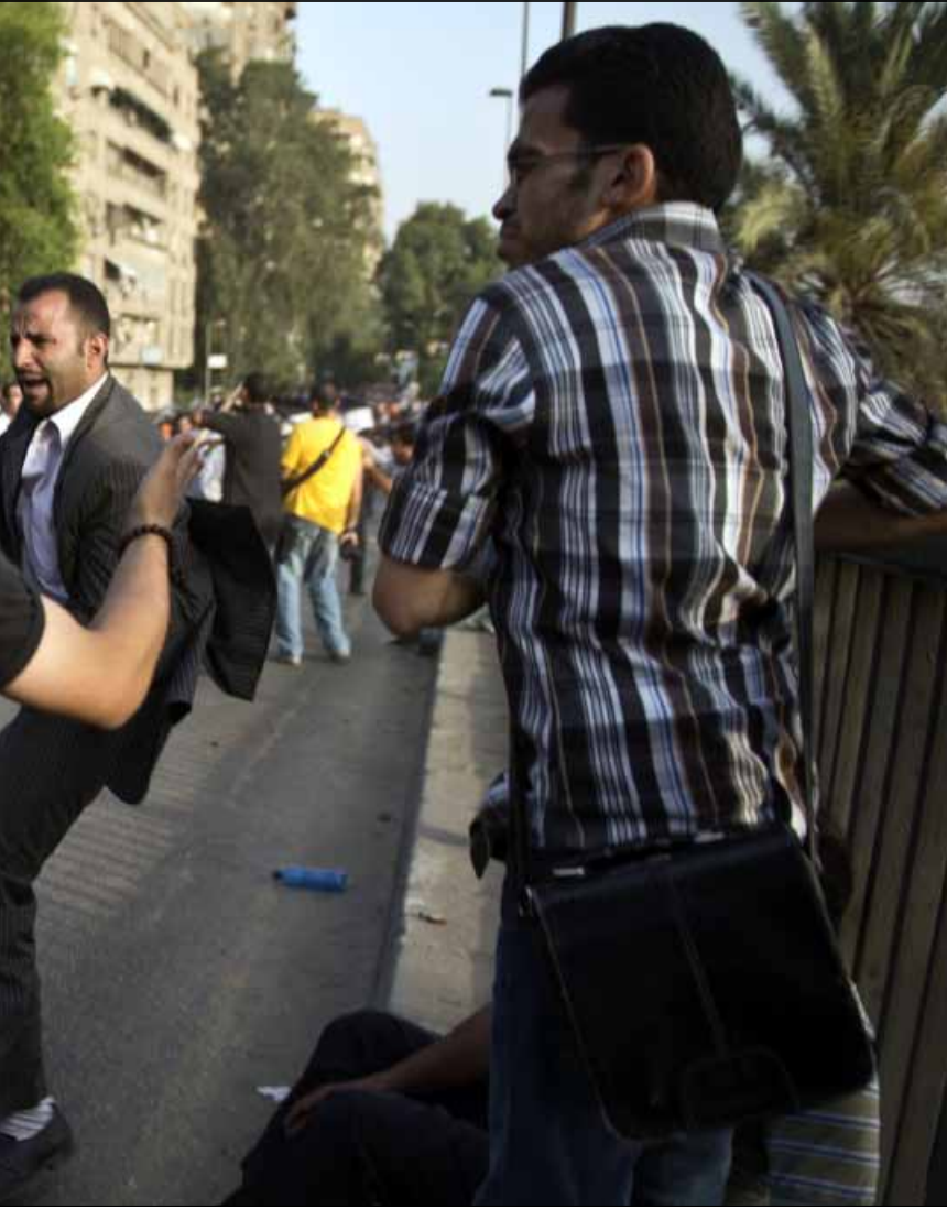
تعرض الإخوان للاعتداءات في أكثر من محافظة

فيما تحتشد جماعة الإخوان وبعض التيارات الإسلامية اليوم في «لا للعنف»، سادت البلاد حمى بيانات وفتاوى على وقع أعمال عنف اندلعت بين بلطجية ومعارضين للإخوان من جانب، والجماعة وأنصارها من جانب آخر؛ مواجهات تؤشر إلى سيناريو عنف يلوح في أفق اليوم الموعد