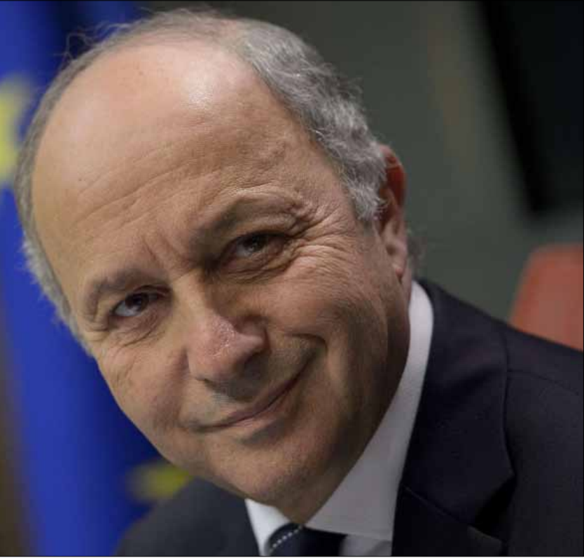
فابؤوس: لن نسلم سلاح للمعارضة السورية ممكن أن يشكل تهديدا علينا

السلاح إلى المعارضة السورية، محذراً من أن «من يورد السلاح للمعارضة السورية يجب عليه أن يكون متأكدًا بالكامل أن هذا السلاح لن يقع في يد الجهاديين والارهابيين». كذلك أكد رفضه للحل العسكري، مع ضرورة الاهتمام بالحل السياسي حتى وإن لم تكن فرص نجاحه كبيرة. في إطار آخر، أعرب وزير الخارجية العراقي هوشيار زبباري عن خشيته من أن سياسة بلاده الرسمية المتسمة بالحياد تجاه سوريا أصبحت مهددة مع تحول الصراع إلى حرب بالوكالة في المنطقة بأسرها وسط ضغوط هائلة تتعرض لها بغداد. وفي مقابلة مع وكالة «رويترز»، أكد زبباري أن حكومة بلاده اتخذت «موقفاً