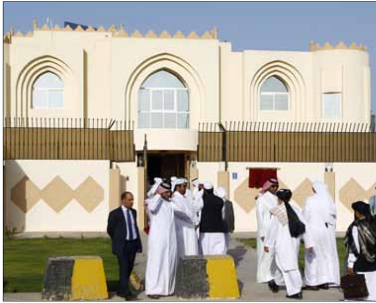
مكتب حركة طالبان في الدوحة

لصادراتها من الغاز في الأمريكيتين وأوروبا وآسيا. لكن تغييراً محتملاً في القيادة، أشار إليه دبلوماسيون عرب وغربيون، قد ينتهي إلى تخلي الأمير حمد بن