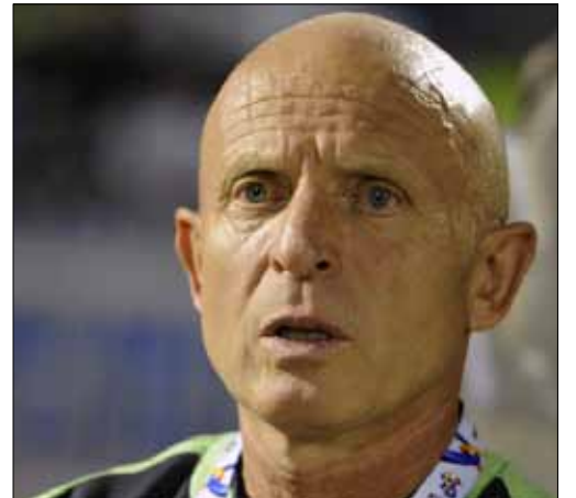
الأهلي سيفتقد مديره ياروليم الذي انتقل إلى الوحدة

تخوض الفرق العربية مواجهات صعبة في ربع نهائي دوري أبطال آسيا لكرة القدم بموجب القرعة التي سحبت أمس، في حين تكرر المواجهة بين القادسية الكويتي والشرطة السوري في كأس الاتحاد