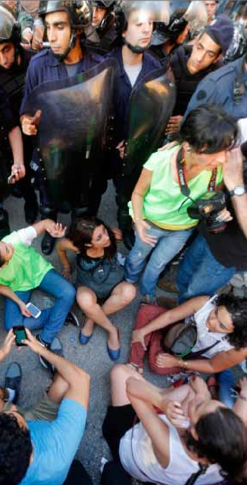
اصيب اثنان من المشاركين بجروح طفيفة كما اصيب عنصر من مكافحة الشغب

رمى المعتصمون البندورة وعبوات المياه على القوى الامنية، وكلما اقترب التدافع من الخط الاحمر الذي رسمته القوى الامنية، ارتفعت الهراوات مهددة ومتوعدة النشطاء في الصفوف الامامية. لم يمض وقت طويل قبل ان تبدأ المعركة الفعلية، اكثر من خمس محاولات للهجوم باتجاه القوى الامنية انتهت بسقوط الهراوات على رؤوس المتظاهرين. لم تنفع تغريدة الرئيس ميشال سليمان المؤيدة للحراك المدني شرط ان يبقى في اطاره السلمي، ولا مناشدته للقوى الامنية «التصرف بحكمة وهدوء مع المتظاهرين». الضباط الذين وقفوا خلف العسكر المرصوص دفاعاً عن المجلس النيابي لا يملكون حسابات على تويتر وهواتفهم الخلوية لا تتلقى الاوامر من قصر بعبدا. التعليمات واضحة «ممنوع اقتراب اي متظاهر من ساحة النجمة مهما كلف الامر».