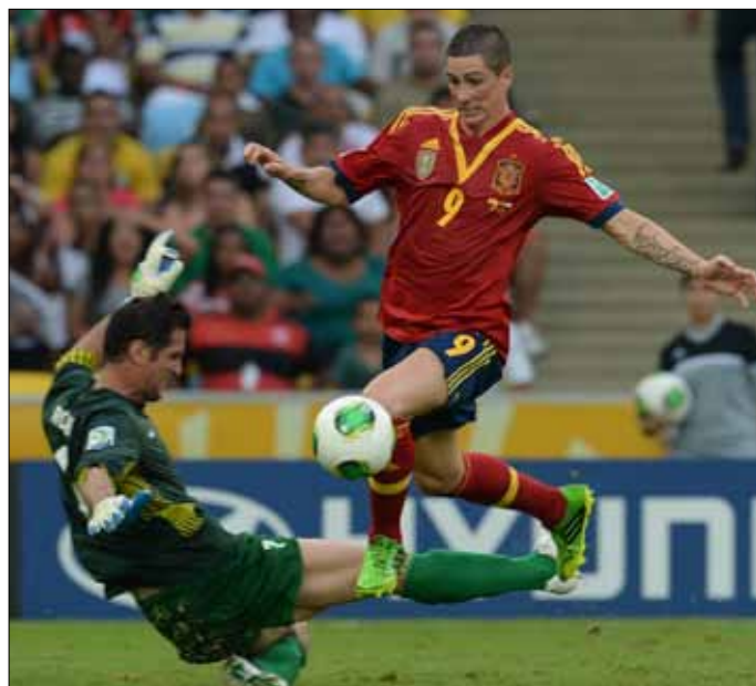
توريس متخطياً الحارس روش في طريقه لتسجيل أحد أهدافه الأربعة

تحقيق فوز لافت على وصيف بطل أوروبا بعد تقدمه بهدفين عبر كيسوكي هوندا الذي سجل من ركلة الجزاء في الدقيقة 21، وللاعب مانشستر يونايتد شينجي كاغاوا في الدقيقة 33. لكن المنتخب الإيطالي عاد بقوة فقلص الفارق قبل نهاية الشوط الأول بأربع دقائق عبر دانييل دي روسي. وواصل عبر دانييل دي روسي، وواصل في غضون دقيقتين، عبر اتسوتو أوشييدا الذي سجل خطأ في رمي منتخب بلاده (50)، ثم عبر ماريو بالوتيلي من ركلة جزاء (52). وارتفع مستوى الإثارة بعدما عادل اليابان 3-3 عبر شينجي اوكاواكي في الدقيقة 69، قبل أن يخطف البديل سيباستيان جوفينكو هدف الفوز لإيطاليا قبل أربع دقائق على نهاية المباراة.